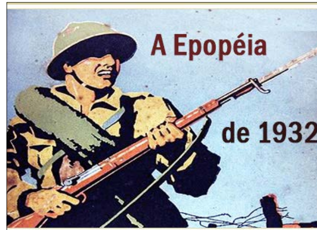
A epopeia de 1932

O nosso povo ordeiro e trabalhador conheceu a verdadeira democracia, na História da nossa famigerada republiqueta das bananas, a democracia do governo pelo povo, nas eras Vargas e governos militares. Ou algum analfabeto funcional acredita que o Congresso Nacional não funcionava melhor que o famigerado de hoje? Falando em Congresso hoje é para ter eleição na Câmara dos Deputados.