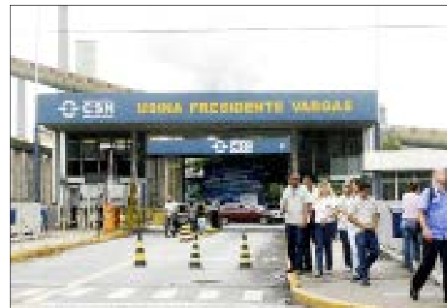
CSN tem lucro líquido de R$ 2,37 bilhões no 4º trimestre por negócios de mineração

lembrar a primeira siderúrgica, primeira refinaria e poço de petróleo na Bahia, primeira estrada pavimentada, primeira hidrelétrica, salário mínimo, Petrobras... E ainda tem apedeuta chamando isso de ditadura. A democracia no Brasil é às avessas: o que chamam de democracia é cleptocracia.