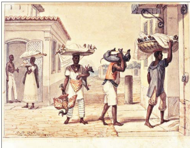
"Presentes de Natal", 1827, aquarela de Debret, francês que desenhou o losango na Bandeira do Brasil