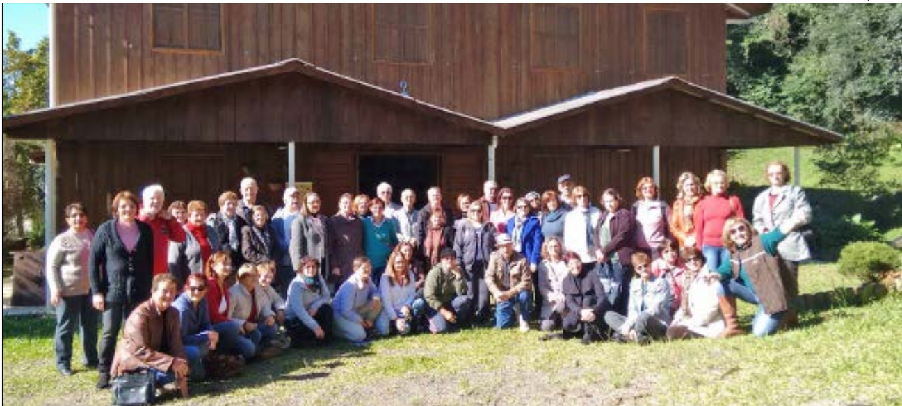
Turma da Uniti de São Miguel do Oeste conheceu o Museu Histórico Professor Edvino Carlos Hölscher, localizado em Guaraciaba