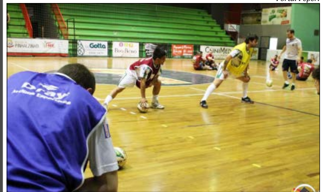
Apesar do esforço, Asme não conseguiu a classificação