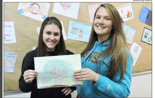
Alunas criaram a ONG durante aula de Geografia

Um dos exemplos apontados pelo professor foi o risco da poluição de rios para o desenvolvimento de atividades de cunho turístico. O educador entende que o desenvolvimento de forma sustentável encontra inúmeros desafios. Enumera ainda as crescentes desigualdades e disparidades de oportunidades, de riqueza e poder existente mundo afora.