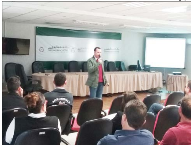
Reuniões foram realizadas em São Miguel do Oeste e Palma Sola na última semana