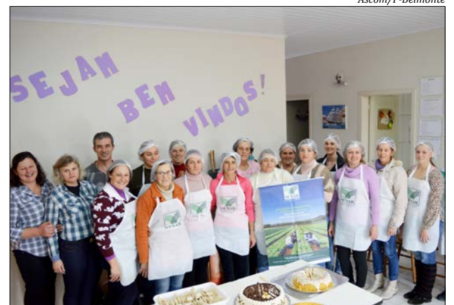
Grupos mulheres da agricultura familiar foram beneficiadas pela iniciativa

Essa é uma ação que visa o fortalecimento da agricultura familiar, fomentando a integração desses grupos de mulheres, que além de se qualificarem tem a oportunidade de se relacionar trocando experiências.