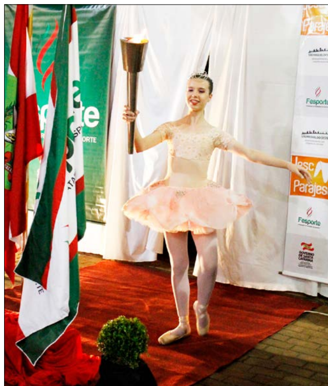
Fogo olímpico que entrou nas mãos de uma bailarina que abriu a apresentação de dança