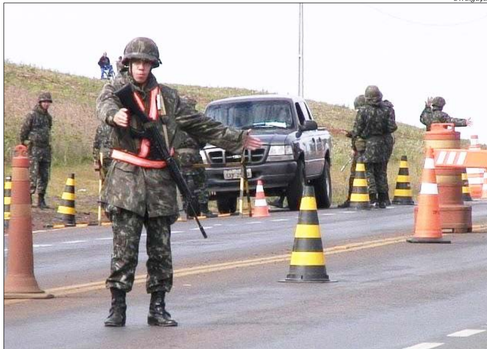
A exemplo da Operação Ágata, militares estão participando da fiscalização nas estradas em Guaraciaba e Maravilha

De acordo com o coronel Marcelo Zucco, comandante do 14º Regimento de Cavalaria Mecanizado (RCMec), serão oito dias de fiscalização e, neste período, as barreiras funcionarão 24 horas por dia. Conforme Zucco, a união das instituições de segurança pública é essencial para o sucesso de ações como essa.