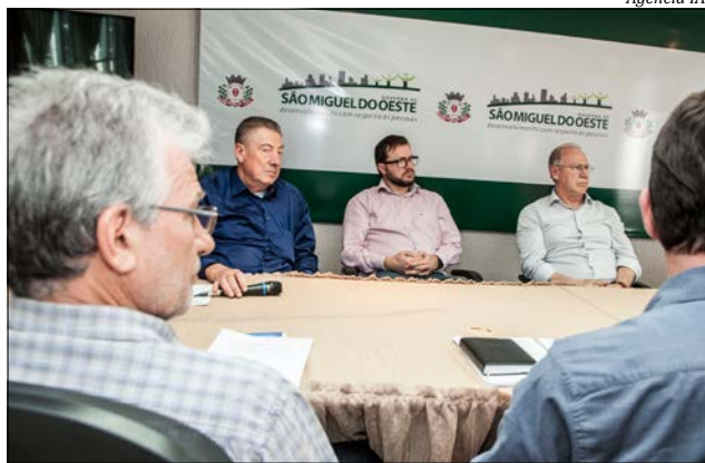
Entidades levaram à administração a preocupação do setor com a demora na liberação de projetos

Baseado nesse panorama o Sinduscon e Assenar apresentaram sugestões que podem facilitar a retomada do crescimento econômico do setor no município. As sugestões apresentadas são a redução momentânea da tributação do ITBI, observância dos valores constantes dos contratos de incorporação imobiliária e a implementação imediata das alterações legislativas já sugeridas ao município ainda em 2014. "Essas demandas são importantes para que o setor da construção civil consiga atravessar o momento de crise mantendo superavitários os índices de empregabilidade e continue a contribuir com o crescimento econômico do município", acrescentou Lunardi.