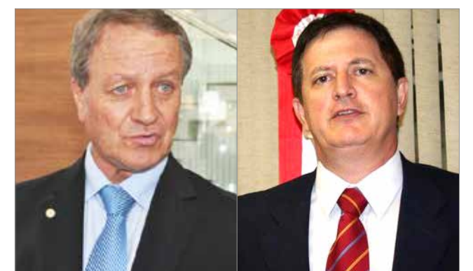
Deputado Federal Valdir Colatto e o diretor de Operações do Badesc, João Carlos Grando, vão palestrar no seminário

Na obra, o leitor aprenderá como funcionam as políticas públicas para os diversos setores e como a união de forças é importante para o fortalecimento e construção da cidadania. O livro contém todos os passos para se estruturar uma cooperativa ou associação dentro da legislação vigente do País. APOIOS O livro, que já vinha sendo elaborado há mais de 18 meses, angariou o apoio de diversas entidades e empresas, que colaboraram na forma de apoios culturais, viabilizando o projeto. A obra já conta com 800 exemplares vendidos antes mesmo do seu lançamento oficial e vai estar em todas as cooperativas de Santa Catarina e em boa parte do Brasil, numa tiragem de 10 mil exemplares em sua primeira edição.