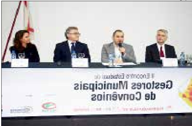
O evento reuniu mais de 100 participantes, entre gestores municipais de convênios, prefeitos e demais profissionais