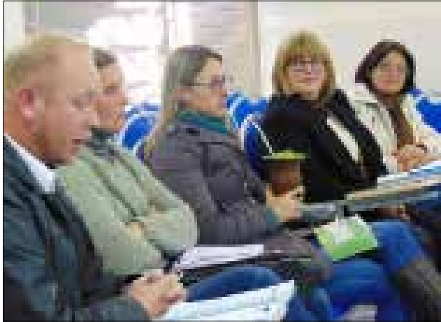
O encontro também possibilitou o repasse de informações sobre a Auto Declaração de Pontos de Cultura e o Sistema Municipal de Cultura

O encontro também possibilitou o repasse de informações sobre a Auto Declaração de Pontos de Cultura e o Sistema Municipal de Cultura. Sobre a reunião, a coordenadora do Colegiado e dirigente cultural de