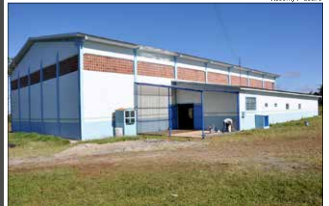
Obras de reforma foram entregues ontem

A Administração Municipal de São José do Cedro realizou ontem, terça-feira, 14, às 14h30, a entrega oficial da obra de reforma do Ginásio de Esportes da linha São Roque. O ato teve a participação de moradores da linha e das comunidades vizinhas. Na ocasião, houve a explanação do projeto de abastecimento de água para as linhas São Roque e Chaleira.