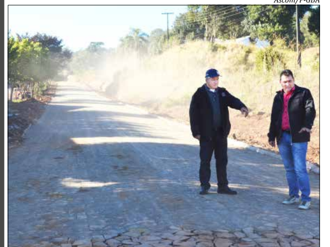
O projeto conta com quase 4.600 metros quadrados de extensão, totalizando o investimento de R$ 250,2 mil

Além da Avenida Menegasso na Linha Sede Flores, as Ruas Santos Dumont e Bandeirante na Linha Ouro Verde receberão 1.600 metros quadrados de pavimentação com pedras irregulares, assim como a Rua Presidente Costa e Silva na Linha Guataparema com 1.800 metros quadrados. Ao todo, o projeto conta com quase 4.600 metros quadrados de extensão, totalizando o investimento de R$ 250,2 mil.