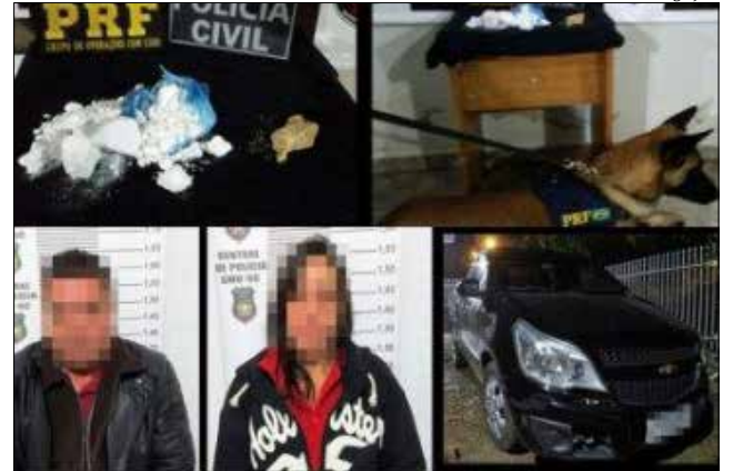
Após a operação, casal foi recolhido à Cadeia Pública

Por volta das 17h30 de sexta-feira, foi dado cumprimento a um mandado de busca e apreensão no local, porém nada de ilícito foi encontrado. Na diligência, porém, policiais perceberam que uma