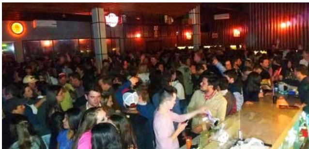
A gelada noite de sexta e madrugada de sábado não foi empecilho para que a moçada lotasse o Joy Lounge Bar. Ambiente climatizado aqueceu o público que foi semelhante ao da inauguração. A promoção 'Contrago: o melhor resultado líquido' foi realizada pelo 7º período A e B de Ciências Contábeis da Unoesc

Ou seja: não publicá-las é perdem leitores, ouvintes e telespectadores. Mesmo assim, se tivesse um meio de comunicação, não noticiaria.