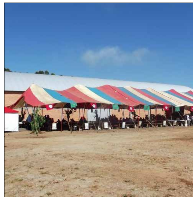
Unidade de beneficiamento de semente crioula em São Miguel do Oeste

A crise de oferta de milho no mercado brasileiro tem gerado situações dramáticas e em Santa Catarina já há as primeiras mortes de frango por ausência de ração no Oeste catarinense, região tradicional de agroindústrias produtoras de proteína animal no Brasil. Em Cascavel, no Paraná, somente em uma propriedade mais de 34 mil aves, que estavam com 35 dias de vida, morreram de fome.