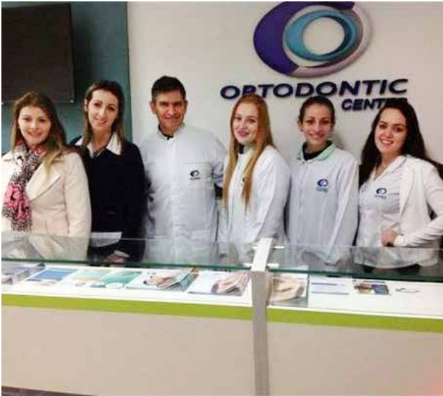
Equipe da unidade da Rede Ortodontic Center de São Miguel

O consultório fica na Rua 7 de setembro, 2170, sala 103. Telefone: 3622-0753.