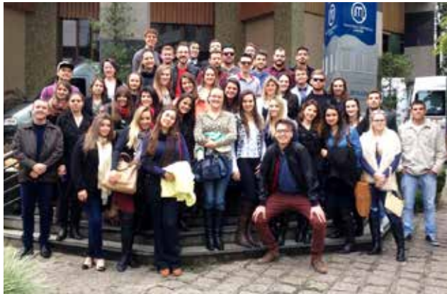
Grupo de acadêmicos e professores da Unoesc, campus de São Miguel, que participou do XII Simpósio Nacional de Direito Constitucional em Curitiba. Foram três dias de extremo aprendizado, além de conferências com os mais renomados juristas do cenário jurídico brasileiro.