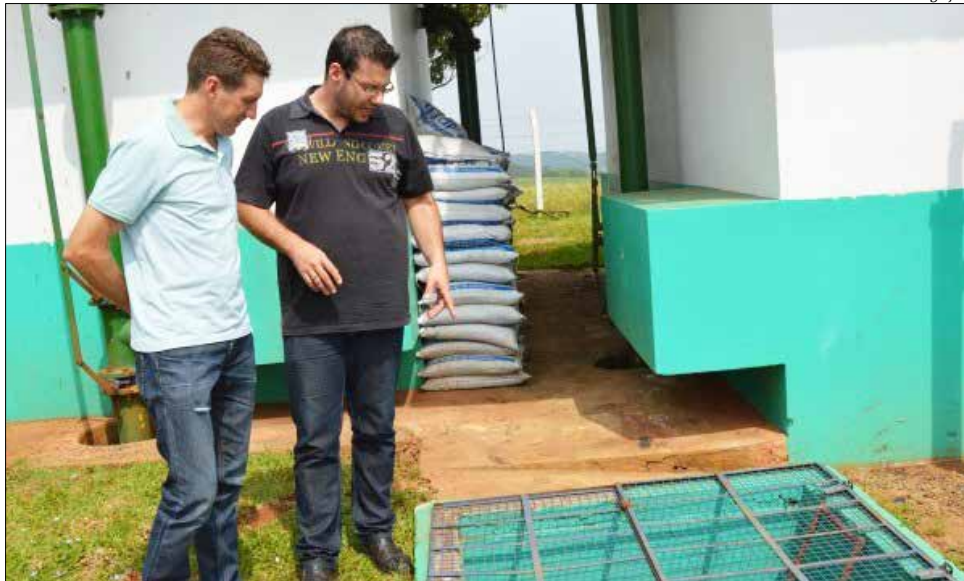
Água distribuída nos pontos onde estão as creches foi analisada após coleta

De acordo com o Semae, o resultado das análises foi extremamente positivo, tendo em vista a procedência do laboratório que analisou as amostras, a Terranálises - Laboratório de Análises Ambientais. Foram analisados os parâmetros de cor aparente, turbidez,