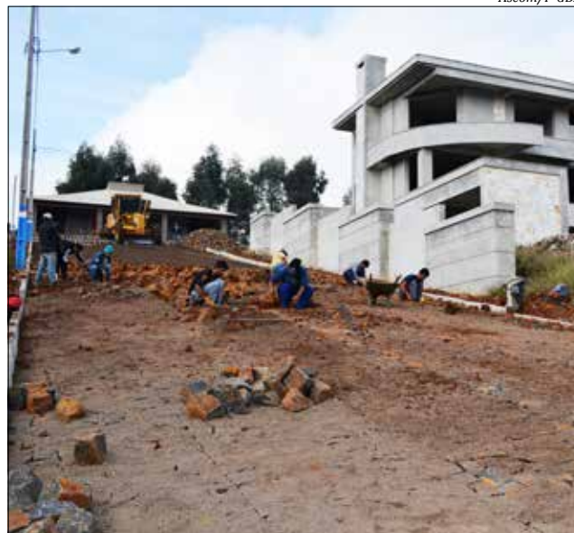
A obra está na sua etapa final, concluindo já nos próximos dias

Além destas ruas serão beneficiadas as Ruas Antônio Caetano Arpini, Bruno Francisco Hoffmann, Luiz Scalco, Presidente Vargas, Sestivo Armando Montagna e Tiradentes. Conforme a Administração foi assinado no início de abril em Florianópolis, um financiamento junto à sede da Agência de Fomento do Estado de Santa Catarina (Badesc), o contrato de R$ 996,3 mil para estas obras.