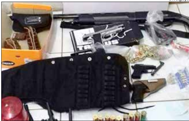
Durante as operações, armas, munições e dinheiro foram apreendidos

A Operação Fox foi desencadeada no dia 18 de maio pela Delegacia de Polícia de Sarandi. Foram cumpridos 15 mandados de busca e apreensão e três mandados de prisão preventiva. A ação resultou na prisão de três pessoas e apreensão de