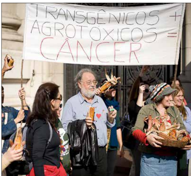
Mobilização contra o plantio e consumo de sementes geneticamente modificadas

Nos últimos anos, esquerdopatas de toda ordem se fartaram com votos pregando os malefícios dos transgênicos. Até analfabetos de pai e mãe discursavam como se fossem doutores no assunto. Ameaçavam os consumidores dos transgênicos nos moldes da igreja medieval, que aterrorizava os seus fiéis com a figura do Diabo.