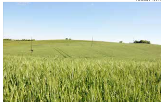
Lançamento do livro foi realizado quinta-feira

Durante o ato de lançamento foi entregue uma menção honrosa às famílias pioneiras, como forma