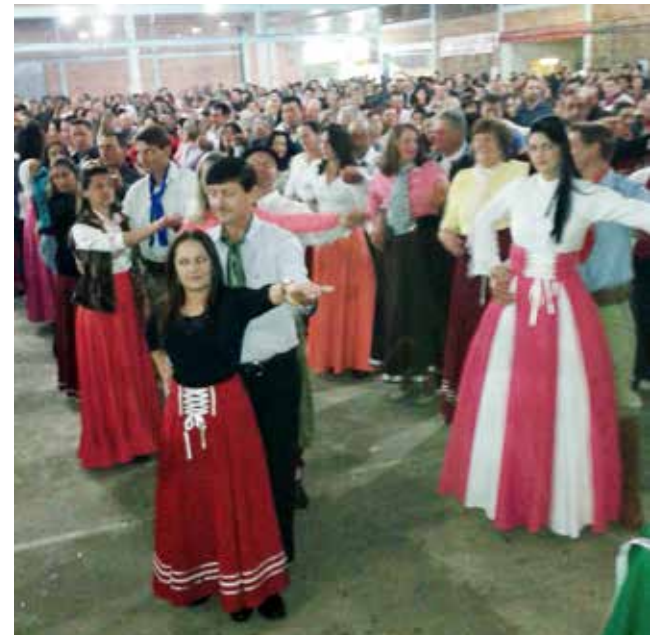
Cerca de 120 casais receberam o canudo

Cerca de 120 casais receberam o canudo de dança da escola "Me ajude que eu te ajudo", no Parque de Exposições Rineu Gransotto, na noite de sábado. Na programação um mega-baile com presença especial do renomado cantor Gaúcho da Fronteira. As apresentações dos alunos encantaram a todos em uma formatura rápida e muito bem organizada. Centenas de pessoas estiveram no parque onde a diversão esteve garantida. A escola está há mais de 20 anos levando as tradições gaúchas pelo Brasil a fora.