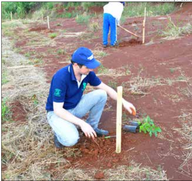
Ação faz parte da programação da Semana do Meio Ambiente