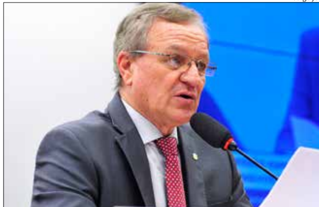
Em audiência com o ministro da Agricultura, Blairo Maggi, o deputado federal Valdir Colatto expôs a situação da falta de milho em Santa Catarina

A saca, que no fim de 2015, saía para os produtores do Oeste catarinense em torno de R$ 35,00, agora custa quase R$ 60,00. De acordo com a Companhia Nacional de Abastecimento (Conab), cada produtor tem