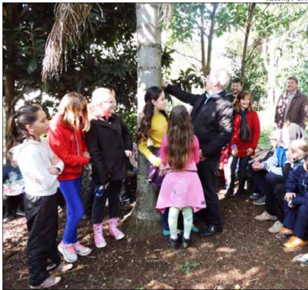
O novo espaço foi inaugurado na Escola Municipal Waldemar Antonio Von Dentz