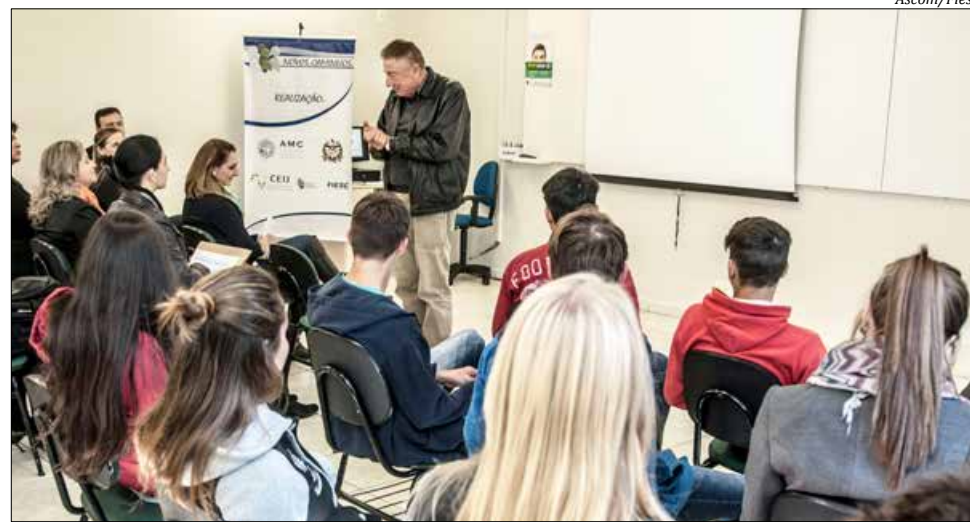
Em São Miguel do Oeste é a terceira turma do projeto que prevê cursos de preparação para o mundo do trabalho

Em São Miguel do Oeste é a terceira turma do projeto que prevê cursos de preparação para o mundo do trabalho, de qualificação profissional e de educação de jovens de 14 a 18 anos que vivem em programas de acolhimento em instituições ou com outras famílias. São 15 alunos que participa-