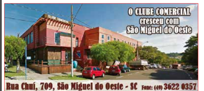
Rua Chuí, 709, São Miguel do Oeste - SC Fone: (49) 3622 0357

A Abasmo/Fumdesmo/La Salle começou com vitória no Campeonato Estadual de Basquete 2016 em Porto União. O time de São Miguel do Oeste venceu a equipe local por 52 X 39. Ainda na tarde de sábado, 28, a Abasmo venceu a equipe de Concórdia por 74 a 17. Nas últimas semanas a Abasmo vem se destacando em várias competições. O time masculino sub-12 e sub-13 venceram invictas a primeira fase do Campeonato Estadual 2016 na cidade de Chapecó. Na categoria feminina sub-12 e sub-13 também tiveram sucesso na estreia do estadual na cidade de Xaxim.