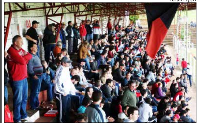
Torcedor compareceu ao estádio para apoiar a equipe

Com a vitória, o Guarani vai a 11 pontos e está na vice-liderança do Grupo-D. O Harmonia permanece com 15 pontos na liderança e está garantido nas quartas de final por ser campeão da chave. Na última rodada o Harmonia recebe o Grêmio Guarujá, que venceu o Ypiranga por 1 X 0 domingo. A equipe de Guarujá do Sul está em terceiro, com 10 pontos. Já o Ypiranga permanece com oito e recebe o Cometa, com sete pontos, na última rodada.