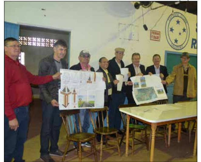
Ato de entrega oficial do projeto foi realizado sexta-feira

Segundo o Prefeito, o recurso já está empenhado e o projeto está na Caixa Econômica Federal, sendo agora aguardado a assinatura do convênio para posteriormente realizar a licitação. Já foi feito levantamento topográfico do local e conversado com a família Hirsch, proprietária do terreno onde será instalado o pórtico de entrada. O prefeito ressalta que o objetivo é agilizar