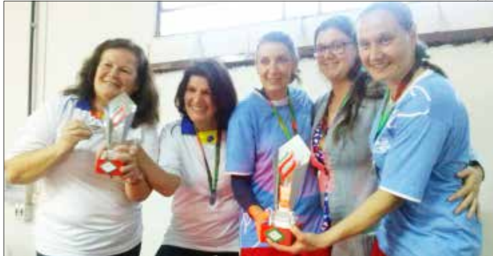
Equipe feminina de bocha da Apas conquistou a medalha de ouro

As competições dos Parajasc começaram dia 25 e, desde então, 1.650 atletas de 46 municípios com deficiência auditiva (DA), física (DF), visual (DV) e intelectual (DI) disputam 14 modalidades: atletismo, tênis de mesa, futsal, ciclismo, goalball, handebol em cadeira de rodas, natação, xadrez, basquete para cadeirantes e para deficientes intelectuais, bocha paraolímpica e bo-