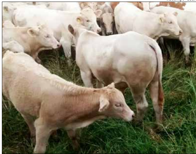
Da propriedade em São José do Cedro foram enviados 106 bezerros para o exterior

O pecuarista destaca que os bezerros são muito bem cuidados em sua