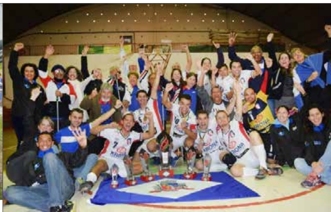
Atletas de Joinville comemoraram o título geral pela quarta vez