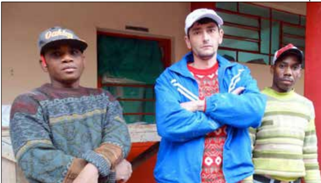
Mesmo sem receber, funcionários prosseguem com as obras