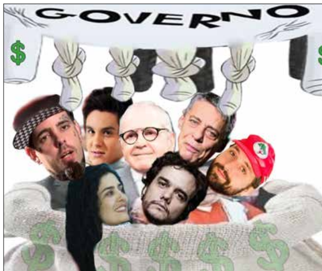
Os intelectuais sonhando com as generosas tetas governamentais

A lavagem cerebral esquerdopata fez estragos irreversíveis na cabeça dos brasileiros. Convenceram o povo ignorante e o não tão ignorante que um zé roela que cantava uma música para irritar o governo, fizesse uma palhaçada no palco, idolatrasse uma ideologia antagônica, liderasse uma baderna, invadisse terras alheias, prédios públicos ou mobilizasse uma greve era intelectual. Até mesmo o apedeuta do Lula é intelectual.