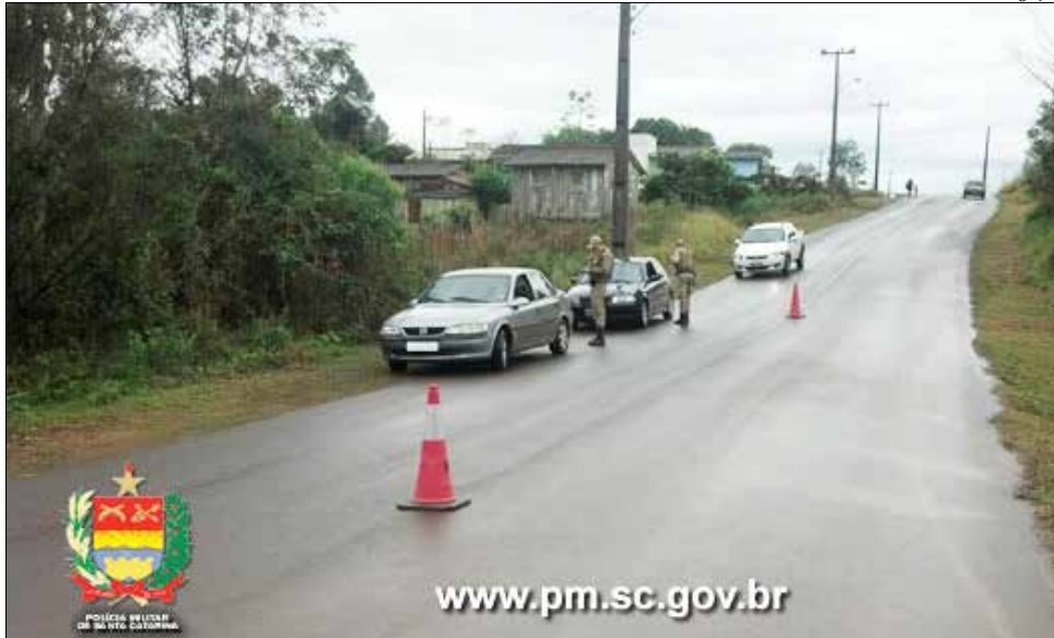
Participaram da Operação 76 policiais militares divididos nos cinco dias de operação

Dentre as ações de participação na campanha "Maio Amarelo", movimento que visa chamar a atenção da sociedade para o alto índice de mortes e feridos no trânsito, a 9ª Região de Polícia Militar realizou entre os dias 25 e 30 de maio mais uma etapa da Operação Lei Seca. A embriaguez ao volante é um dos principais causadores de acidentes de trânsito. A ação teve por objetivo a fiscalização de infrações e crimes de trânsito com foco principal na condução de veículos sob influência de álcool. A operação foi realizada em várias cidades da área de fronteira e foi executada pelo 11º Batalhão de Polícia Militar de Fronteira.