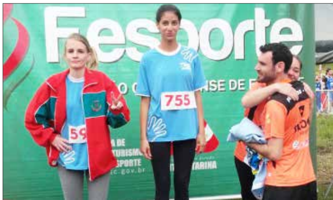
Atletismo de São Miguel do Oeste foi destaque e ganhou o título geral na modalidade feminina com deficiência auditiva