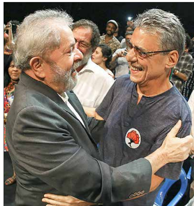
Chico Buarque de Holanda, aqui com Lula, cujo marido da sua ex-mulher ganha R$ 68 mil na TV Brasil

Eu não acho que a TV Brasil deva deixar de ser a emissora do PT para ser a emissora do PMDB. Tem de ser a emissora que respeite os valores da Constituição. E o bom mesmo é não haver uma TV Brasil. Se ninguém vê, pra quê?