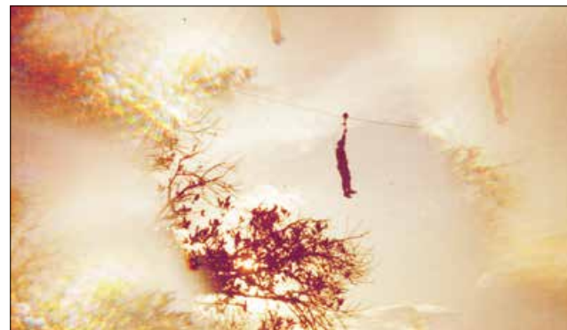
Driblando os Direitos Humanos

A política econômica do PT, aquela que alardeiam que tirou milhões da pobreza, eu comparo a do general Cotreras, figura fictícia que se apresentou no pico do Gavião nas Minas Gerais em meados de 1984, no término da Instrução Básica de Combate (IBC). O encerramento da IBC consistia em um penoso teste de sobrevivência. Quando os 600 alunos da Escola de Sargentos das Armas estavam roxos de fome, sede e frio, apareceu o tal de general Cotreras com um saco de pães. Cotreras jogou dois pães para os 600 alunos e o restante foram comer com os instrutores. Tal qual o PT fez com os brasileiros esfomeados. E o lamentável: todos esperavam a volta do Cotreras.