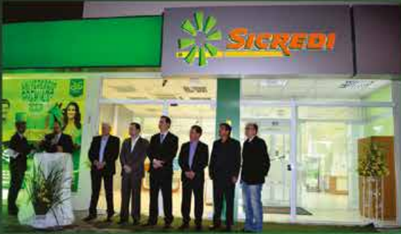
Área externa da Unidade de Atendimento