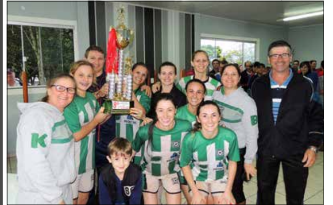
A equipe Kings Ball foi a campeã no Livre Feminino