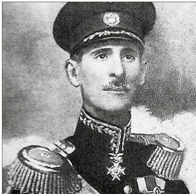
General Cotreras: Dois pães para 600 homens

Certamente alguns idiotas interesseiros e mal informados irão comemorar. Não deveriam, pois, certamente, sem medo de errar, será o dia mais triste da história republicana. Informações dão conta de que, além de um déficit monumental, quem acompanha o funcionamento da máquina pública sabe que há diversos "esqueletos" que podem ser herdados da gestão de Dilma Rousseff.