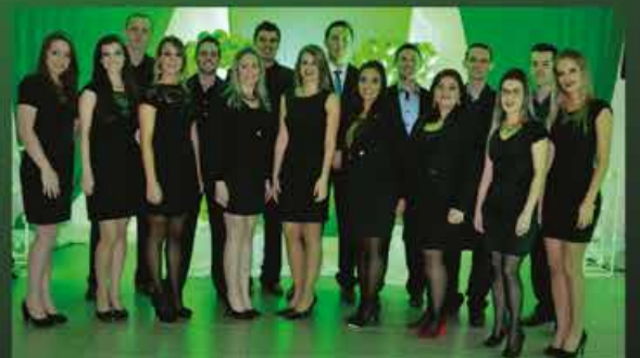
Equipe de Colaboradores da Unidade de Atendimento