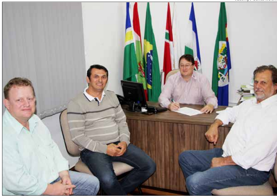
Convênio foi assinado segunda-feira na Agência de Desenvolvimento Regional de Itapiranga