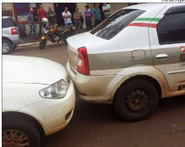
O acidente resultou apenas em danos materiais

Conforme populares, o motorista do Corsa, um homem de 72 anos, acabou colidindo na traseira do Pálio, que por sua vez, bateu atrás da viatura, que já estava entrando na rotatória. A guarnição da PM de São José do Cedro esteve no local e fez o levantamento do acidente. Não houve feridos e os danos materiais foram de pequena monta.