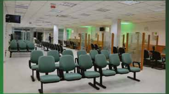
Área interna da Unidade de Atendimento