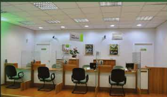
Caixas Pessoa Física

A Sicredi Celeiro RS/SC inaugurou no dia 06 de maio as novas instalações da Unidade de Atendimento do Sicredi de São Miguel do Oeste. Com um espaço amplo e moderno, de cerca de 600m 2 , oferece maior conforto aos associados. A unidade passou a funcionar na Rua Quinze de Novembro, nº 224, Salas 07 e 08, Edifício Plaza Viena, no centro da cidade. A equipe permanece com dezesseis colaboradores capacitados para atender as necessidades dos cooperados.