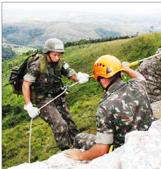
Instrução Básica de Combate na ESA: Teste penoso de sobrevivência, como o trabalhador hoje

Como se tratam de gastos desconhecidos até que sejam devidamente contabilizados, vivem no terreno das estimativas. Numa projeção conservadora feita por especialistas de diferentes áreas, a conta pode passar de 250 bilhões de reais. Mas há quem diga que pode ser ainda maior. Em relatório, a agência de classificação de risco Moody's estimou que, no pior cenário, a conta vai a 600 bilhões de reais.