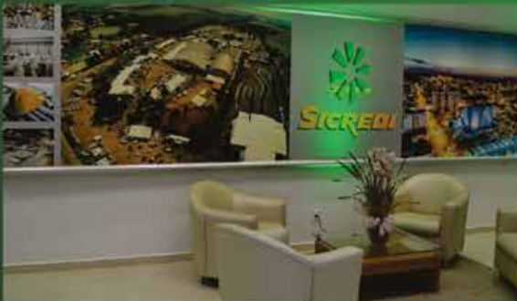
Sala de espera