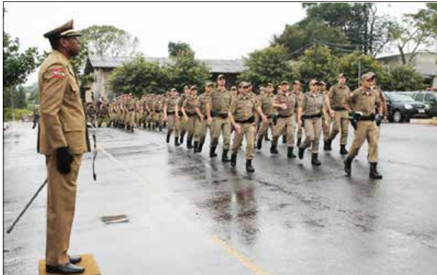
Autoridades civis e militares prestigiaram a solenidade

O novo comandante é natural de Canoas (RS) e também já assumiu postos como chefe da secretaria administrativa e chefe do estado maior da 9ª Região de Polícia Militar de São Miguel do Oeste.