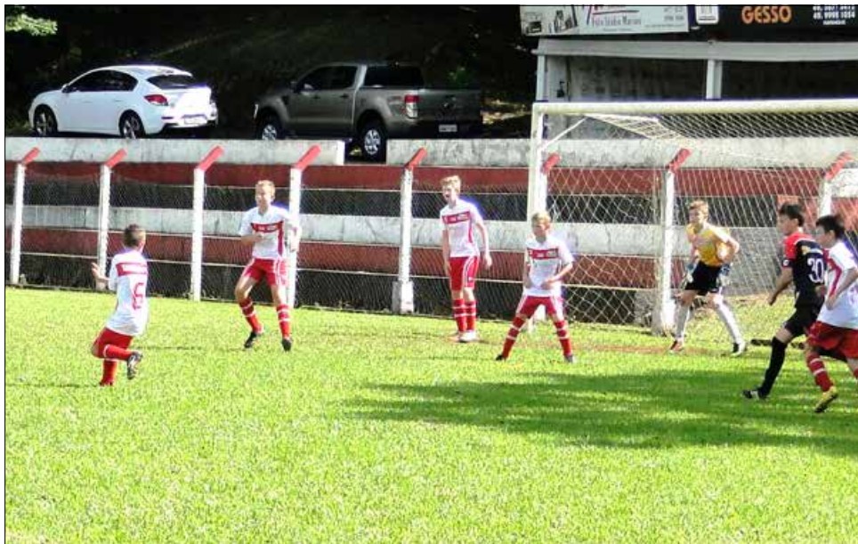
O Bugre do Oeste estreou no Campeonato Estadual Sub-13 de Futebol - Fase Oeste 2016