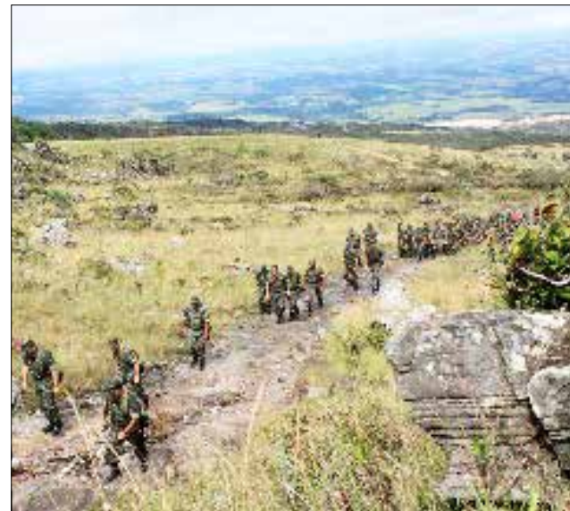
Subindo o Pico do Gavião, enquanto Dilma desce a rampa do Planalto

O que popularmente se chama de esqueleto, na literatura econômica é chamado de gasto contingente: despesa excepcional gerada por derrapadas na gestão da política econômica que fica escondida até que exploda ou que alguém jogue luz sobre ela. Para os especialistas em contas públicas, essa despesa tende a proliferar.