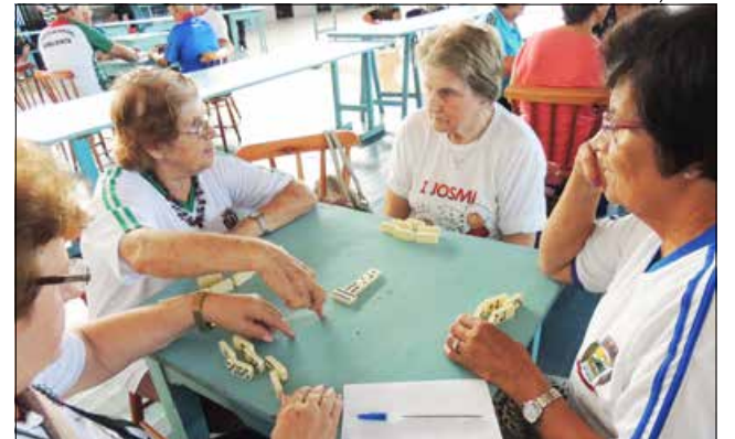
Equipe de São Miguel do Oeste ficou campeão no dominó feminino

A delegação de São Miguel do Oeste representou muito bem o município. Os atletas trouxeram nove títulos, de 1º, 2º e 3º lugares. A equipe da Fundação Municipal de Desporto (Fumdes-