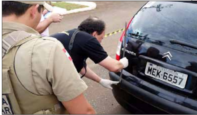
Polícia efetuou perícias nos carros atingidos pelos disparos

O autor seria um empresário de Barracão, que