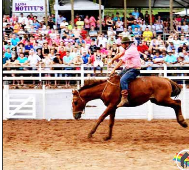
Público acompanhou as provas campeiras durante os cinco dias