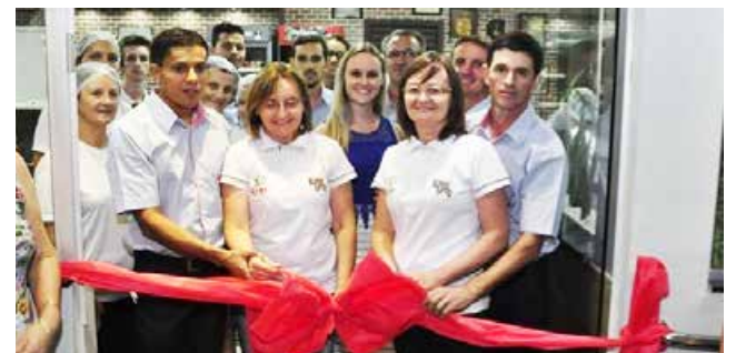
Sócios proprietários e funcionários

Hilario Pizzas esta em novo endereço, na Rua Marcilio Dias, 900, em frente ao estádio do Clube Esportivo Guarani. Há mais de 30 anos no mercado, a marca vem cada vez mais satisfazendo o fino paladar de quem frequenta, agora em novo e moderno ambiente, deixando mais à vontade a seleta clientela. Sucesso sempre.