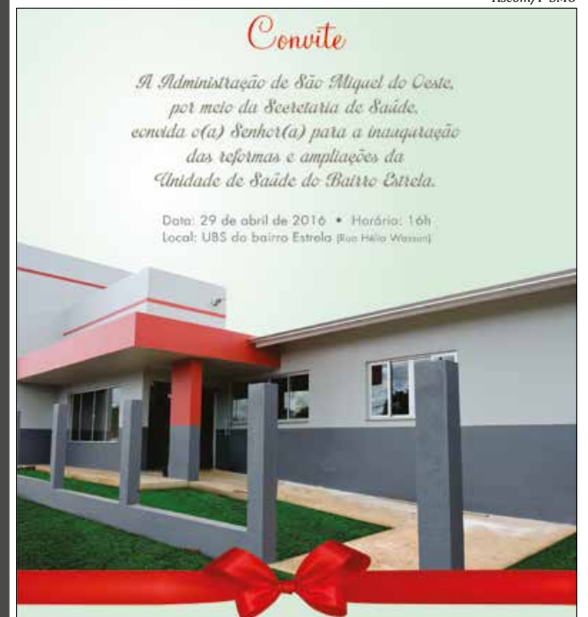
Unidade recebeu investimentos de R$ 289 mil