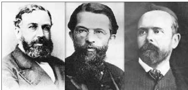
Stanley Jevons, na Inglaterra, Leon Walras, na França, e Carl Menger, na Áustria

Porém, Marx estava errado em vários pontos, desde o diagnóstico do problema até a sua solução. A Teoria do Valor Trabalho foi refutada pela Teoria da Utilidade, desenvolvida simultaneamente por três economistas: Stanley Jevons, na Inglaterra, Leon Walras, na França, e Carl Menger, na Áustria. Os três, ao mesmo tempo, em países diferentes e praticamente sem entrar em contato um com o outro, perceberam que o que confere valor a uma mercadoria não é o trabalho, mas a sua utilidade.