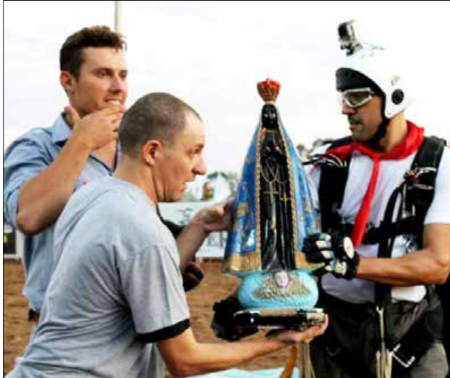
Paraquedistas trouxeram a imagem de Nossa Senhora para o momento de oração