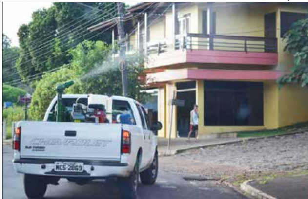
Fumacê foi aplicado em diversas ruas da cidade onde há focos do mosquito

A Secretaria informou que as agentes de Saúde