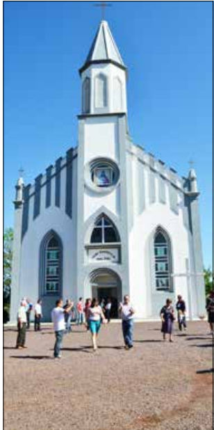
Igreja de Cristo Rei foi o ponto de partida para a festa