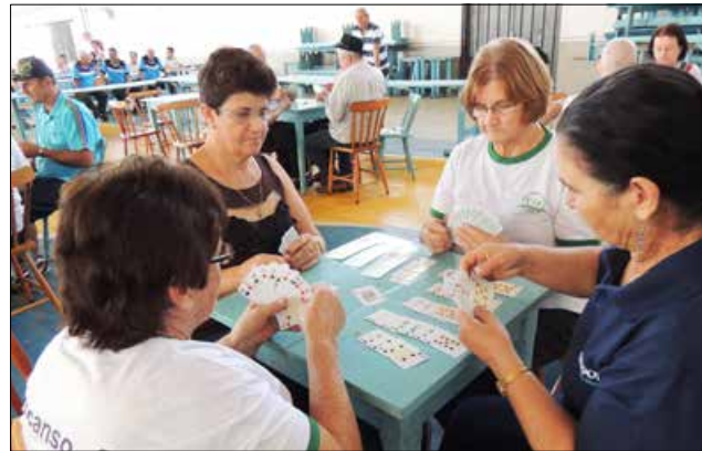
Belmonte ficou em primeiro lugar na canastra feminina, seguido de São Miguel do Oeste e Descanso

Dança de Salão até 69 anos: São Miguel do Oeste; Dança de Salão acima de 70 anos: Descanso; Dança Coreográfica: São Miguel do Oeste.