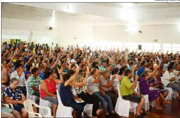
Assembleias contaram com a participação maciça dos associados

Os associados participaram do resultado com a destinação, dos juros ao capital, de R$ 4,1 milhões e de R$ 5,6 milhões, cerca de 30% das sobras, aprovados na AGO para depósito no capital social, realizado no final de março. Assim, a Cooperativa distribuiu aos