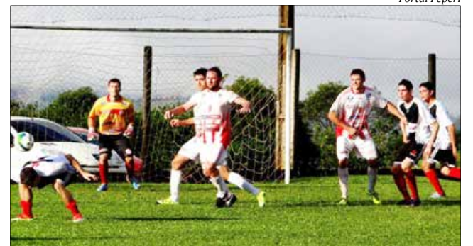
Apesar de amistoso, jogo foi bem disputado e acabou no empate