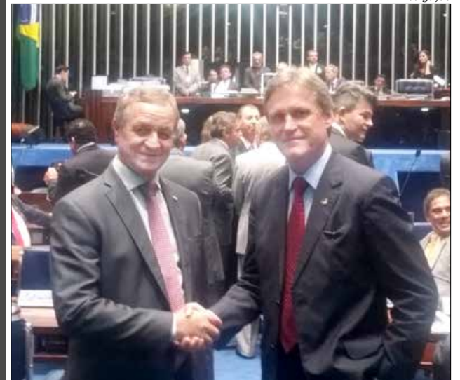
Deputado federal Valdir Colatto e senador Dario Berger, ambos PMDB/SC, no Senado