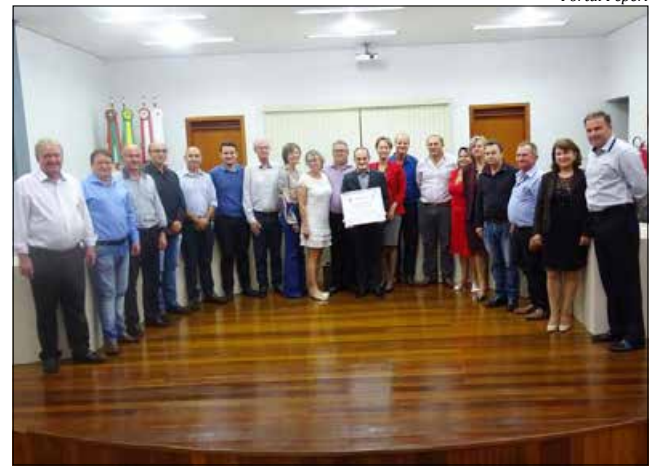
Vereadores, direção e funcionários da emissora

que a homenagem mostra a importância da Rádio Itapiranga.