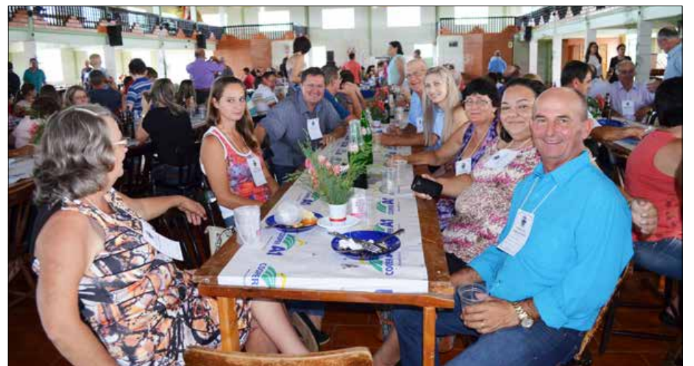
Várias gerações da Família Bohnen confraternizaram pelo sexto ano seguido