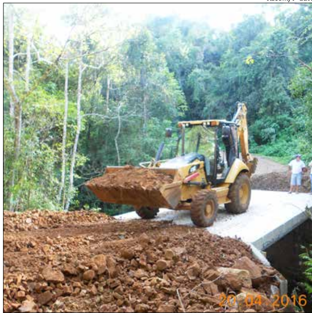
Nova ponte tem 36 metros e custou R$ 42 mil