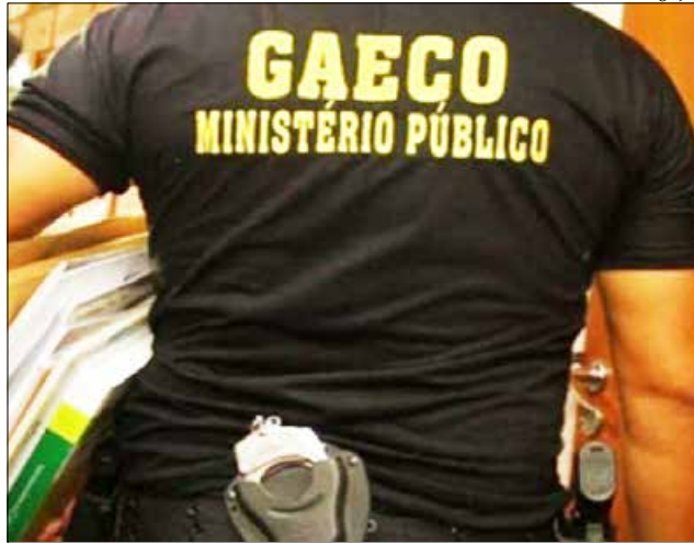
Agentes do Gaeco recolheram documentos em prefeituras e empresas do Oeste