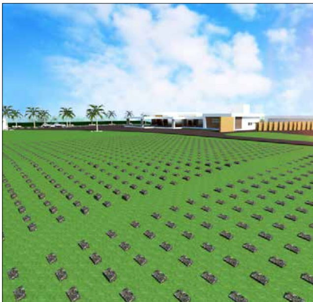
O projeto foi pensado em detalhes para trazer longevidade à obra, que poderá atender a demanda de até 100 anos na região