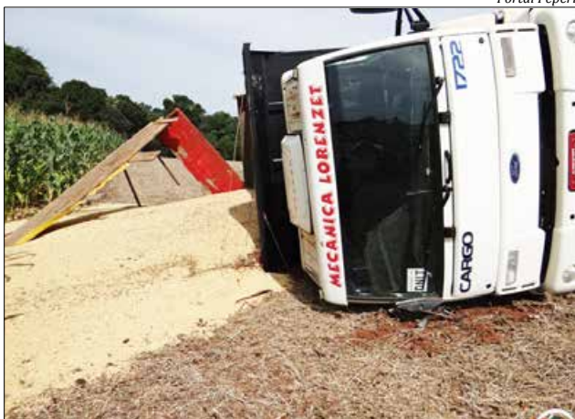
Caminhão acabou esparramando a carga na lavoura

Um caminhão capotou no início da tarde de segunda-feira, 04, na propriedade de Arnaldo Butzke, na Linha Jundiá, interior do município de Iporã do Oeste. O caminhão carregado de soja estava se retirando da lavoura, quando um dos rodados afundou e acabou tombando e derramando a carga. O motorista saiu ileso do acidente.