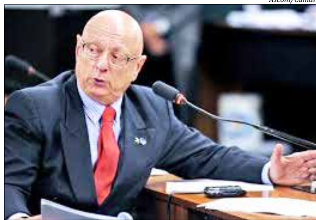
Deputado federal Esperidião Amin

O PP, que possui a terceira maior bancada na Câmara, realizou uma reunião informal quarta-feira, 30, para estabelecer a data da convenção nacional, que terá como principal pauta o desembarque ou não do governo. "Eu acho que a maioria do partido, se não a unanimidade, vai decidir por não ter relações com o atual governo", afirmou Amin. Em relação ao impeachment, o parlamentar de-