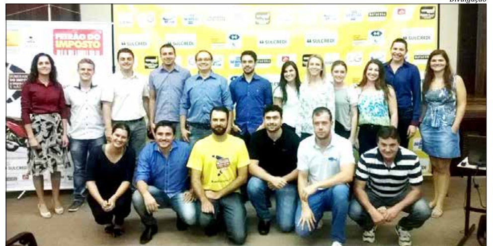
Integrantes do Jesmo vão desenvolver o Feirão do Imposto, em maio

O Núcleo Jovem Empreendedor (Jesmo) da Associação Empresarial de São Miguel do Oeste (Acismo) realizou, na noite de sexta-feira 1º, um café com a imprensa para a apresentação das ações do núcleo para 2016, com destaque para o Feirão do Imposto, que ocorre no dia 31 de maio. O Feirão, organizado pelo Jesmo, Confederação Nacional dos Jovens Empresários (Conaje) e Conselho Estadual de Jovens Empreendedores de Santa Catarina (Cejesc), tem o apoio da Gabatto Motos, Sulcredi, Matacura, Habito, Ludwig Contabilidade e Assessoria, Sebrae,