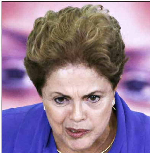
Para se manter no poder, Dilma Rousseff insufla a guerra

Perguntas que não querem calar: até quando as instituições permitirão que Dilma cometa novos crimes para se livrar de um crime? Até quando as instituições permitirão que ela use o cargo de presidente da República para insuflar a guerra de todos contra todos? Até quando as instituições assistirão à chefe máxima da nação a denunciar crimes que não existem apenas para se segurar no poder?