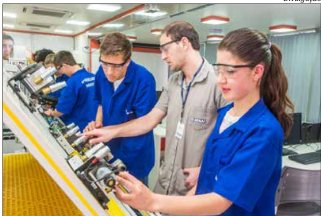
Curso de Torneiro Mecânico chegou à unidade local do Senai