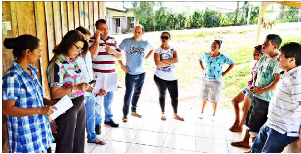
Moradores relataram situação envolvendo suas moradias e seu desejo de permanecer no local

O terreno em que as famílias residem está lo-