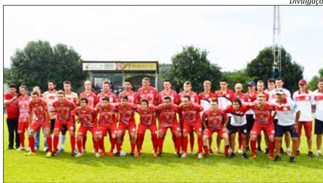
A equipe vinha treinando duas vezes por semana e apresentou um bom entrosamento na partida

chave D, com as equipes do Guarani, Grêmio Guarujá, Cometa e Ypiranga. Na se-