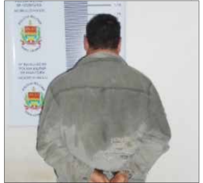
Suspeito de ter estuprado a vítima foi preso e levado para a delegacia

A mulher informou que o suspeito, usando a chave de outra moradora da casa, entrou no local e passou a se insinuar para ela, que fugiu e trancou-se em um quarto. O homem arrombou a porta e, armado com uma faca, ameaçou a vítima. Enquanto ele cometia a violência, outro homem entrou na casa e foi para outro cômodo. Os dois suspeitos foram detidos e levados para a delegacia de polícia.