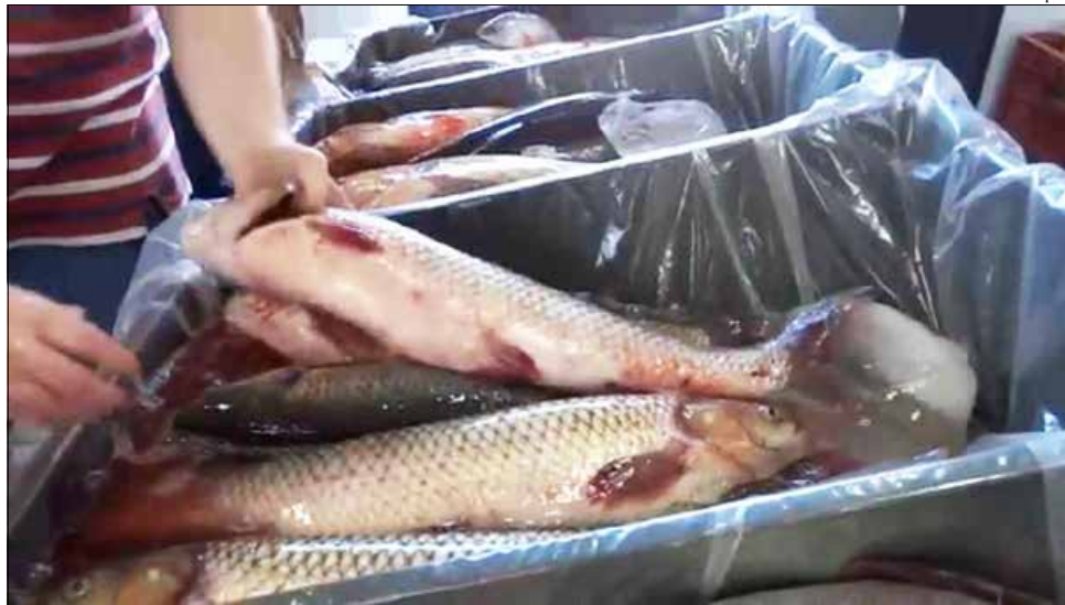
Vendas na feira livre municipal ficaram aquém do esperado

Um dos produtos mais vendidos foi o filé de tilápia, comercializado por cerca de R$ 22,00 o quilo.