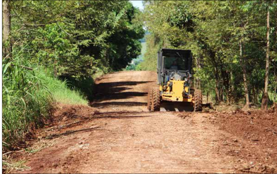
Serviços na estrada Beira Rio iniciaram já na semana passada