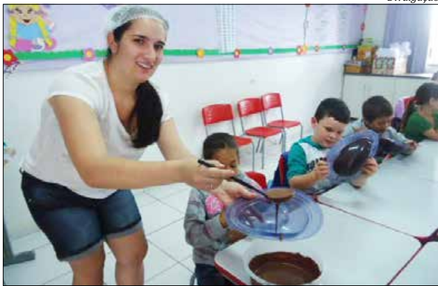
Confecção de ovos de Páscoa fez parte do projeto para marcar a Páscoa

ESTADO DE SANTA CATARINA / PODER JUDICIÁRIO Comarca - São Miguel do Oeste / 1ª Vara Cível Rua Marcellino Dias, 2070, Centro - CEP 89900-000, Fone: (49) 3631-1533, São Miguel do Oeste-SC - E-mail: saomiguelcivel1@tjsc.jus.br Juiz de Direito: Crystian Krautzychyn Chefe de Cartório: Deisi Cristina Galeazzi