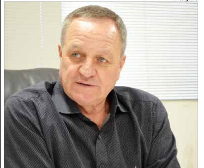
Valdir Colatto, deputado federal