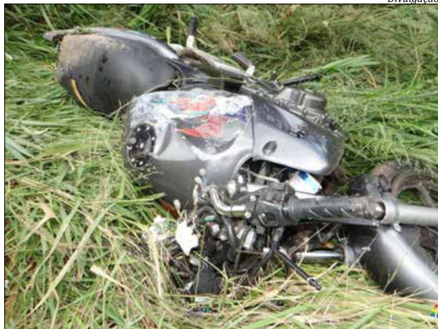
Motocicleta ficou cerca de 30 metros da margem da rodovia