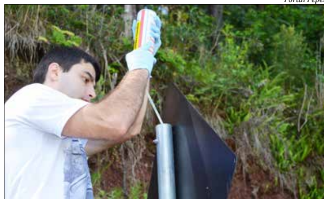
Além das placas, os agentes da Dengue deverão realizar visitas domiciliares

Nesta ação está sendo usada uma espuma expansiva que veda a passagem de água que fica parada dentro do cano e, conforme a equipe da Dengue, serão cerca de 250 placas vedadas. Além das placas, os agentes da Dengue deverão realizar nas visitas domiciliares a vedação dos canos das parabólicas, quando acharem necessário.