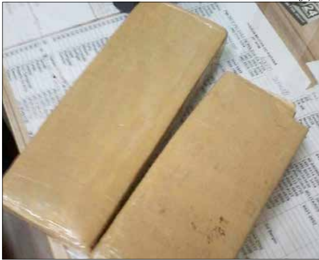
Os dois tabletes de maconha totalizaram cerca de um quilo