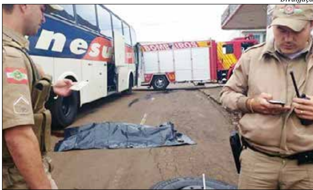
Corpo do mecânico foi retirado e ficou na calçada à espera da remoção

Ele não resistiu aos ferimentos provocados pelo peso do ônibus sobre o seu corpo. Os socorristas fizeram a remoção do corpo, que ficou preso no rodado do coletivo. Conforme populares, ele morava no bairro Pinheirinho, em Barracão (PR) e era funcionário da empresa há vários anos.