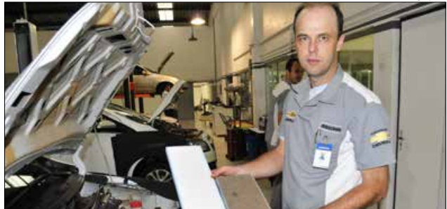
Mecânico da Bregomar mostra a diferença de limpeza na troca de filtro do ar condicionado durante a revisão