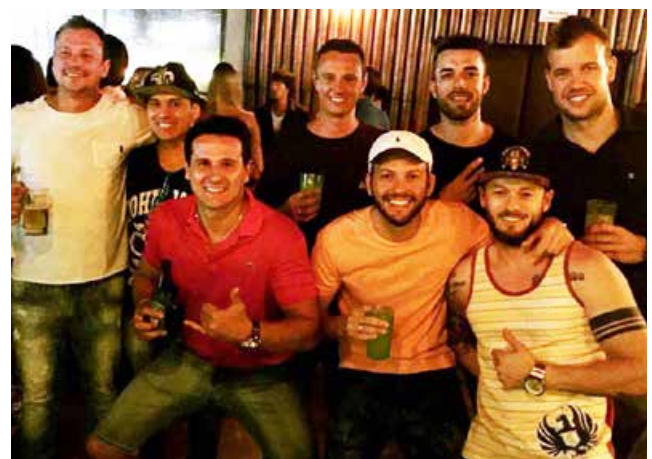
Moçada bacana que apareceu sábado no Joy Lounge bar

No Brasil foram 139. Em Santa Catarina, apenas sete receberam tão importante destaque.