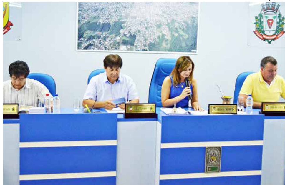
Vereadores apreciaram projeto que renegocia dívida e reduz saldo devedor