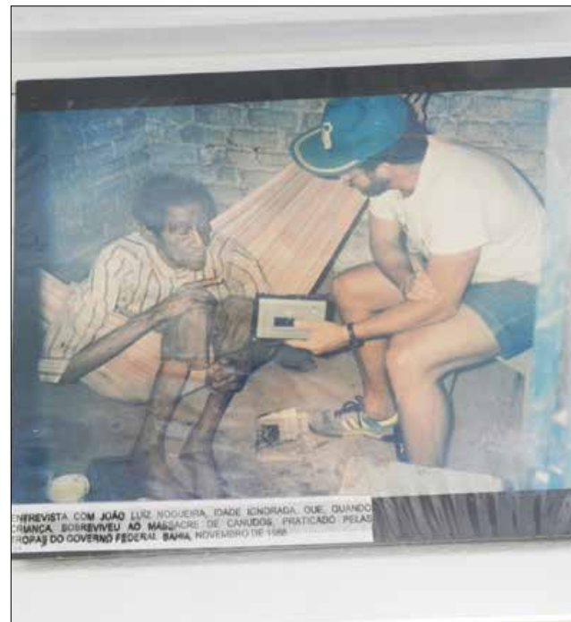
Otário é este! Ele lutou para os reacionários, sobreviveu em Canudos e na Coluna Prestes

se Livre, que nem sequer é citado; o caráter político dos atos; o absurdo da reivindicação. Mas é ainda mais lamentável por aquilo que afirma.