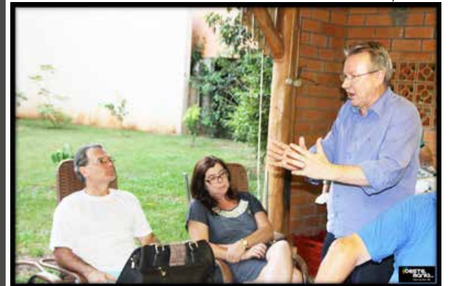
Nos encontros e reuniões com as lideranças peemedebistas o tema foi sobre as eleições municipais