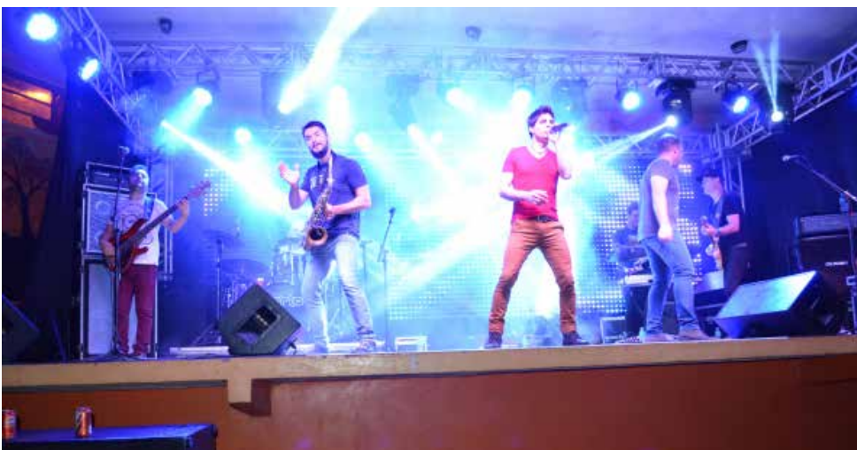
Banda Porto do Som animou o público durante o baile