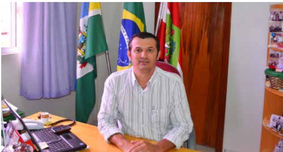
Prefeito Gilberto Giordano destaca o bom momento vivido pelo município