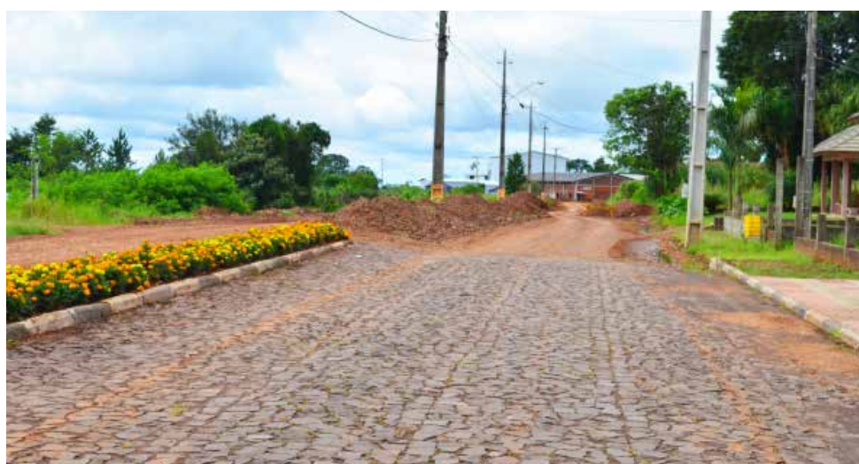
Conclusão da pavimentação da Avenida Brasília