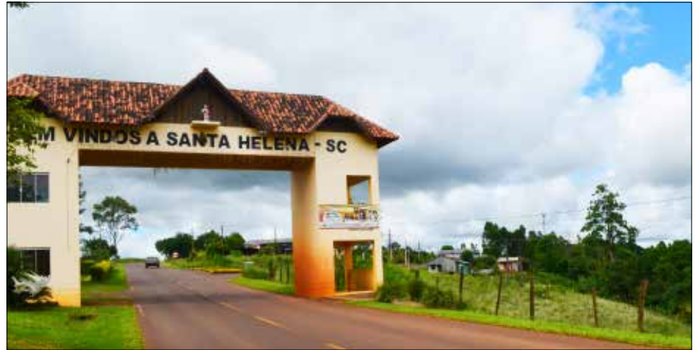
Município foi colonizado por italianos e alemães em busca de riquezas na extração de madeira