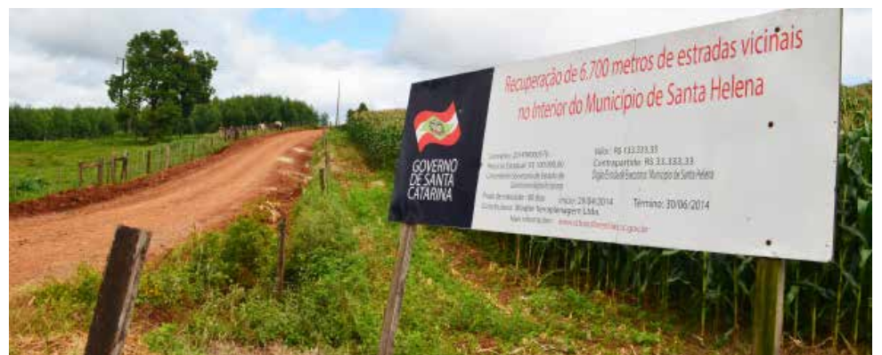
Recuperação das estradas do interior é trabalho constante do Setor de Obras