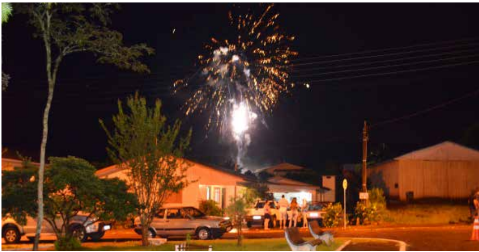
Show pirotécnico marcou o aniversário do município na noite de sábado