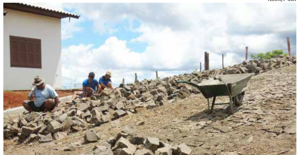
Serviços começaram a ser executados segunda-feira

A prefeitura de Guaraciaba iniciou segunda-feira, 11, as obras de pavimentação com pedras irregulares de quatro novos trechos de ruas na cidade. Serão beneficiadas as ruas Carlos Fernando Ludwig, Encantado, Olavo Bilac e Tiradentes. Ao todo, as obras que somam quase sete mil metros quadrados de área e mais de dois mil metros quadrados de calçadas terão um investimento acima dos R$ 347 mil. Até agora foram mais de 10 ruas contempladas com calçamento.