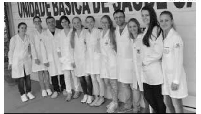
Acadêmicos puderam colocar em prática os conhecimentos aprendidos em sala de aula