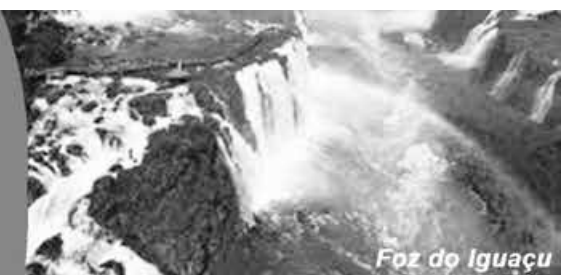
Foz do Iguaçu