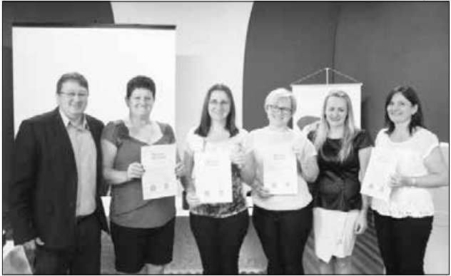
Servidoras completaram 30 anos de serviço público estadual