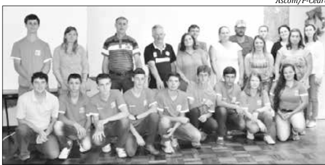
Pais prestigiaram a apresentação dos alunos