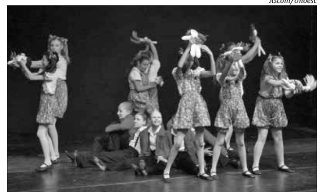
Alunos da Escola Juscelino Kubitschek durante a apresentação "O Casaco"

Outra apresentação premiada foi o "O Sapo da Sorte". O grupo conquistou o 2º lugar com a dança, na categoria infantil livre, da etapa microrregional do Festival Dança Catarina e o 3º lugar, na categoria séries finais, do Festival Regional de Dança de Campo Erê. A apresentação conta a história de um trabalhador que encontra,