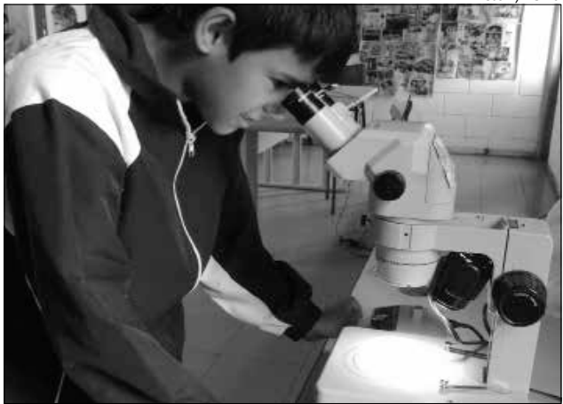
Crianças puderam conhecer como é a larva do mosquito