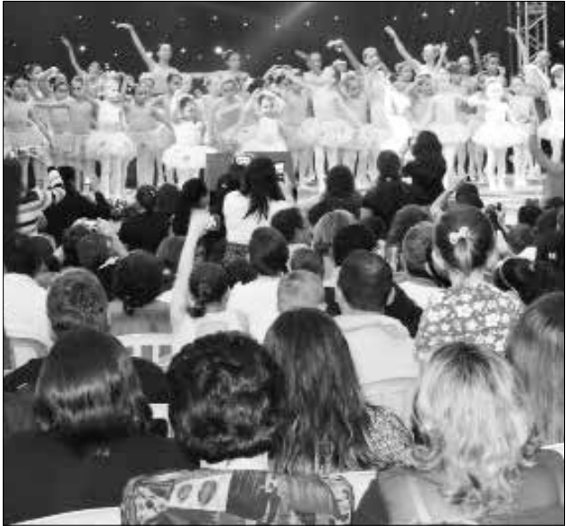
Público pôde apreciar as apresentações artísticas produzidas pelos alunos das oficinas

Vende-se Lote rural na Linha Canela Gaúcha, em São Miguel do Oeste, a 200 metros do campo de futebol. Com 6.500 metros quadrados, com água, luz e com escritura. Valor a combinar. Contato: (49) 91552775