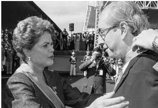
Dilma Rousseff e Eduardo Cunha

O pedido de impeachment formulado por Hélio Bicudo, Miguel Reale Jr. e Janaina Paschoal foi entregue em 21 de outubro ao presidente da Câmara dos Deputados, Eduardo Cunha, que certamente leu o documento antes de dormir. Por que demorou tanto para descobrir que os argumentos arrolados pelos dois juristas tinham solidez suficiente para justificar a abertura do processo? Por que deixou para fazer neste 2 de dezembro o que poderia ter feito há 40 dias? Porque o terceiro homem na linha de sucessão não tem tempo para pensar no país, nos brasileiros ou em qualquer outra irrelevância semelhante? Eduardo Cunha só pensa em Eduardo Cunha.