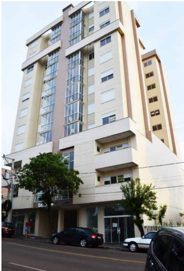
Edifício Center Tower fica na Rua Sete de Setembro, no centro de São Miguel do Oeste