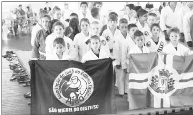
Judocas de São Miguel do Oeste representaram o município no Festival Regional em São Carlos