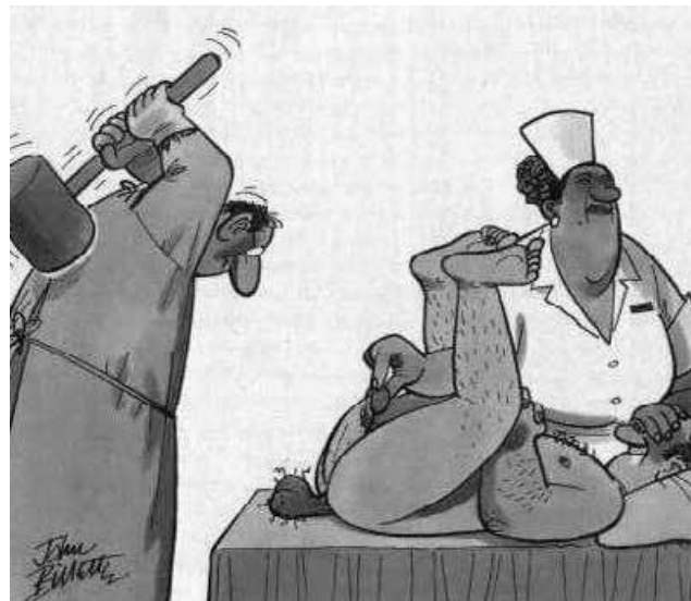
O infeliz seria a futura mulher?

Os alunos não precisavam concordar com a frase, apenas assinalar qual movimento a ideia acima inspirou nos anos 1960 (resposta certa: "igualdade de gênero". Fácil). Dando um desconto para a primeira frase (é claro que várias pessoas nascem mulheres) e a definição de mulher como um "macho castrado"?