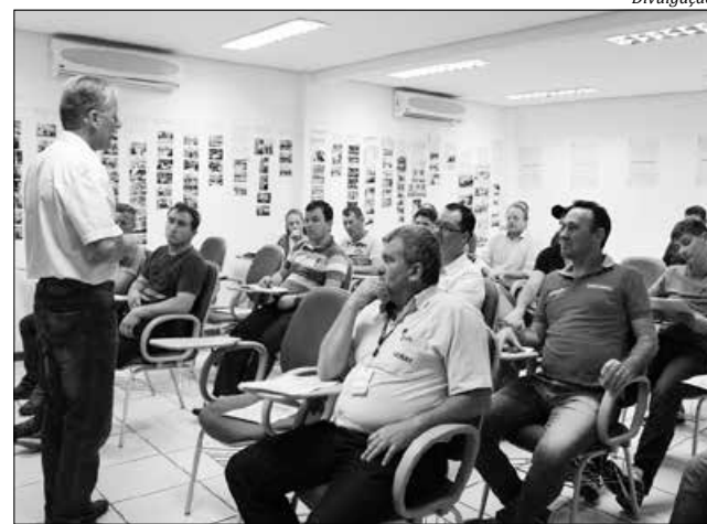
Seminários, oficinas e clínicas tecnológicas ocorreram no extremo oeste

Em todo o Estado, foram oferecidas gratuitamente 49 clínicas tecnológicas, três Mutirões Tecnológicos que atenderam 300 empresas, 66 seminários sobre diversos