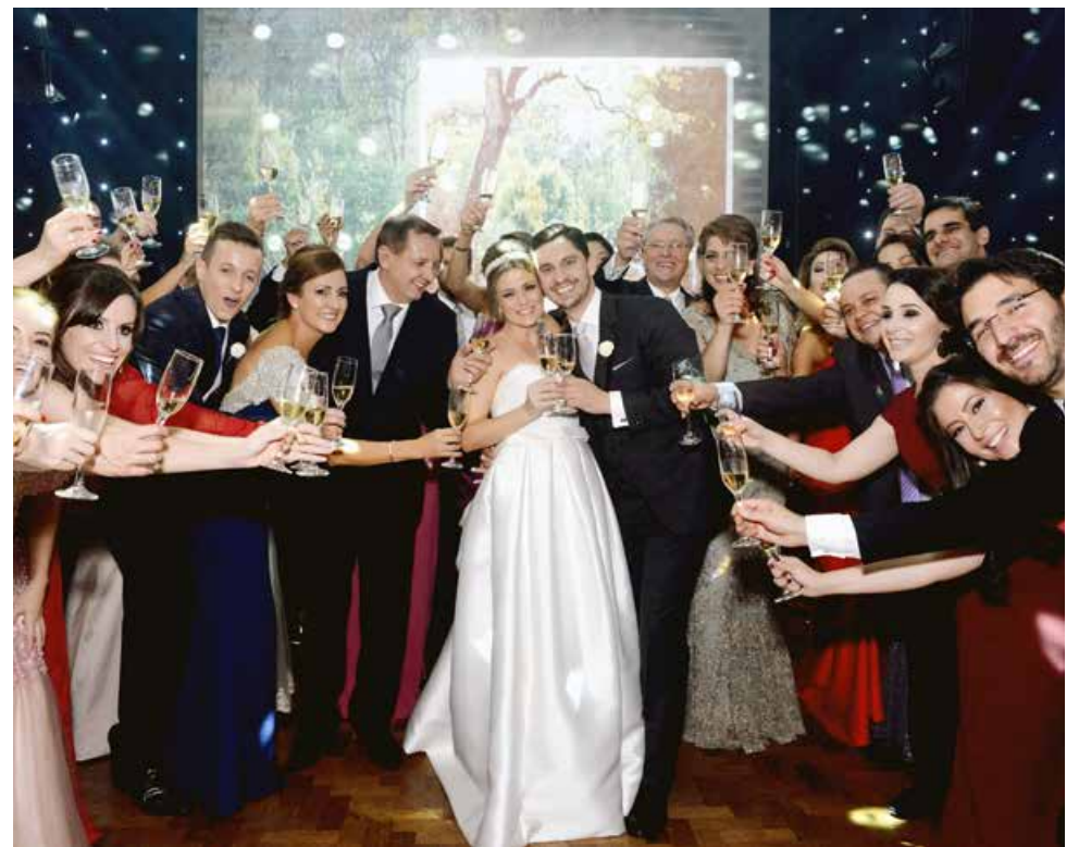
Momento do brinde aos noivos com familiares e padrinhos