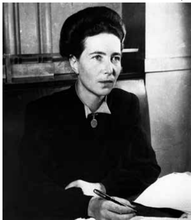
Simone de Beauvoir