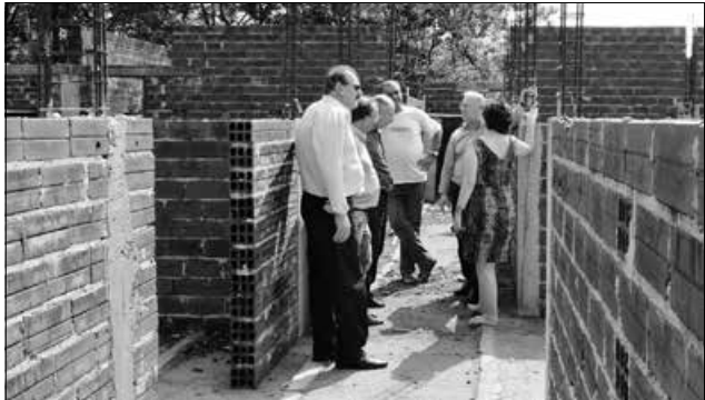
Equipe da prefeitura vistoriou as obras na última semana