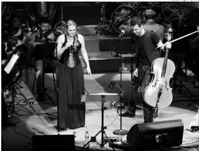
Orquestra faz sucesso interpretando clássicos do rock