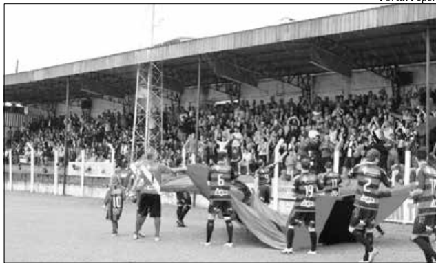
Após a vitória, a equipe iniciou a comemoração ainda em campo