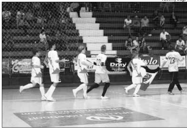
Jogo foi válido pela 3ª e última rodada do Retorno da Chave A3 do Estadual Sub-15 de Futsal

A classificação final da Chave A3 ficou com Joni Gool com 11 pontos, Bugre com 10 pontos, Recriarte com 10 pontos e Videira com 03. Durante a semana, a Federação