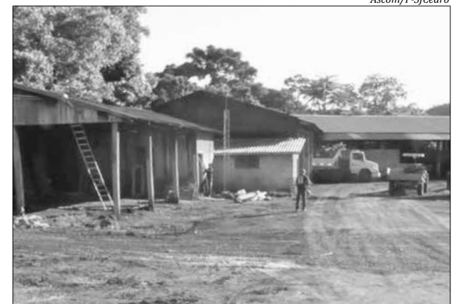
Local vai ser sede do novo Centro de Convivência dos Idosos de bocha, área destinada à academia, área para piscina coberta, vestiário, além disso, também haverá área externa, local em que será feito ajardinamento, para tornar o espaço confortável e uma área a mais de lazer para os idosos.

A construção do novo Centro incluirá área administrativa, salão multiuso, refeitório, sala de jogos, sanitários, cozinha, churrasqueiras, cancha