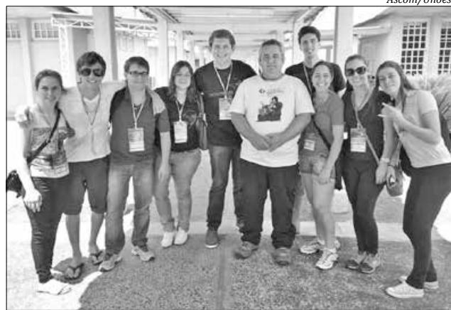
A Conferência Latinoware ocorreu no Parque Tecnológico Itaipu em Foz do Iguaçu