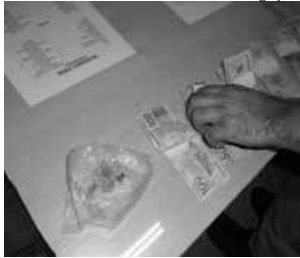
Drogas e dinheiro foram apreendidos durante a operação

Durante revista, um homem de 31 anos, natural de São Miguel do Oeste, desobedeceu às ordens de abordagem, tentou fugir, porém, foi detido e algemado. A Polícia Militar empregou na operação sete policiais.