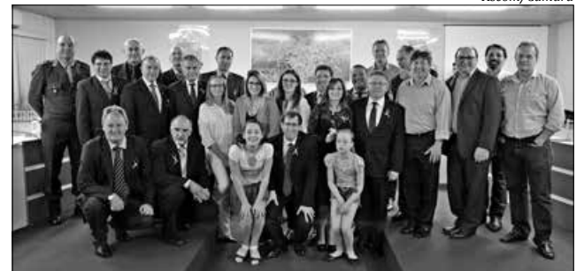
Vereadores prestaram homenagens a administradores que atuam em São Miguel do Oeste