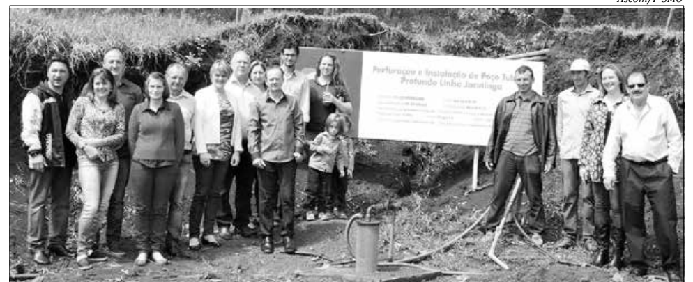
Inauguração do novo poço vai garantir água potável para 20 famílias

A Secretaria de Agricultura, Pecuária e Piscicultura, juntamente com o governo do Estado, Casan, Epagri e comunidade da Linha Jacutinga Arroio Veado, promoveu no último domingo, 04, o evento de inauguração da rede de água ampliada, com a perfuração de um novo poço artesiano. Com investimentos de R$ 25.910,00 e 28 famílias beneficiadas, a nova rede vai garantir o abastecimento de água potável para a comunidade, que em épocas de estiagem sofria muito com a falta de água. A perfuração do novo poço, com vazão de 900 litros por hora, possibilitou a ampliação da rede já existente, colocada pela Casan em parceria com a Epagri, há cerca de cinco anos.