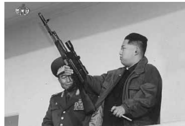
Ggeneral Kim Jong-un da Coréia do Norte

Por incrível que pareça, hoje, ainda há esquerdopatas e apedeutas endeusando o regime comunista. A meu ver, o regime comunista foi a desgraça do século passado e agora, em pleno século XXI, ainda há defensores de uma ideologia que massacrava nações inteiras.