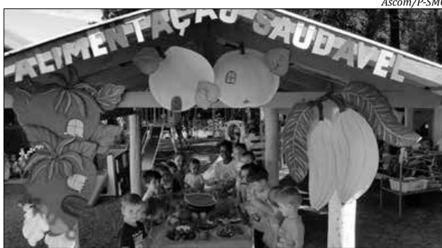
No Centro de Educação Infantil Criança Feliz, atividades lembraram o Dia da Criança

Ainda na segunda-feira a equipe da escola organizou um lanche diferenciado e saudável com diversas frutas e num ambiente descontraído. Mais atividades acontecem nesta semana envolvendo estudantes e familiares.