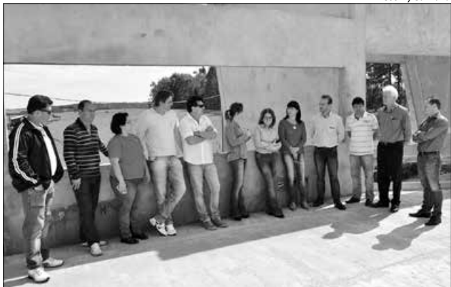
Nas futuras instalações da Madebal e Imobal, vereadores receberam reivindicação sobre mudanças no Plano Diretor