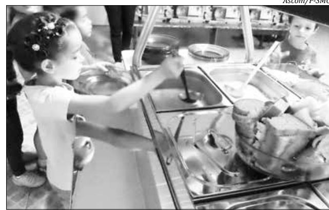
A nova forma de servir promove melhor higiene, deixa os alimentos na temperatura ideal para consumo

Outro fator, segundo ela, é que essa opção também evita o desperdício, porque os alunos vão escolher aquilo que gostam e a quantidade certa para ingerir, evitando sobras. "É um investimento necessário, viável para as unidades do ensino fundamental. Esperamos que os colabo-