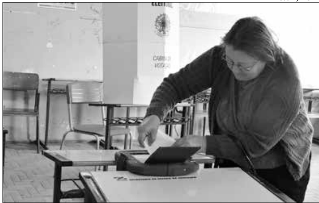
Em São Miguel do Oeste, votação aconteceu no Colégio São Miguel

Em Belmonte, mais de 1.200 pessoas foram às