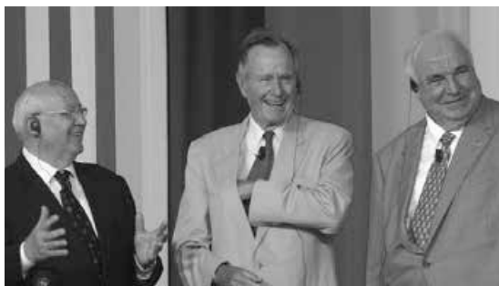
O último líder da União Soviética e pai da "perestroika", Mikhail Gorbachov - Helmut Kohl, ex-Chanceler alemão, e o ex-presidente dos EUA, George W. Bush.

Para fugir dos sanguinários comunistas do Leste, valia tudo. Uns embarcavam em balões e ultraleves, outros cavavam túneis. Vários pulavam de prédios que estavam no limite entre as duas Berlins. Carros pequenos eram usados para passar por baixo das traves de segurança, ou grandes para tentar arrebentá-las. Atravessar os rios em embarcações ou a nado era também estratégia frequente. Havia os que optavam por falsificar documentos na tentativa de enganar os soldados da fronteira.