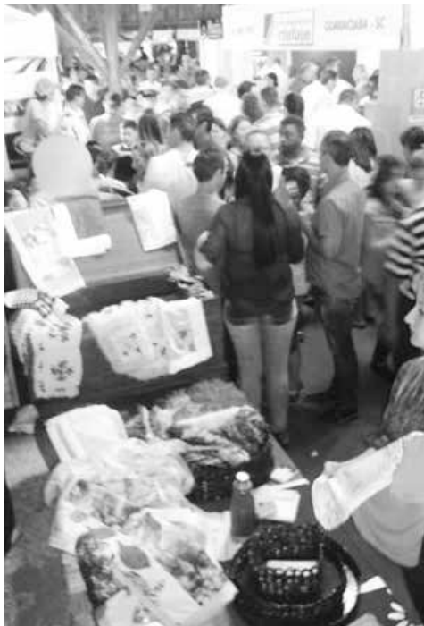
Grande público prestigiou a feira