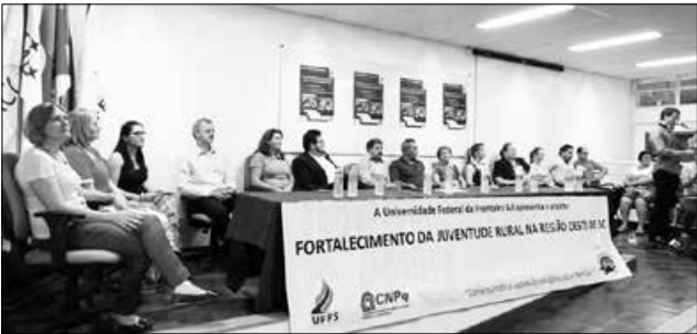
Contratos assinados vão beneficiar todas as regiões de Santa Catarina