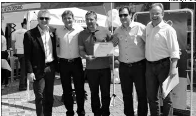
Direção do Sebrae entregou certificados aos microempreendedores que participaram de capacitação no Sebrae em São Miguel do Oeste

Atualmente, o Estado possui 400 mil pequenos negócios, entre microempreendedores individuais e micro e pequenas empresas. Juntos os pequenos