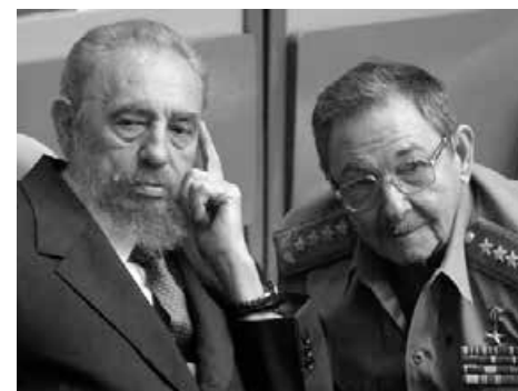
Irmãos Castro de Cuba

Grandes nações como a Rússia, China e a própria Alemanha Oriental ao experimentar o novo regime, também experimentaram a fome, a miséria e o confinamento. Hoje restam duas republiquetas comunistas: Cuba dos irmãos Castro e a Coréia do Norte do general Kim Jong-un