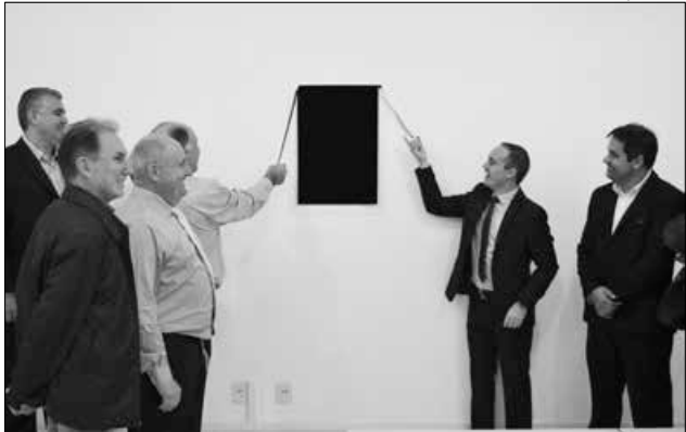
Inauguração contou a presença de autoridades, associados e empresários