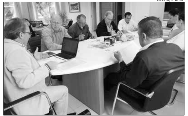
Encontro na prefeitura com representantes de diversas entidades locais e regionais tratou da preparação do evento

O Seminário inicia às 8h30, com credenciamento, e a abertura oficial está