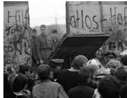
Derrubada do muro

Na madrugada do dia 13 de agosto de 1961, centenas de trabalhadores levantaram literalmente de uma hora para outra uma barreira que isolou completamente Berlim Ocidental do restante da cidade e do território da Alemanha Oriental. Ninguém da parte comunista da capital alemã podia passar para o outro lado capitalista sem autorização. E poucos tinham esse privilégio. Foram 28 longos anos assim. Até que a RDA (e o comunismo na Europa) começou a declinar e em 9 de novembro de 1989 viu um dos seus principais símbolos ruir.