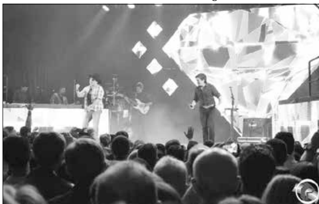
Show de Chitãozinho e Xororó foi a principal atração no sábado

pontualmente às 23h30. A dupla cantou todos os sucessos e teve uma boa interação com o público. A Facig encerrou domingo, 04, com a apresentação do Tchê Sarandeio.