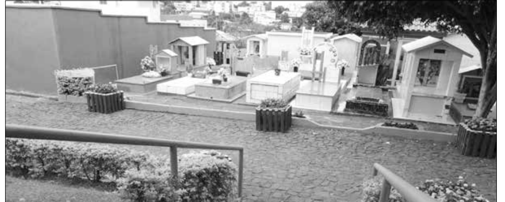
Determinação abrange todos os cemitérios públicos ou particulares do município