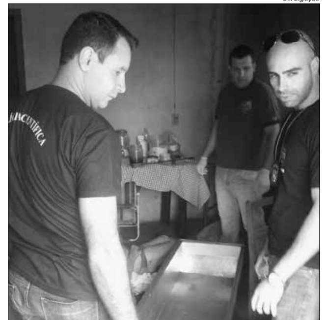
Polícia foi chamada e o IML recolheu o corpo da vítima