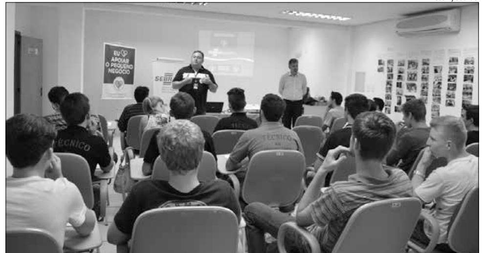
Palestra sobre Empreendedorismo foi realizada em São Miguel do Oeste

Na quinta-feira (24), as capacitações ocorreram em São Miguel do Oeste, com palestra sobre "Empreendedorismo", ministrada pelo con-