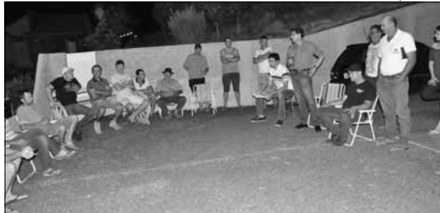
Projeto que contempla calçamento das ruas do bairro foi apresentado aos moradores