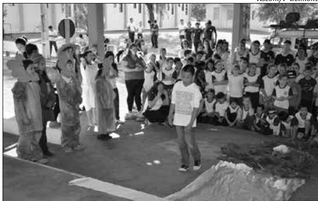
Estudantes participaram de apresentações em homenagem ao Dia da Árvore

Na oportunidade, a Escola de Educação Básica Francisco Brasinha Dias, o Centro de Ensino Fundamental Professor João Revers e o Centro de Educação Infantil Pingo de Ouro prestaram homenagens à natureza e deixaram suas mensagens. Neste ano, além do tradicional plantio de uma muda de árvore na Praça Pública Municipal, os estudantes da Rede Municipal de Ensino tiveram palestras com a Polícia Ambiental e com o coorde-