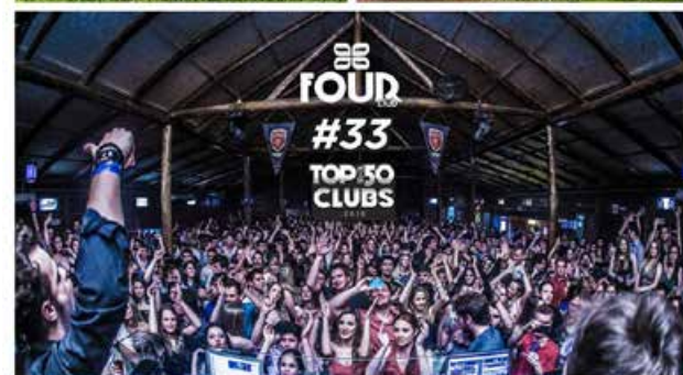
Four Club está entre as 33 melhores casas de shows do Brasil