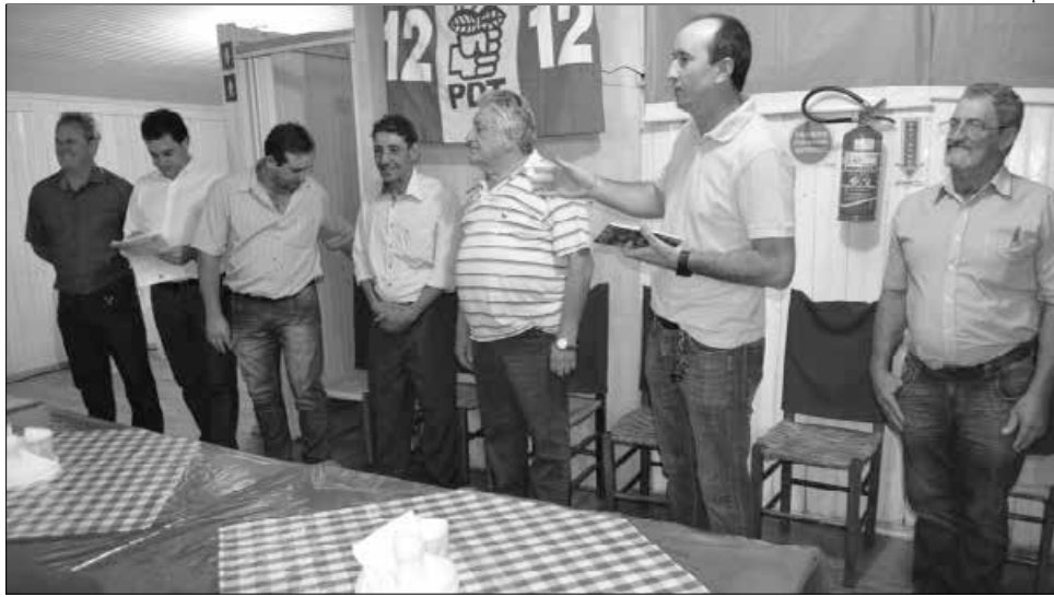
Lideranças avaliaram o momento político da região e a participação do PDT

Sobre as eleições do próximo ano, ele avalia que o PDT tem todas as condi-