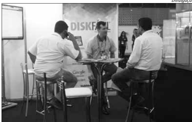
Equipe da Disk Fácil foi uma das 160 empresas presentes à feira

Com um modelo inovador, alia tecnologia e tradição para potencializar a comunicação empresarial, trabalhando com produtos que vão desde impressos, portal de buscas, marketing mobile, até agenciamento digital e soluções em fidelização e comunicação com rede de clientes. A Disk Fácil Fran-