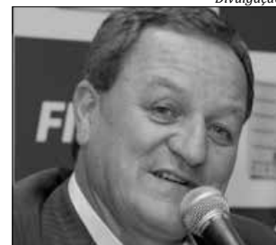
Deputado federal Valdir Colatto

fissionais de imprensa, que prestam importante trabalho de cobertura jornalística no Congresso Nacional. "A atuação parlamentar aqui (Brasília) ganha repercussão graças à imprensa que divulga em seus mais diversos meios de comunicação. É um trabalho de prestação de serviço ao povo, para o qual devemos prestar conta", destacou.