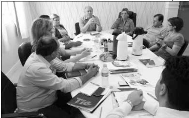
Medidas foram anunciadas em reunião do colegiado