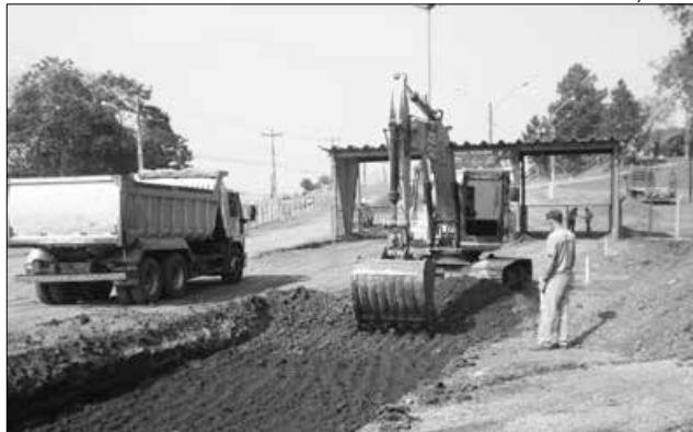
As máquinas e caminhões já trabalham no parque desde o dia 18

O trecho a ser asfaltado tem 700 metros de extensão. Inicia ainda antes do portal de acesso ao parque, segue pela via principal e desce em direção à rodovia Leolino Baldisse-