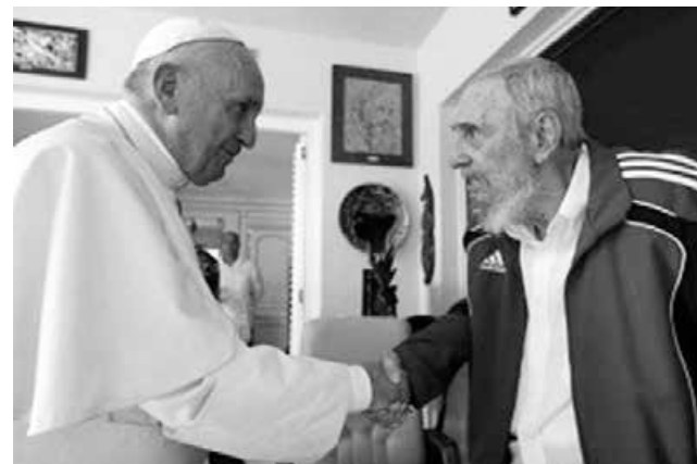
Papa Francisco e Fidel Castro

Os fugitivos cubanos são figuras que ficaram conhecidas pelo esforço de fugir do país pelo Caribe, em direção aos Estados Unidos ou México. Usando câmara de pneus de tratores, embarcações precárias e até tonéis eles tentam se livrar do regime cubano. Por causa dessas fugas, a ditadura proíbe os pescadores de terem barcos. Estima-se que um em cada quatro cubanos que tentam a travessia sobrevive. As estimativas apontam para mais de 16.000 mortes nesta rota.