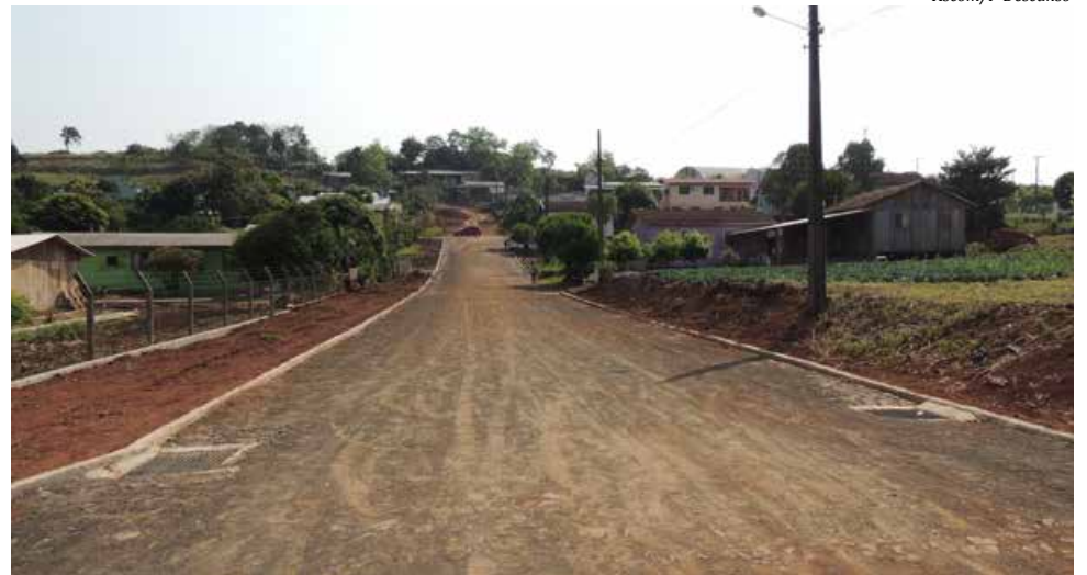
Até o final desta etapa de calçamento, serão pavimentados 2.360 metros quadrados