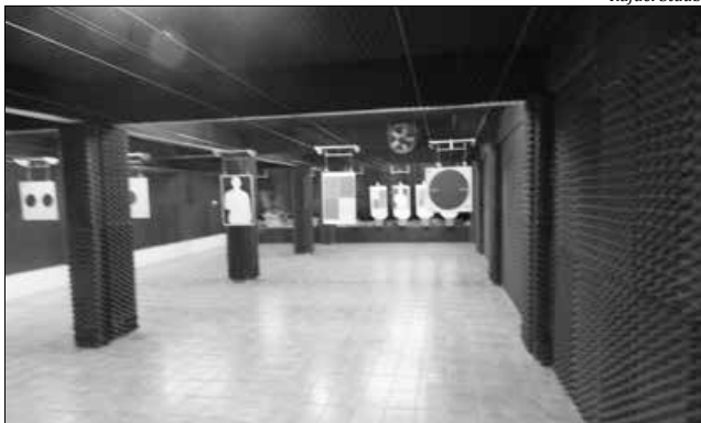
O clube conta com cinco boxes, contendo transportadores de alvos, com distância automática, sistema de treinamento para saque rápido e silhuetas giratórias, comandadas eletronicamente para o tiro dinâmico em alvos múltiplos

Hoje o clube conta com cinco boxes, contendo transportadores de alvos, com distância automática, sistema de treinamento para saque rápido e silhuetas giratórias, comandadas eletronicamente para o tiro dinâmico em alvos múltiplos