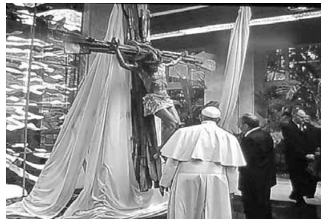
Presente recebido pelo Papa do mandatário cubano, Raul Castro

O Papa Francisco também deu prosseguimento às negociações de paz iniciadas em novembro de 2012, entre o governo colombiano e as Forças Armadas Revolucionárias da Colômbia (Farc), apoiadas pelo sanguinário comunista, o Pontífice pretende acabar com um conflito armado que deixou 220.000 mortos em meio século e seis milhões de deslocados, segundo os dados oficiais.