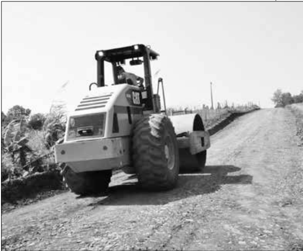
No trecho foram realizados serviços de limpeza e abertura da estrada, colocação de bueiros e britagem