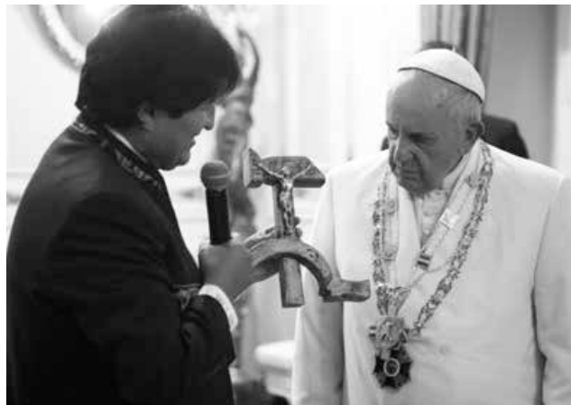
Crucifixo boliviano mostrado ao Papa na Bolívia

Francisco, o Papa, esteve nesta semana visitando a ilha presidio dos irmãos Castro - Fidel e o mano Raul. A empreitada de Francisco se resume em apagar as malvadezas comunistas cometidas desde 1959. Entre elas, banir o clero da ilha e se apossar do valioso patrimônio da Santa Igreja Católica Apostólica Romana. As opções para o clero eram abandonar o país somente com a batina ou "paredão".