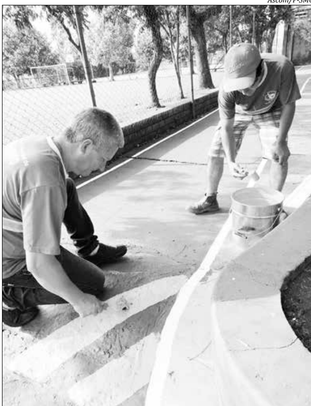
Na última semana, os profissionais do Demutran, em uma ação conjunta com o Colégio La Salle Peperi, trabalharam na execução do projeto "Pista de Trânsito Infantil"

Enquanto isso, a Polícia Militar também está desenvolvendo atividades relativas à semana do Trânsito. Dentre as atividades, destacam-se a orien-