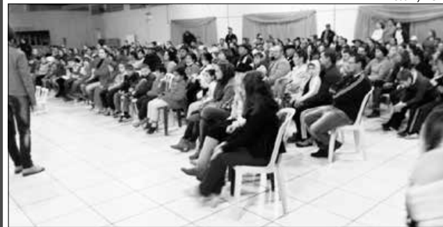
O Projeto Busca formas diferentes de apresentar os trabalhos realizados pela escola aos pais e comunidade escolar

O Projeto foi desenvolvido interdisciplinarmente, onde cada turma explorou o conteúdo dentro de suas potencialidades. Professores da escola afirmam ser uma forma mais significativa de se estudar, considerando ser esta a proposta a ser seguida e mais projetos da escola. De acordo com a direção, foi grande a participação dos pais nesta noite, deixando alunos e escola satisfeitos.