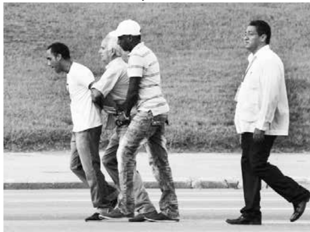
Dissidentes cubanos não dignos de ver o Papa

Após perder espaço com a revolução comunista de 1959, a Igreja Católica tem recuperado seu posto na sociedade cubana nos últimos anos e se transformou em um importante interlocutor do governo de Raul Castro, que substituiu seu irmão Fidel em 2006 e que assistiu a missa. Como parte do inédito diálogo iniciado em 2010 entre os bispos católicos e o presidente cubano, o Comunista começou em 2013 a devolver à Igreja, imóveis nacionalizados há meio século, quando Fidel impôs o ateísmo na Constituição.