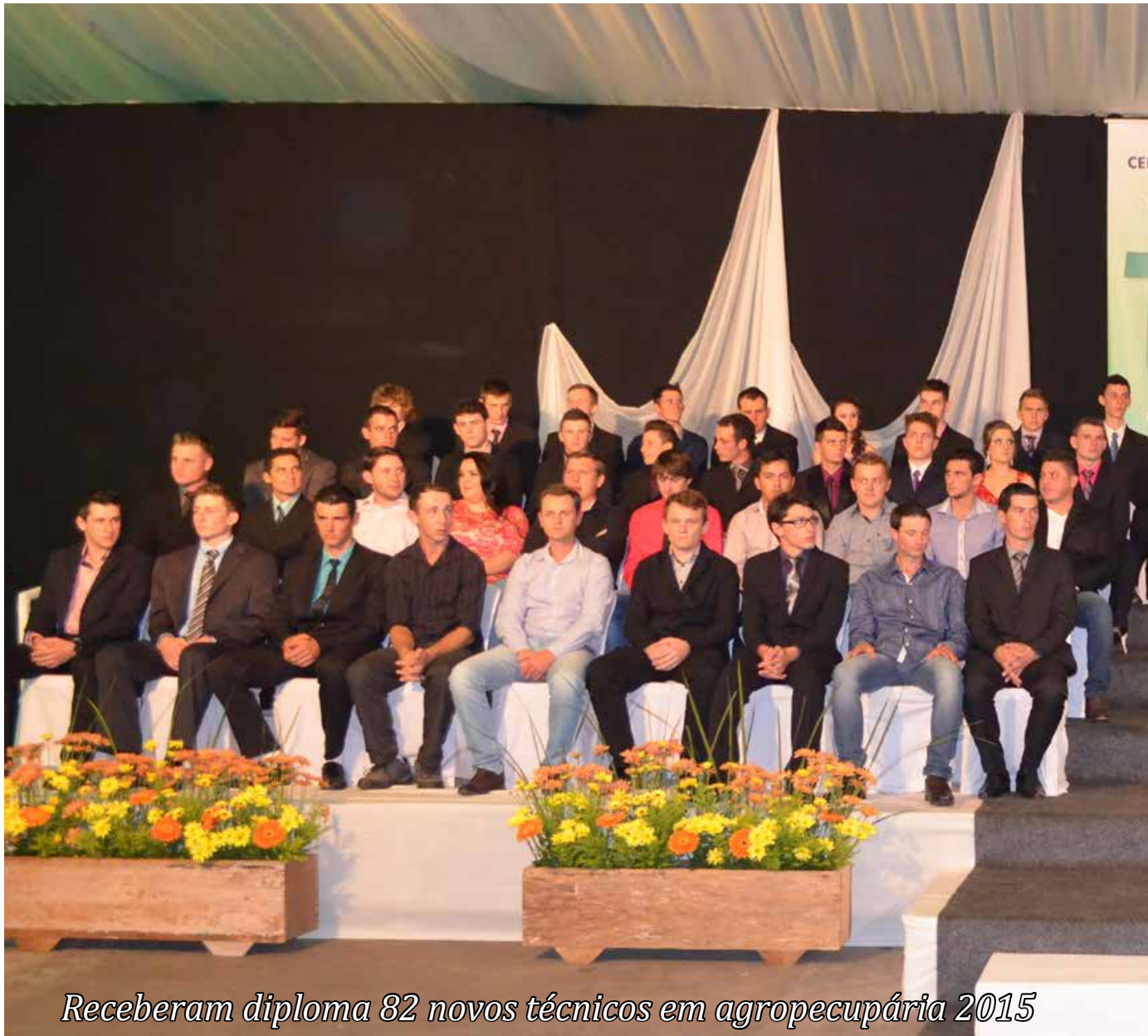
Receberam diploma 82 novos técnicos em agropecuária 2015