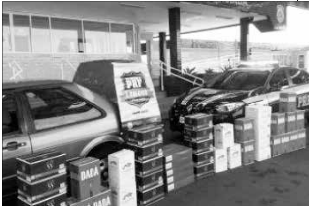
Veículo estava com 43 caixas de vinho da argentina