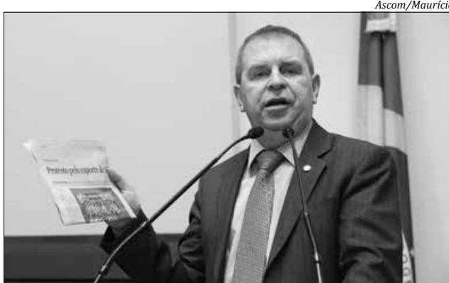
Deputado estadual Mauricio Eskudlark

Para se ter ideia, no município de São Miguel do Oeste, que possui pouco menos de 40 mil habitantes, os valores destinados mensalmente para a Câmara de Vereadores ultrapassam R$ 339 mil. Com a redução dos 2% sugerida pelo parlamentar, o repasse seria de R$ 242 mil. “Este valor mensal é mais do que suficiente para dar continuidade ao trabalho legislativo, sem contar que teríamos um aporte de mais de R$ 1,1 milhão anuais para investimentos na saúde”, ar-