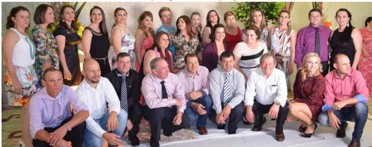
Grupo de servidores do Cedup-GV estiveram presentes na formatura