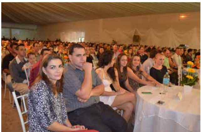
Cerca de 1.500 pessoas prestigiarão a formatura