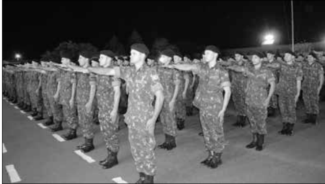
Soldados juraram defender a pátria com o sacrifício da própria vida