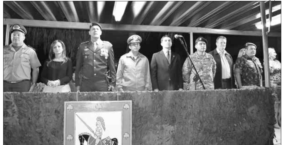
Além das autoridades militares, a cerimônia foi prestigiada também por autoridades civis

A principal função do Regimento é fazer a segurança e o patrulhamento de toda a fronteira catariense com a Argentina. O Regimento trabalha também em parceria com os governos federal e estadual em operações sanitárias,