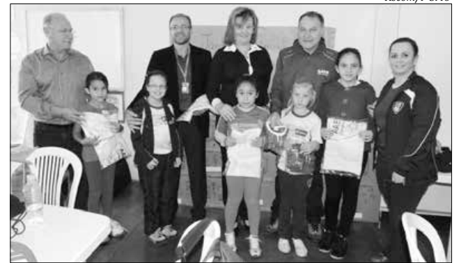
O uniforme completo com camiseta, agasalho, calçados e kit de higiene foi entregue para as 360 crianças que participam do programa