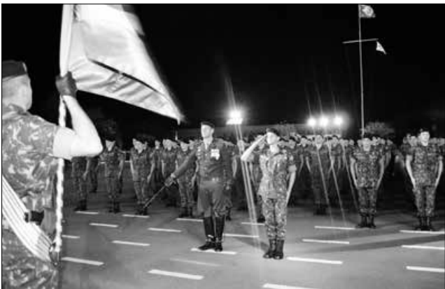
Soldados foram condecorados por terem se destacado no decorrer do ano de instrução