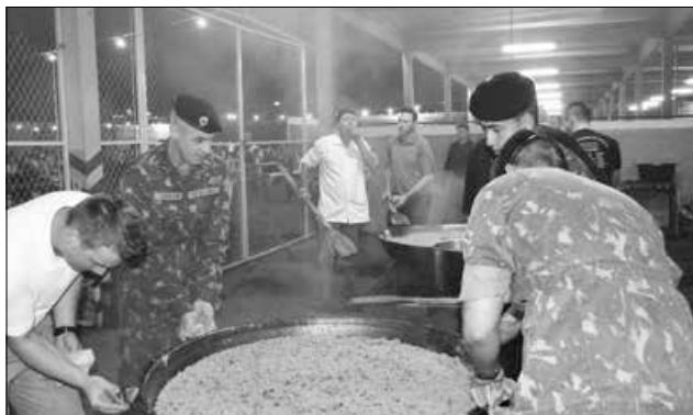
Cozinheiros do Regimento se superaram no preparo do carreteiro e feijoada servido aos convidados

Como é costumeiramente ensinado nas escolas, por professores apedeadas, Duque de Caxias não comandou o massacre guarani em terras paraguaias. Na verdade, o massacre foi comandado pelo Conde D'Eu, francês, genro de D. Pedro II, que almejava o trono, fato impedido pelos marechais Deodoro da Fonseca e Floriano Peixoto com a proclamação da República.