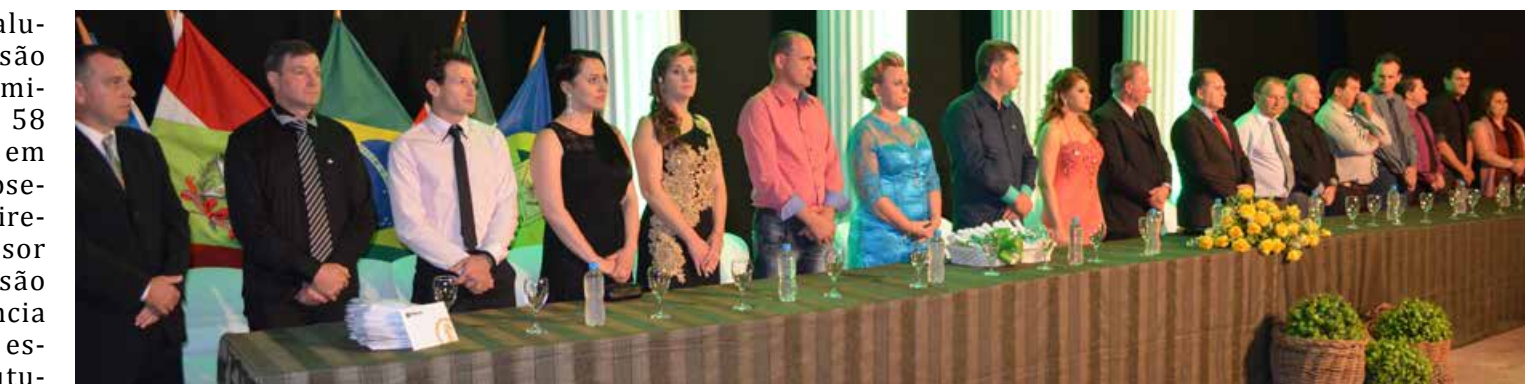
Autoridades municipais, regionais e estaduais prestigiaram o evento