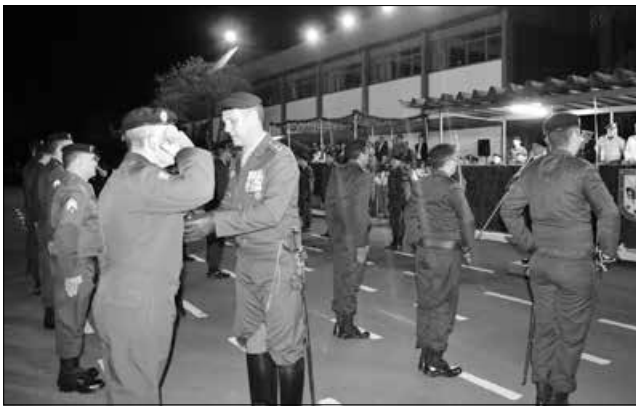
Militares receberam condecoração pelos relevantes serviços prestados à Pátria

Durante a cerimônia, em nota, o comando reverenciou os 174 anos do lendário Regimento que tem a sua origem na então Província de Goiás