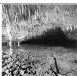
PANTANAL BONITO - CORUMBÁ - BOLÍVIA 15 SET 2015