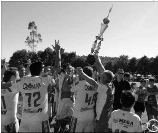
Título é inédito para a equipe