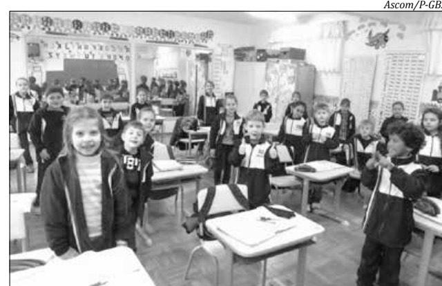
Os agasalhos foram entregues às turmas de 1º ano e aos alunos novos que ingressaram nestas unidades