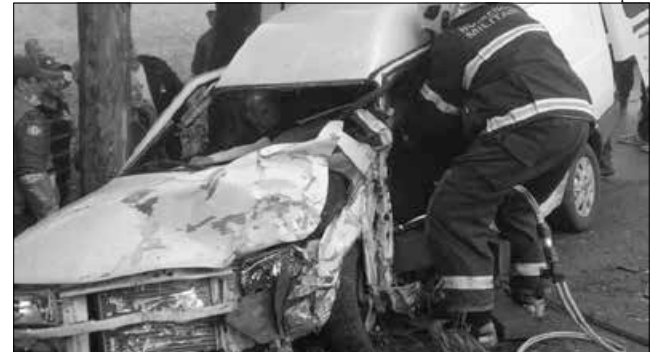
Vítimas ficaram presas às ferragens e foram retiradas pelos bombeiros

O choque ocorreu entre um Palio e uma Fiorino. No Palio, estava apenas a condutora, que não sofreu ferimentos. Já na Fiorino, o motorista teve suspeita de fratura na perna e o passageiro teve fratura em um dos braços. De acordo com a Polícia Rodoviária Estadual, houve uma ultrapassagem indevida, que teria causado a batida frontal.