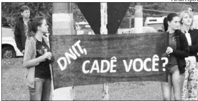
Estudantes fizeram parte do protesto segunda-feira no trevo de Guarujá do Sul