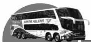
VIAJAR FAZ BEM

49 3622 0227 www.santahelenaturismo.com.br