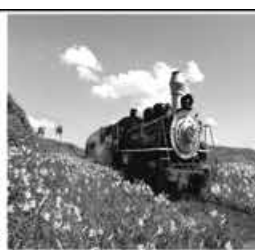
NATAL LUZ BENTO e GRAMADO 26 NOV 2015