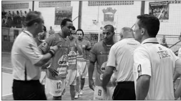
A Asme retorna somente no segundo turno da Primeira Divisão, provavelmente em agosto. Araquari empatou em 4 a 4, faltando dois minutos para o fim do jogo.

No tempo normal, a Asme saiu perdendo, conseguiu se recuperar e ficou na frente do placar durante o jogo, mas sofreu empate por 3 a 3 com grande sufoco. No final, a Asme conseguiu ficar na frente com um gol de goleiro linha e acreditava que levaria para a prorrogação. Gabi fez, porém Araquari em-