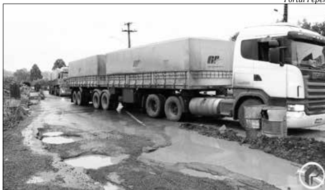
Situação no trevo de acesso a São José do Cedro é crítica

Em Guarujá do Sul, na tarde de segunda-feira, moradores fizeram uma manifestação no trevo de acesso à cidade, reunindo cerca de 100 pessoas, entre o prefeito, vereadores, professores, estudantes, agricultores, comerciantes e demais segmentos. A decisão de fazer o ato surgiu na sexta-feira, 17, após uma reunião entre a Câmara e membros da