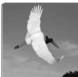
PANTANAL BONITO - CORUMBÁ - BOLÍVIA 19 AGO 2015