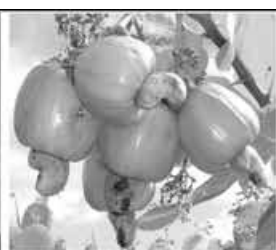
NORDESTE BRASIL 28 AGO 2015