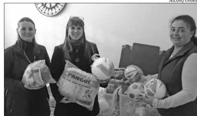
Curso de Educação Física entregou bolas às escolas

Na Unoesc São Miguel do Oeste, o Pibid conta com a participação de 20 acadêmicas de Pedagogia e de 20 estudantes de Educação Física, além de professores supervisores, que atuam nas escolas municipais Aurélio Pedro Vicari, Juscelino Kubitschek de Oliveira, Marechal Arthur da Costa e Silva e Attilio Luiz Calza. O Pibid tem o objetivo de