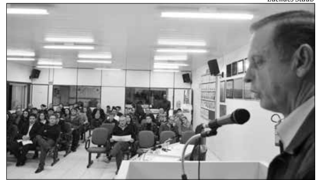
Prefeito Hélio José Daltoé diz que este passo é importante para que ocorram as mudanças significativas através do mapeamento econômico do município

O prefeito Hélio José Daltoé esclareceu que o apoio ao comércio local faz parte do plano de governo da atual administração e este passo é importante para que ocorram as mudanças significativas através do mapeamento econômico do município. "Eu confio plenamente no trabalho do Sebrae e tenho convicção que, se todos os membros da sociedade realmente se envolverem com os trabalhos de implantação do DET, ao final do projeto os melhores resultados serão alcançados", afirmou o