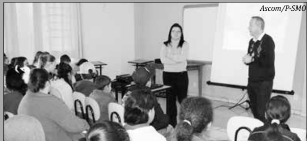
Palestras conscientiza os estudantes, que após repassam os assuntos às famílias