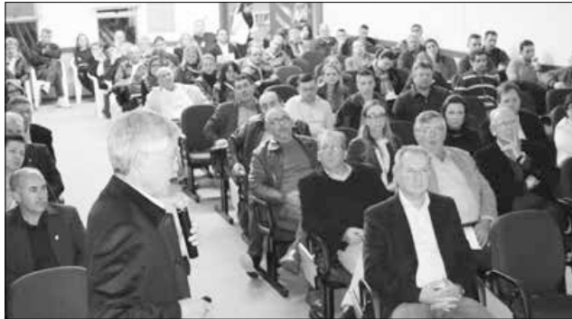
Secretário executivo de Mobilidade Urbana e ex-prefeito de Curitiba, Cassio Taniguchi, trouxe conceitos do assunto e exemplificou com planejamentos realizados em Curitiba, Brasília e Florianópolis

A abertura oficial do evento ficou por conta do consultor geral de Assuntos Estratégicos, Hamilton Peluso. "Já encerramos o Ciclo de Palestras em grandes centros e tivemos retornos positivos da sociedade. Os relatórios nos auxiliam no planejamento das ações do Estado e a sociedade tem sido muito participativa, atuante e trazendo questionamento e sugestões relevantes", afirma.