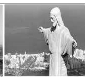
RIO de JANEIRO JAN 2016