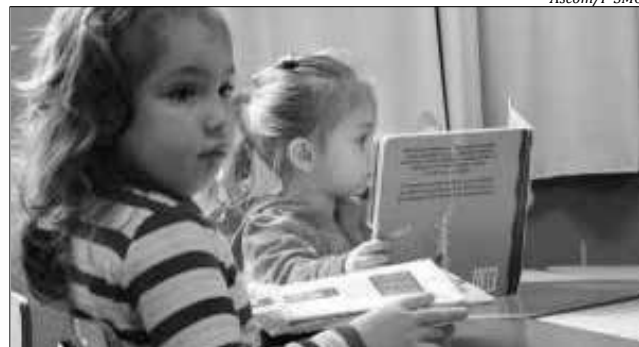
Alunos da Rede Municipal de Ensino retornam às aulas no dia 3 de agosto