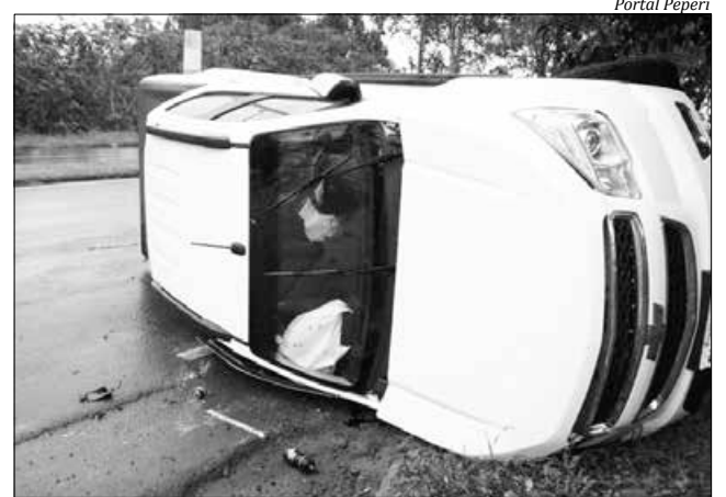
A caminhonete conduzida tombou após a colisão