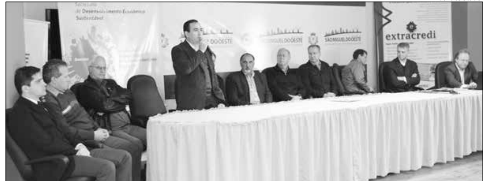
Solenidade de instalação reuniu autoridades, empresários e representantes de entidades

A iniciativa faz parte da implementação da Lei Geral das Micro e Pequenas Empresas, que estabelece normas gerais relativas ao tratamento diferenciado e favorecido aos pequenos negócios no âmbito dos poderes da União, dos Estados, do Distrito Federal e dos municípios. "É preciso oferecer oportunidades para que os novos e os atuais empresários inovem e busquem aprimorar e apresentar o diferencial na área que atuam", en-