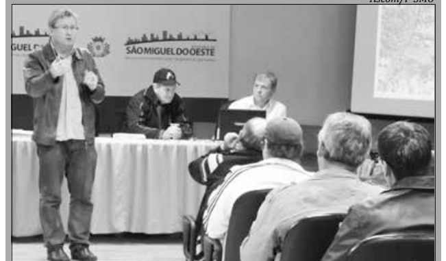
Participaram desta audiência cerca de 30 famílias, moradoras da Chácara nº 26, próximo ao Caic