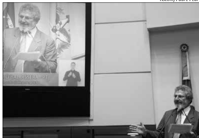
Padre Pedro enalteceu as ideias do Papa Francisco a respeito do meio ambiente

O parlamentar lembrou que o texto ainda condena a proposta de internacionalização da Amazônia, que, segundo aborda, apenas serviria aos interesses das multinacionais e critica a privatização de serviços essenciais na área ambiental, afirmando que é previsível que o controle da água por parte de grandes empresas mundiais se converta em uma das principais fontes de conflitos deste século.