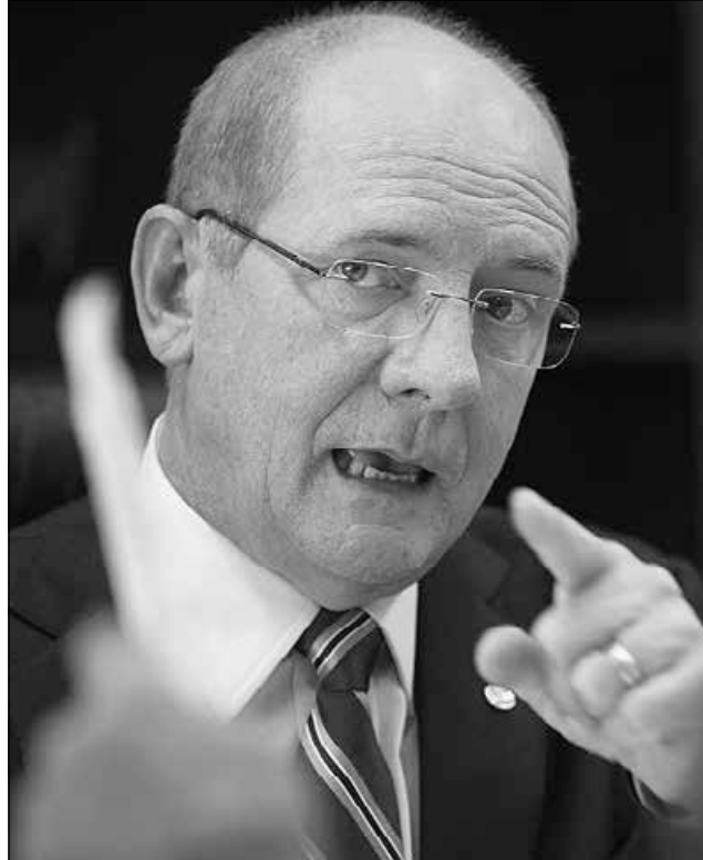
Senador Paulo Bauer