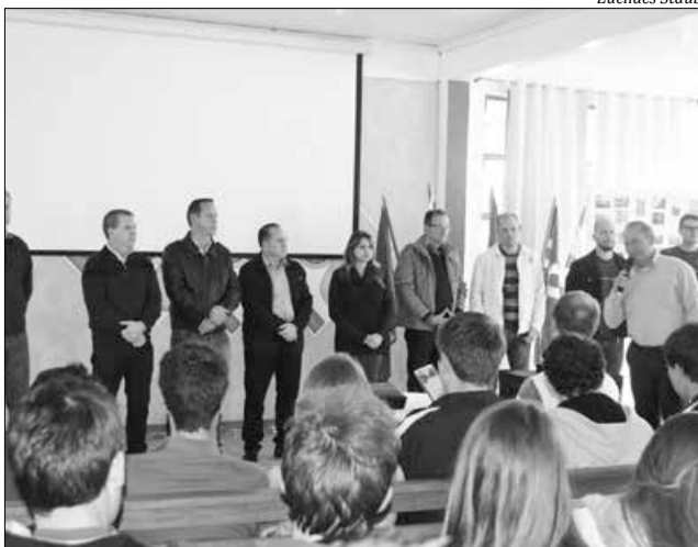
Autoridades municipais e estaduais prestigiaram a solenidade