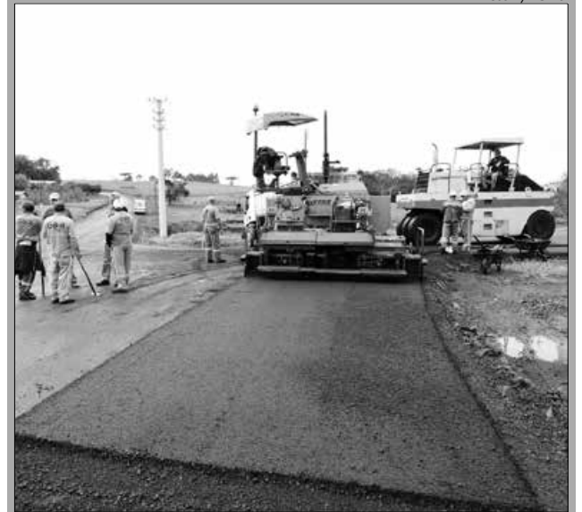
O prefeito João Valar tem acompanhado todas as etapas