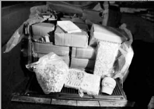
Produto estava estocado na carroceria da caminhonete