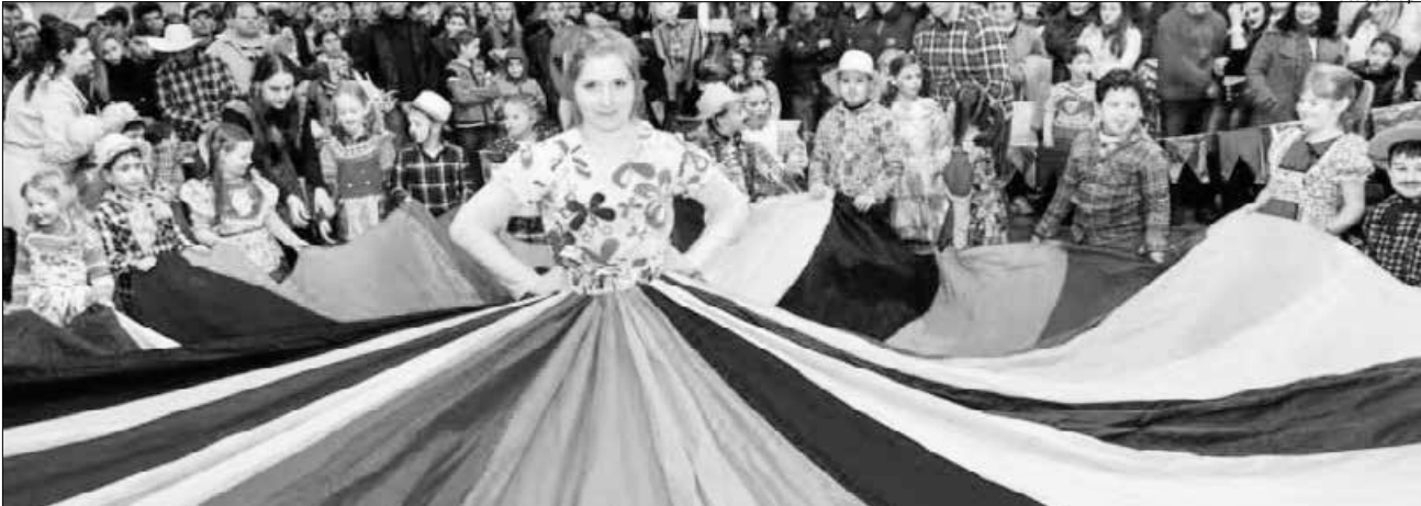
Na área coberta da Praça, Colégio Juscelino Kubitschek de Oliveira também promoveu sua festa

ESTADO DE SANTA CATARINA / PODER JUDICIÁRIO