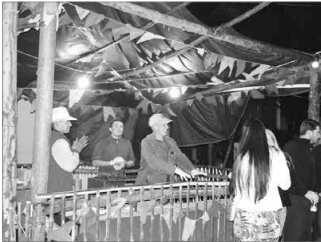
Festa teve muito quentão e diversas comidas típicas

Foi nos dias 02 ate 05/07, a festa na vila militar dos sargentos, festa esta que acontecia há alguns anos atrás, e haviam parado, mas este ano foi retomada e com sucesso total, a galera aproveitou pra tomar um delicioso quentão e demais comidas típicas, a festa foi de arromba, com uma boa música ao vivo, esperamos repeteco pra o próximo ano.