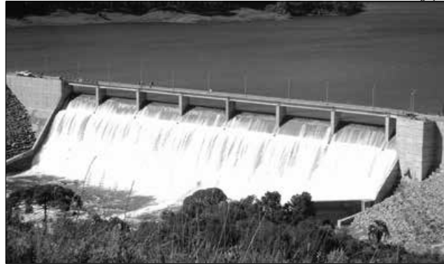
Juntas, as três usinas podem gerar 13,95 MW, suficiente para abastecer 100 mil pessoas

O programa, lançado pelo governador Raimundo Colombo, prevê uma série de medidas que incentiva o investimento em energias alternativas, limpas e renováveis, como PCHs, Centrais Geradoras Hidrelétricas (CGHs), eólicas, solar e biomassa. Colombo destaca que a criação do SC+Energia é uma medida de enfrentamento à crise. "Temos uma