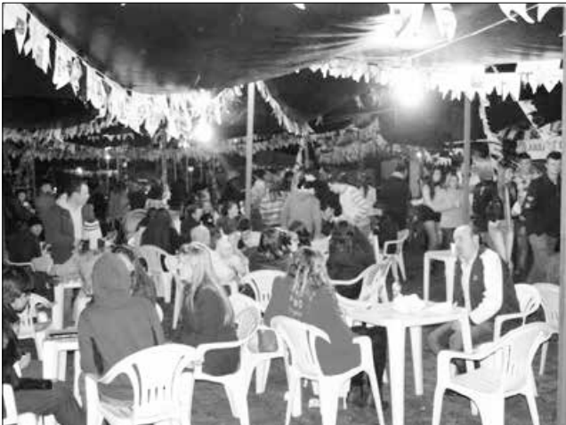
Mesmo com frio e chuva, público compareceu para a festa na vila Militar