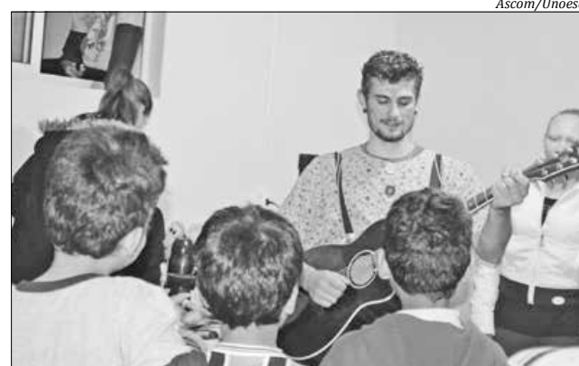
Acadêmicos de Artes desenvolveram atividades com crianças do Abrigo Institucional Cantinho Acolhedor