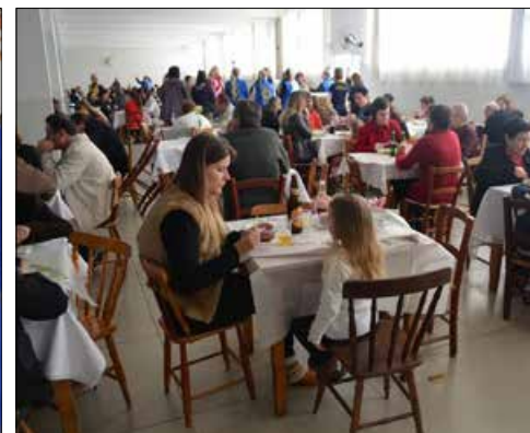
Centenas de pessoas se fizeram presentes à Festa do Porco Recheado, em São Miguel do Oeste