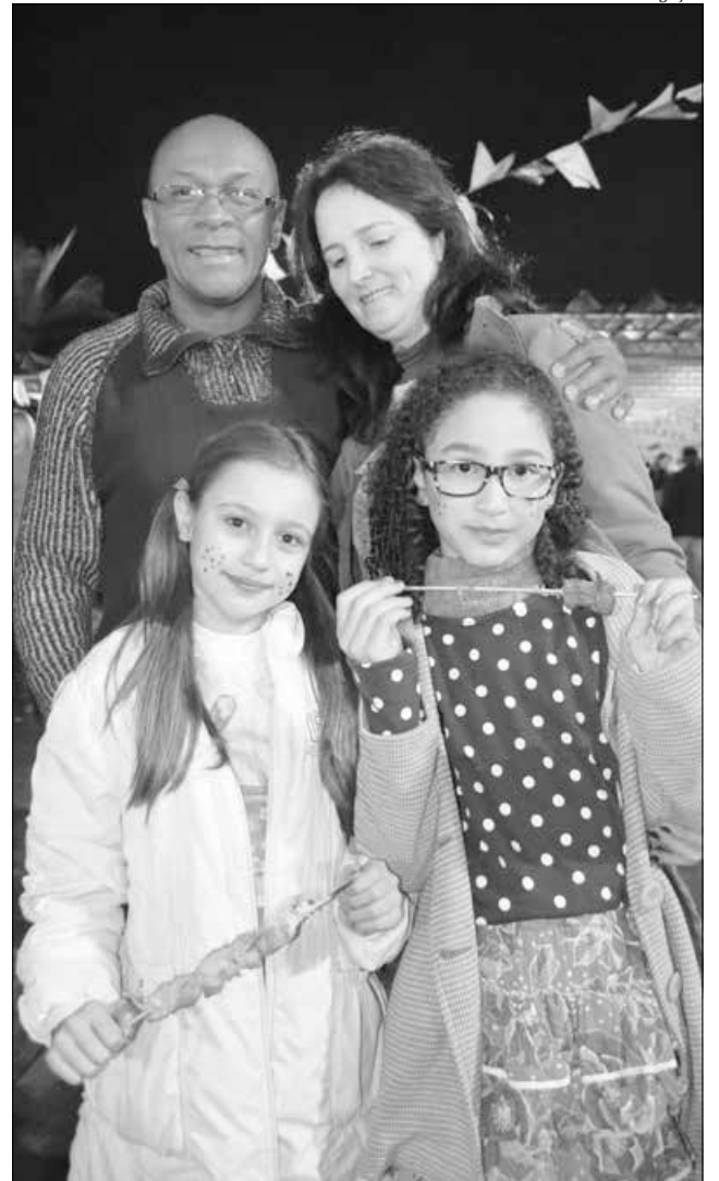
No Colégio La Salle Peperi, a festa reuniu alunos e famílias