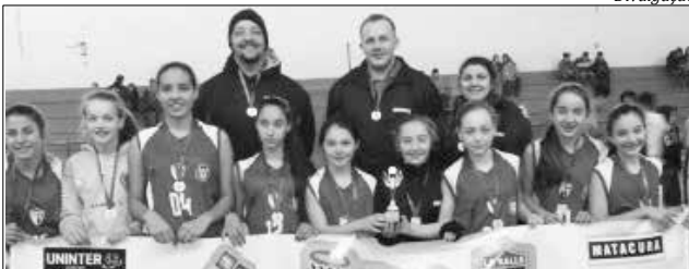
Com um triangular de antecedência, a equipe de São Miguel do Oeste garantiu vaga