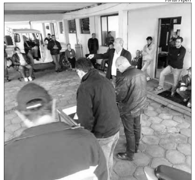
Cerca de 40 funcionários participaram da assembleia ontem em São Miguel do Oeste

Conforme Gomes, os serviços oferecidos à população como fornecimento de água e a manutenção da Estação de