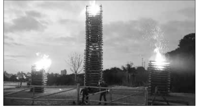
Fogueira gigante foi acendida no sábado e encantou o público presente