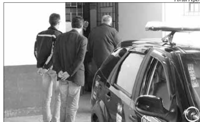
Prefeito Altair Rittes (C) nega todas as acusações e aposta na inocência dos servidores