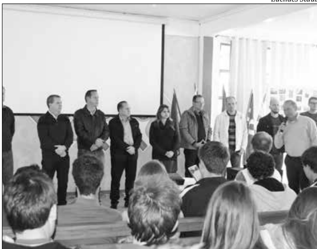
Autoridades municipais e estaduais prestigiaram a solenidade