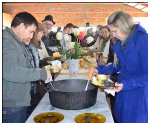
Tradicional feijoada no salão paroquial de Guaraciaba terá renda revertida para ações sociais