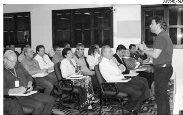
As prioridades elencadas pelo grupo será a base para a elaboração do Plano Plurianual 2016-2019