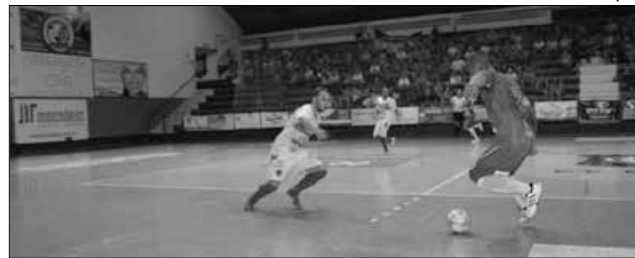
Asme abriu o placar, sofreu o empate, mas ampliou o placar no segundo tempo