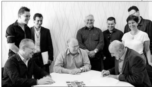
O ato de assinatura do convênio foi realizado quarta-feira na prefeitura

O presidente da Casan destacou que o município terá outros importantes investimentos previstos pela Companhia, como a