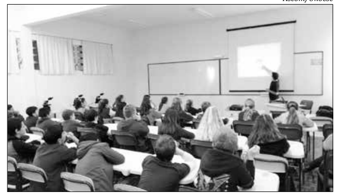
A palestra teve a participação de 58 alunos da Escola Emma Balke