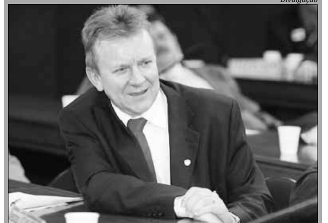
Deputado federal Celso Maldaner

Outra ação que proposta por Maldaner ao ministro foi que a cartilha das escolas rurais seja trabalhada em cima da realidade local, se tornando mais atraente aos estudantes. "Por fim, destaquei que é fundamental valorizar as Casas Familiares Rurais", explica o deputado. Em sua explanação, Patrus Ananias afirmou que o ministério trabalha para a consolidação da agricultura familiar e destacou a importância do setor para a economia brasileira e a produção de alimentos no Brasil.