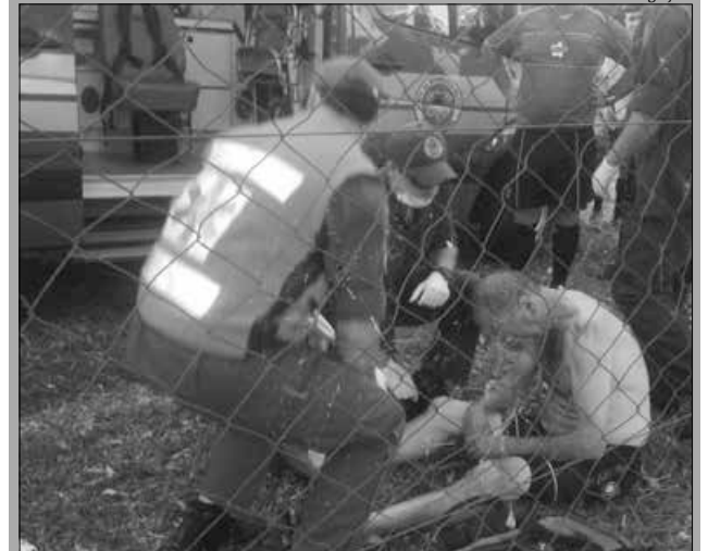
Bombeiros atenderam jogador em Linha São Pedro