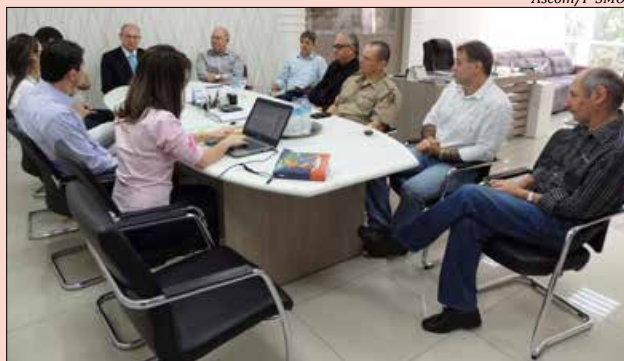
Encontro contou com a presença de representantes do Poder Judiciário, Polícia Militar e autoridades municipais