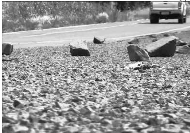
BR-163, atualmente com as obras de revitalização paradas, poderá ser entregue à iniciativa privada

Logo após, as empresas interessadas deverão se apresentar para a realização dos estudos que, por sua vez, devem durar até seis meses. Após a conclusão, aguarda-se a análise do Ministério do Planejamento e do Tribunal de Contas da União (TCU) para o início