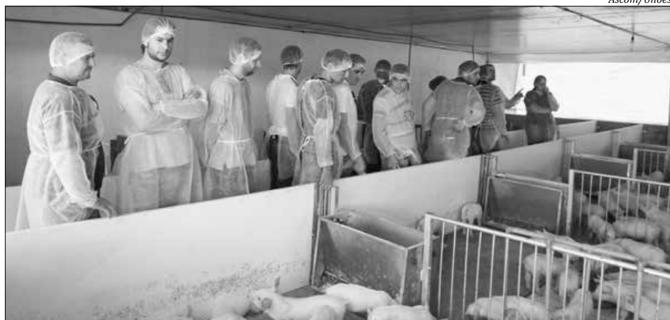
Estudantes de Agronomia conheceram a granja Barra Grande

Com mais de 2440 matrizes, a Barra Grande trabalha em parceria com a Cooper A1, possui Unidade de Produção de Leitões (UPL) e a creche, na qual o suíno permanece até atingir 24 a 28 quilos. Além de investir