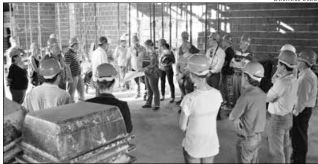
A nova sede está sendo construída na Rua Pedro Julian no Bairro Agostini, proximidades da Unoesc, e tem área de 1.925,25 metros quadrados

Os visitantes sugeriram mudanças no projeto, entre elas um espaço maior para a cozinha e até mesmo um restaurante, considerando que a obra está distante do centro da cidade. Mas os engenheiros da Conak Construções, empresa vencedora da licitação e responsável pela obra, e do arquiteto Marcos Telles, que assina o projeto, afirmaram que qualquer mudança agora implicaria em novo projeto e nova licitação. "Fiz tudo o que foi