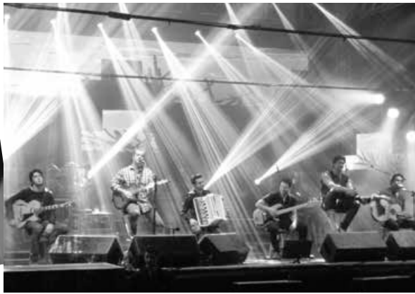
Show de Vitor e Leo