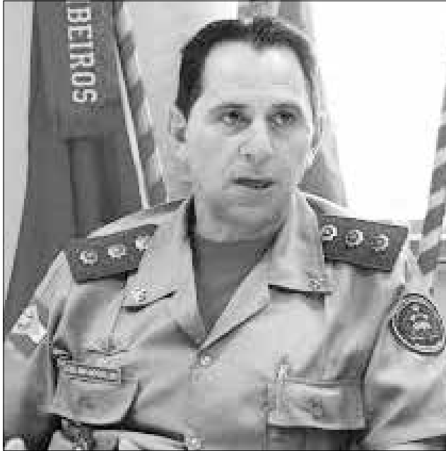
Coronel Onir Mocelin

Conforme o comandante, na região, só existe a unidade de São Miguel do Oeste nesta condição, enquanto as demais são básicas, sem médicos, e permanecerão atendendo normalmente. O comandante reconhece que o assunto é polêmico e diz que o coronel Mocelin vai dar mais detalhes da situação quando da visita à região. Onir Mocelin coronel vai participar de uma reunião no quartel do Batalhão em São Miguel do Oeste durante a manhã, e à tarde, visitará o 14º Regimento de Cavalaria Mecanizado. Mocelin também visitará os quartéis de Guaraciaba e Iporã do Oeste.