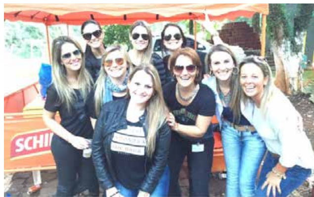
Algumas das belas que apareceram por lá