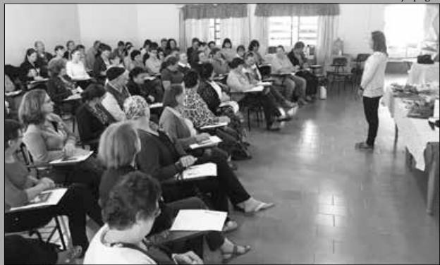
Mais de 80 pessoas participaram do dia de capacitação