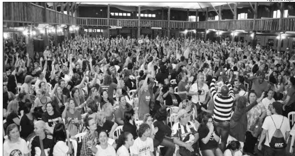
Cerca de dois mil professores participaram da assembleia que definiu pela continuidade do movimento

Os servidores avaliam que o Executivo estadual pouco avançou nas reivindicações que motivaram a greve, entre elas a descompactação da tabela, o piso da categoria e a incorporação da regência de classe. Logo após o encontro, por volta das 18h, os integrantes do movimento grevista bloquearam a BR 101 por cerca de 10 minutos em forma de protesto, o que causou congestionamento na rodovia. Um boneco representando o