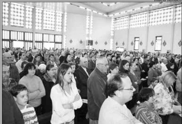
Missa lotou a igreja matriz na celebração da padroeira