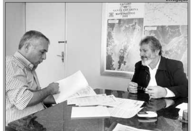
Deputado estadual Padre Pedro Baldissera

Padre Pedro também tratou do projeto de lei que institui a Política Estadual de Práticas Integrativas e Complementares (PIC). O objetivo é garantir um debate amplo sobre as PICs, que ganham cada vez mais destaque no País e apontam para um novo horizonte nos tratamentos dentro do Sistema Único de Saúde (SUS).