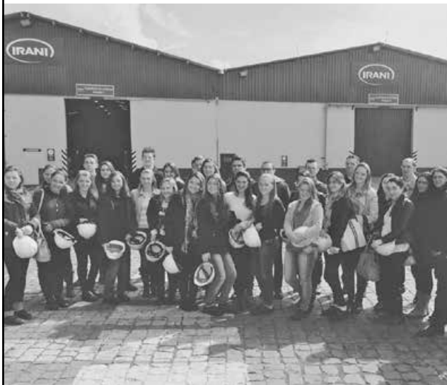
Estudantes conheceram a empresa Celulose Irani, de Vargem Bonita