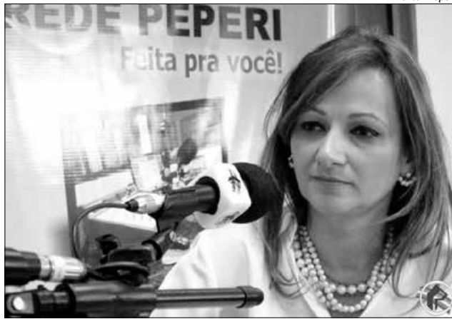
Presidente da Câmara defendeu o trabalho dos vereadores no projeto