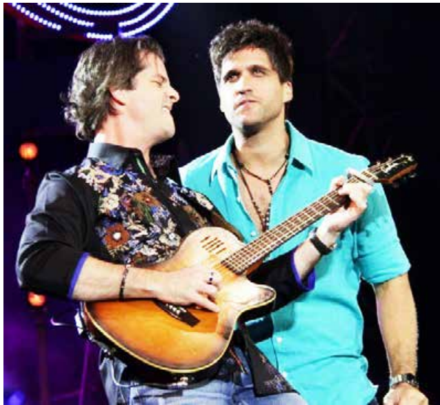
Neste sábado tem Victor e Leo, em São Miguel

Pontos de venda em São Miguel: Loja Juzz e Posto Daltoé. Descanso: Cantinho Doce. Cedro: Rádio Cedro FM. Iporã: Hora Certa Conveniência. Anchieta: Bandeirante Confeccões e em Maravilha na Loja Ousadia. Ingressos online: www.blueticket.com.br Informações: (49) 3622-0633.