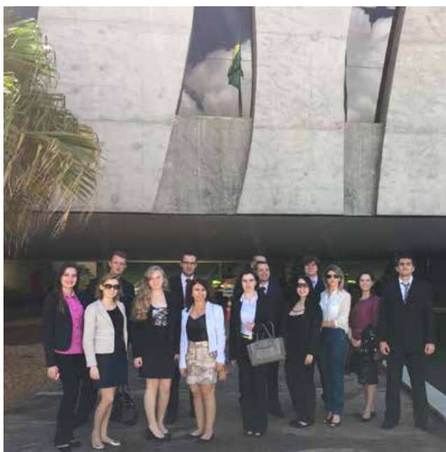
Participantes em frente ao prédio do Superior Tribunal de Justiça (STJ)