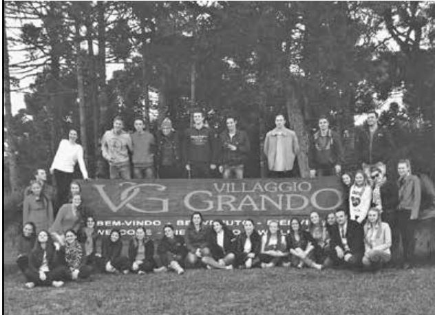
Estudantes de Administração visitaram a Vinícola Villaggio Grand

Acadêmicos da quinta fase do curso de Administração da Unoesc São Miguel do Oeste conheceram, neste mês, a Vinícola Villaggio Grand, localizada em Água Doce (SC), e a Celulose Irani de Vargem Bonita (SC).