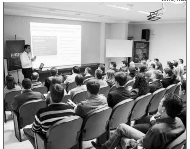
Lançamento integrou a programação da Semana da Indústria

Os integrantes das 12 empresas participarão de oficinas que visam o desenvolvimento e fortalecimento da cadeia produtiva, por intermédio de ganhos de eficiência na gestão, redução dos desperdícios, redução dos custos e consequente, ganhos de produtividade, proporcionando aumento da eficiência para o fortalecimento da competitividade.