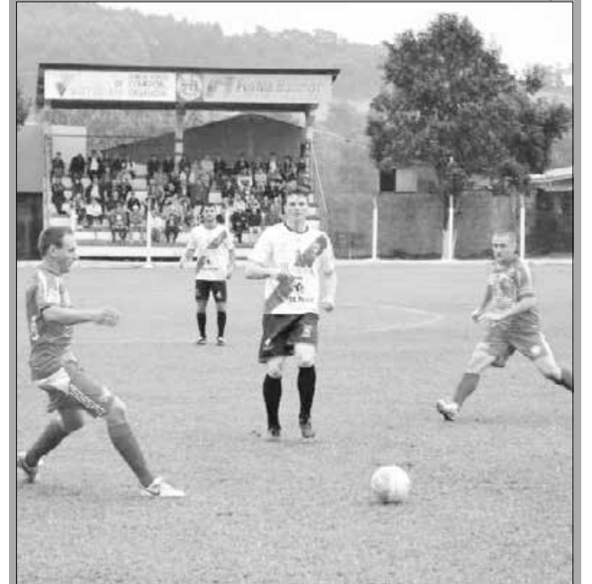
Em Guaraciaba, Guarani e Harmonia ficaram no 1 X 1