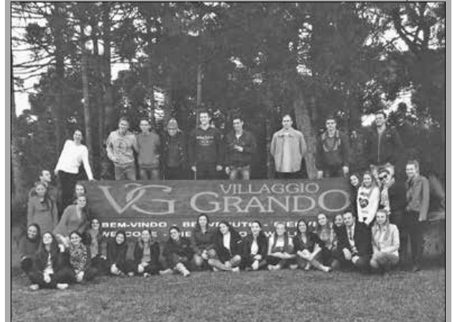
Estudantes de Administração visitaram a Vinícola Villaggio Grando