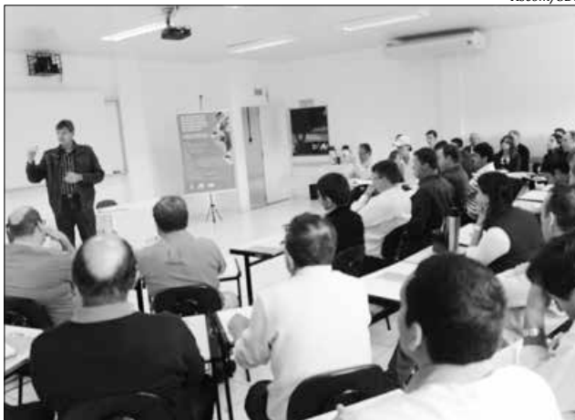
Reunião entre representantes da Secretaria da Agricultura e da Cidasc, prefeitos, secretários municipais de agricultura e lideranças do setor agropecuário da região discutiu a implementação do Programa

A Secretaria da Agricultura irá alocar recursos para contribuir com a realização dos exames nos animais e a indenização, via Fundo Estadual de Sanidade Animal