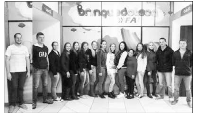
Na ocasião, foi eleita a nova diretoria do Centro Acadêmico