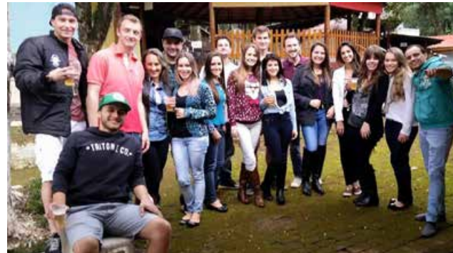
Acadêmicos que participaram do festerê

Sábado, no Clube Jardim, parte dos acadêmicos do 5º período (A), noturno, do curso de Direito promoveu uma confraternização. Só gente bacana. E dedicada. Que estuda muito, mas sabe que uma festa de vez em quando faz bem.