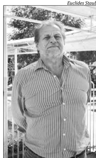
Vice-prefeito Florindo Oro diz que a reivindicação da comunidade é justa e agora será atendida