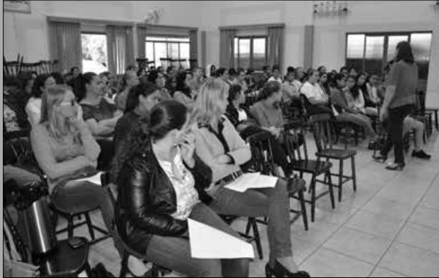
O evento contou com a presença de autoridades locais, estudantes, servidores e população em geral