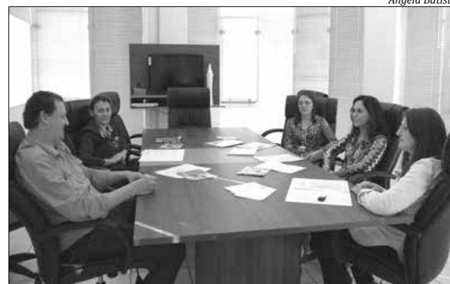
Projeto está sendo apresentado aos empresários da região