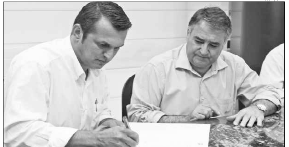
Para a implantação da creche serão utilizados recursos do Fundam, por intermédio de convênio assinado em dezembro de 2014 pelo prefeito Gilberto Giordano e o governador Raimundo Colombo

O prefeito Gilberto Jordano, que está em férias, disse ontem, terça-feira, à reportagem do Jornal Imagem que desde o ano passado está empenhado em angariar recursos para viabilizar projetos de inte-