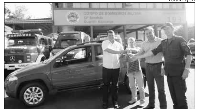
A nova caminhonete vai substituir a Toyota que ainda faz parte da frota

Um novo caminhão completamente equipado também está com prazo de 10 dias para ser entregue à corporação de Itapiranga. Atualmente, o Corpo de Bombeiros do município possui oito veículos, três barcos e um jet ski, além de diversos acessórios de segurança para os atendimentos à população.