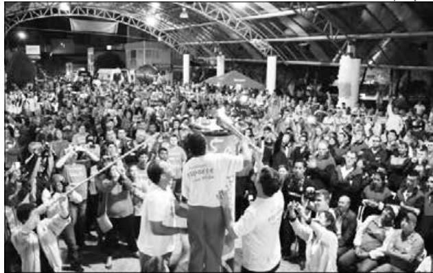
Abertura oficial do evento aconteceu na Praça Valmir Bottaro Daniel, sábado

edição do Parajesc aconteceu na abertura do evento, na Praça Walmir Bottaro Daniel, na noite de sábado, 24. Os paratletas lotaram o espaço destinado ao cerimonial de abertura e abraços, encontros e aperto de