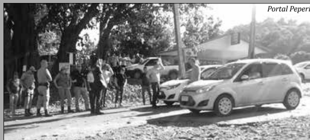
Reconstituição aconteceu quinta-feira e mobilizou a polícia