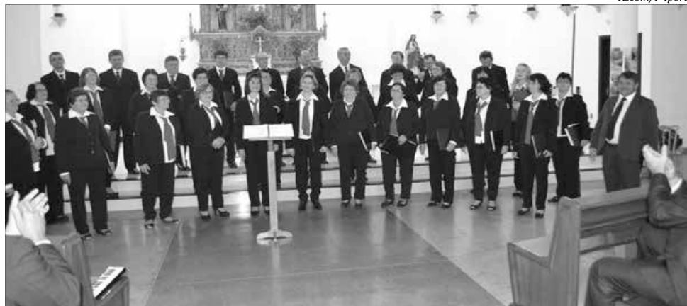
O coro masculino se apresentou na missa da igreja matriz Nossa Senhora das Mercês

O Coro Masculino Tiro ao Alvo e o Coral Misto da Cooperativa Piá, de Nova Petrópolis (RS) esteve na região no último final de semana. Os corais também realizaram apresentações em conjunto com a Associação Coral de Iporã do Oeste. O coro masculino se apresentou na sexta-feira, 24, e domingo, 26, na missa da igreja matriz Nossa Senhora das Mercês. O evento também teve