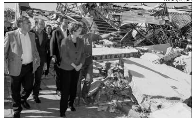
Dilma Rousseff percorreu as áreas atingidas na companhia do governador Raimundo Colombo

O governador Raimundo Colombo pediu que a presidente Dilma Rousseff assinasse medida provisória para garantir a liberação imediata de recursos para Xanxerê e Ponte Serrada. Colombo quer que as verbas liberadas por Dilma sejam repassadas ao Estado, que faria a aplicação em conjunto com as prefeituras