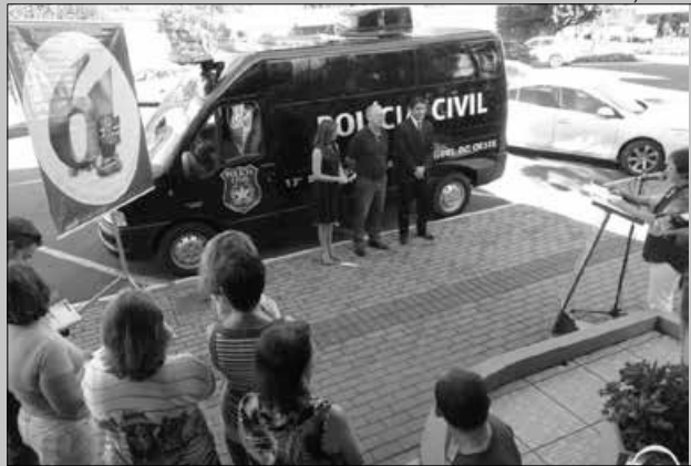
Veículo foi entregue na manhã de ontem