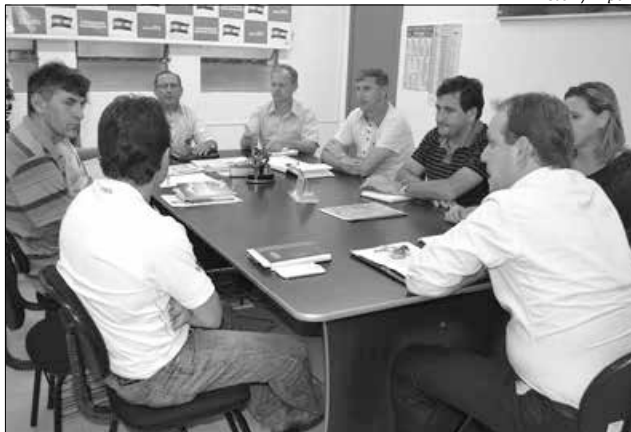
Reunião discutiu detalhes para a organização da feira

O presidente ressalta que o lançamento da 8ª Faic e anúncio dos shows foi marcado para o dia 10 de março, às 19h, na sala de reuniões da Associação Comercial e Industrial de Iporã do Oeste (Aciio). Eich comenta que a sub-comissão de Divulgação