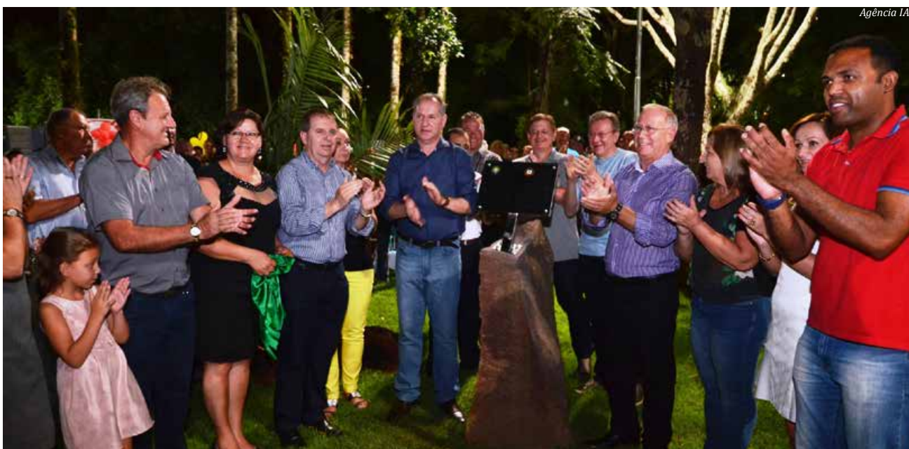
Placa marca a reinauguração da principal obra do governo do município