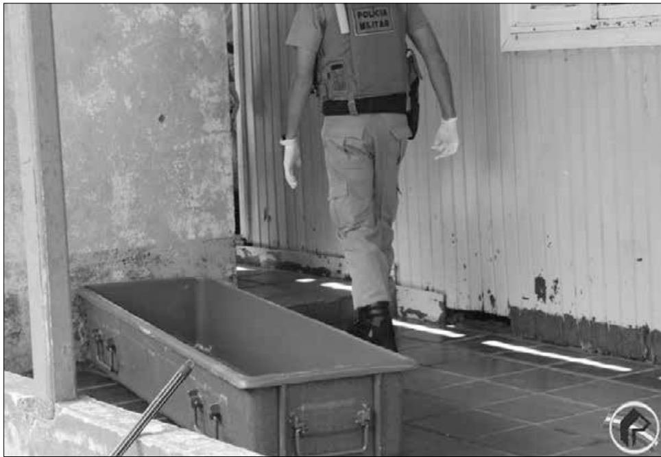
Polícia Militar foi responsável pela retirada dos corpos que foram levados para o IML

Os corpos estavam em um dos quartos da residência, já em decomposição, já que um forte mau cheiro já