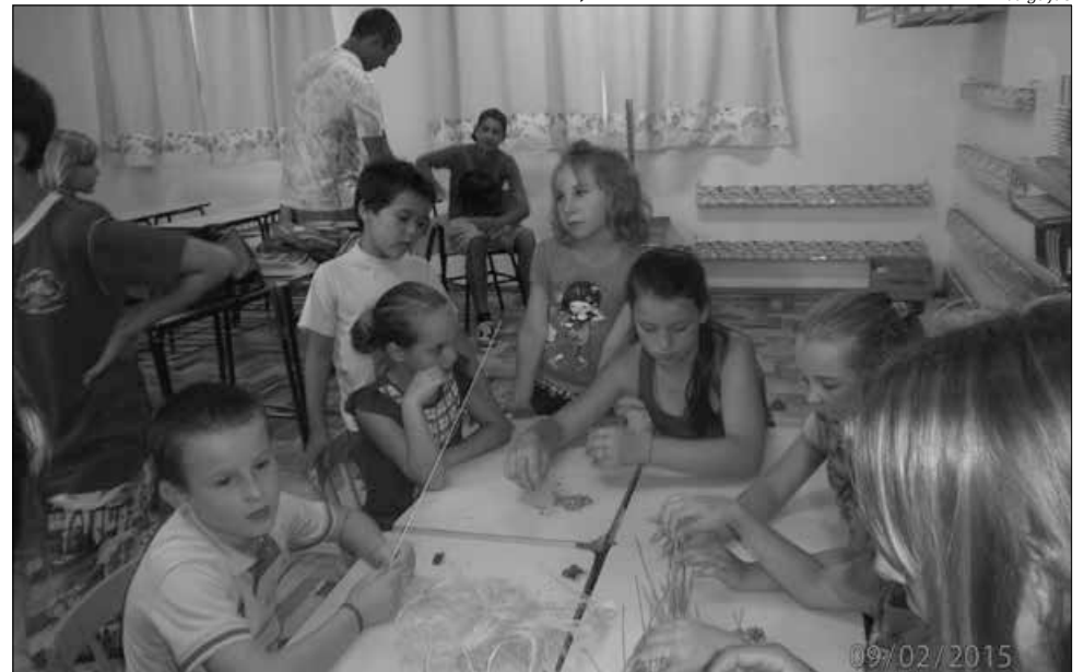
Alunos confeccionaram pequenos ninhos para identificar as salas