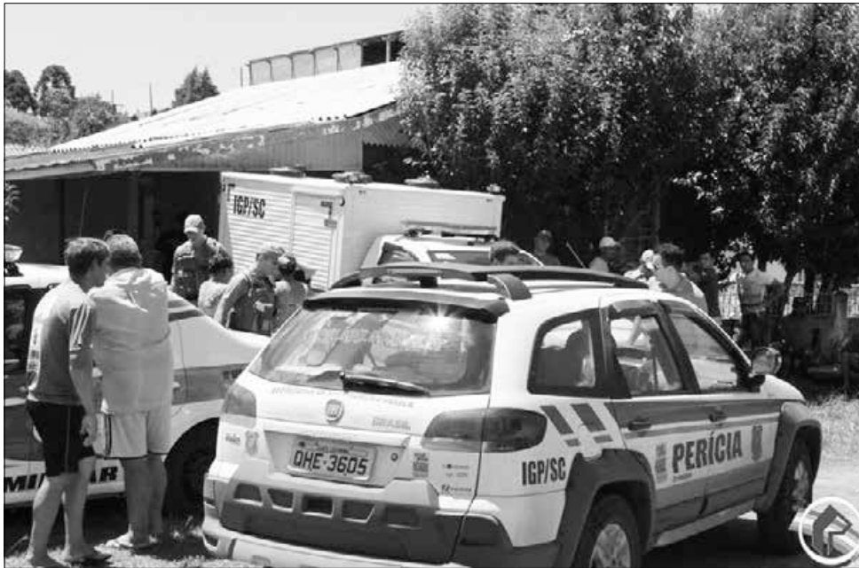
Movimentação policial atraiu a atenção da vizinhança na manhã de domingo