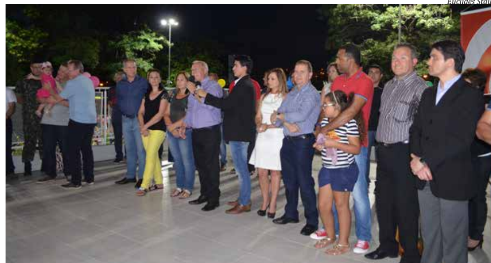
Autoridades municipais, estaduais e federais prestigiaram a solenidade