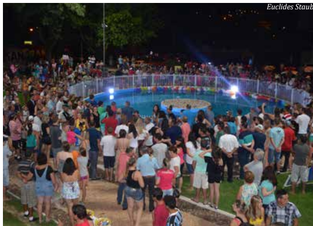
Novo chafariz é uma das principais atrações do local