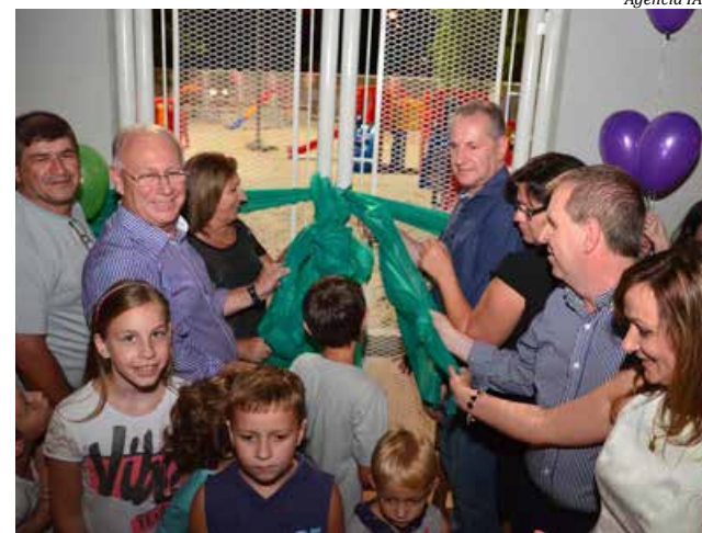
Corte da fita deu por inaugurado o novo parque infantil