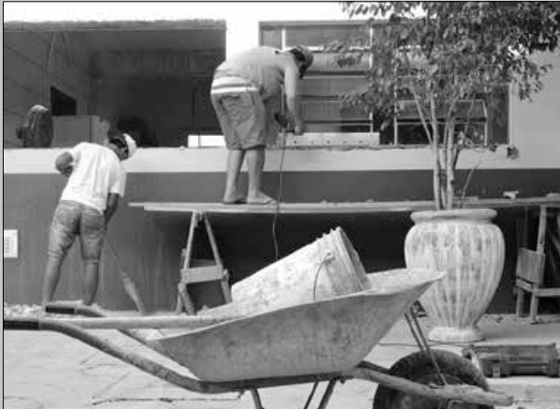
Escolas passaram por reformas e adaptações para receber os alunos