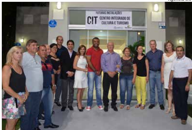
Futuras instalações do Centro Integrado de Cultura e Turismo compõe a nova praça