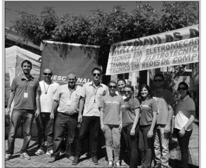
Equipe do Senai apresentou os cursos em exposição no calçadão