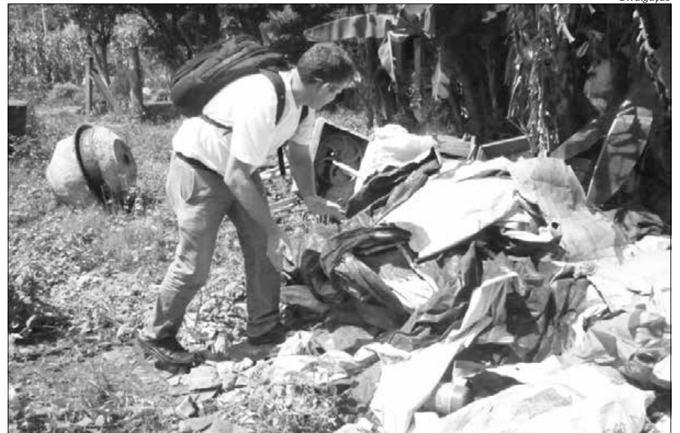
Lixo acumulado nas cidades é o principal criadouro do mosquito Aedes Aegypti

O levantamento também mostra que há o registro de 11 casos importados, contraídos em outros estados, registrados em Araranguá (1), Balneário Barra do Sul (1), Florianópolis (1), Guaramirim (1), Itajaí (1), Três Barras (1), São José do Cedro (1), Blumenau (1) e de moradores de outros locais do Brasil diagnosticados em Santa Catarina (3). No Estado, há 1.206 focos do mosquito Aedes aegypti , que transmite a doença. Entre os municípios, os que regis-