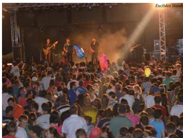
Show com a banda São Francisco atraiu milhares de pessoas