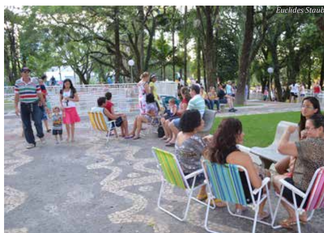
Na tarde de domingo, população já começou a usufruir novamente da praça