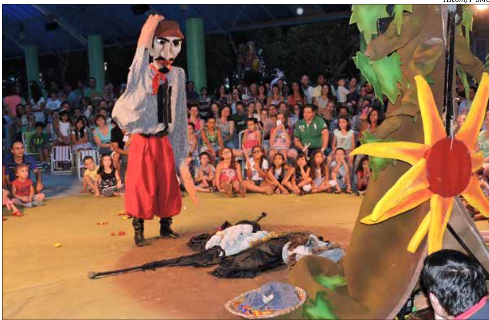
Espectáculo atraiu muita gente, especialmente crianças