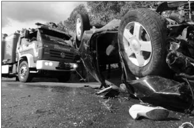
Acidente aconteceu no dia 11 de janeiro, na BR-282, em Linha Aparecida