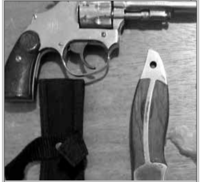
O revólver, a faca e a droga foram apreendidos