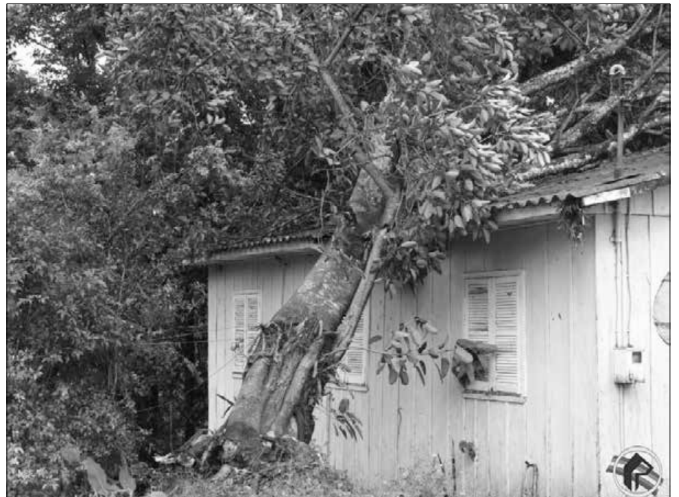
Casas foram atingidas pela queda de árvores causada pelo vento

Segundo os Bombeiros, foram várias deslocamentos para atender quedas de árvores e destelhamentos de casas. No centro, uma pessoa ficou presa no elevador de um edifício e foi socorrida pela guarnição. De acordo com a Celesc, quedas de