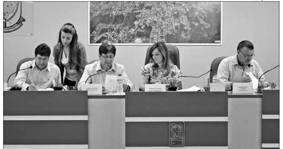
Sessão foi a primeira sob a presidência da nova Mesa Diretora