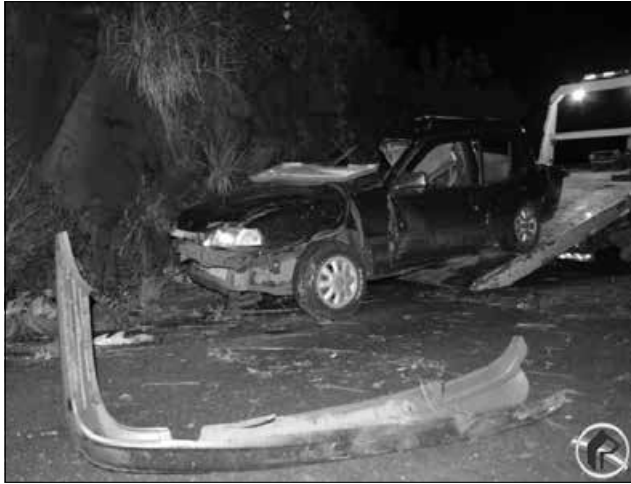
Com a batida contra o caminhão, Monza ficou totalmente destruído

ribanceira. Testemunhas contaram que o piloto da moto perdeu o controle do veículo após tentar acertar o capacete. Desgovernada, a moto acabou caindo em uma ribanceira. Uma ambulância passava pelo local no momen-