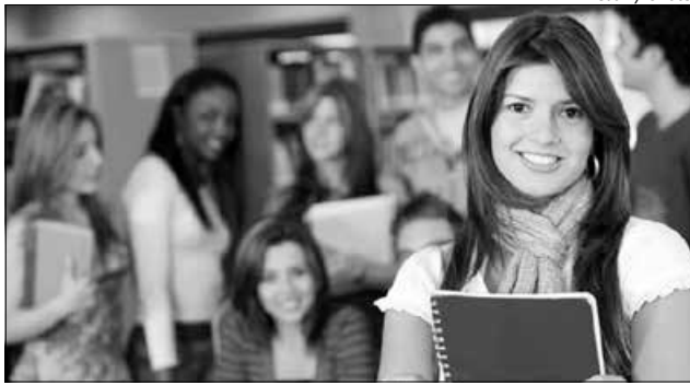
Desde que aderiu ao programa federal em 2007, é a primeira vez que a instituição concederá bolsas parciais, com 50% de gratuidade

Para tentar uma bolsa integral, o interessado deve ainda comprovar renda familiar bruta por pessoa de até um salário mínimo e meio. Para o candidato a uma bolsa parcial de 50% de gratuidade, a exigência é renda familiar bruta mensal de até três salários mínimos por pes-