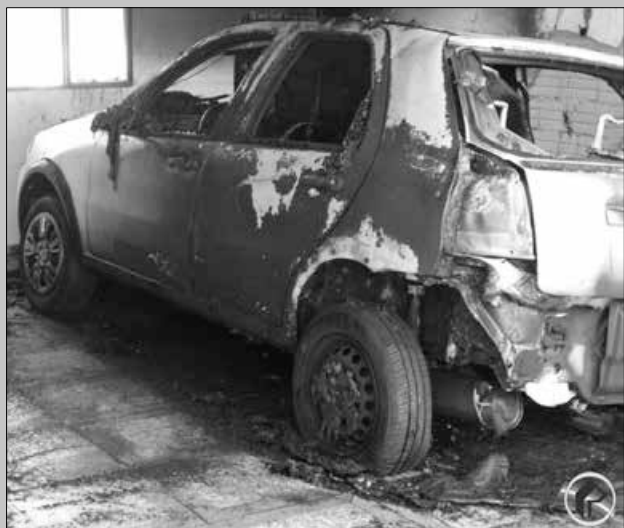
Carro pegou fogo dentro da garagem da residência