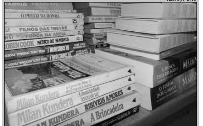
A iniciativa tem o propósito de incentivar as pessoas a se desapegarem de alguns livros, os quais já tenham sido lidos