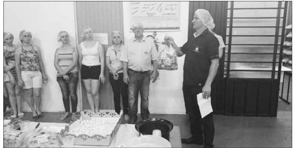
Casa da Cuca, de Iporã do Oeste, que recebeu recentemente a visita de acadêmicos de Administração da Fai Faculdades, de Itapiranga, foi uma das 50 empresas selecionadas

Das 50 empresas, oito são de software, sete de moda, 11 do setor metal-mecânico, 12 de alimentos, quatro de tecnologia, três de moda e acessórios, duas de móveis e decoração, uma de cosméticos e duas de revestimentos. Todas as regiões do Estado possuem pelo menos uma representante entre as se-