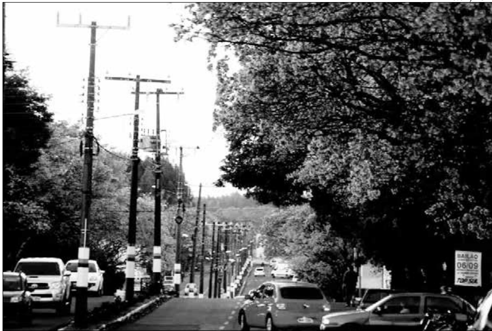
Salgado Filho já recebeu serviços de arborização, tapa-buracos e melhorias na sinalização de trânsito

Conforme o responsável pelo departamento, Alcino Ecker, no final do ano foram concluídas as obras na Avenida Getúlio Vargas, um trabalho que padroniza, promove a troca de todos os componentes e a instalação em cada poste de um comando individual. "Além de melhorar a iluminação, oferece mais segurança, diminui serviços de manutenção e embele-