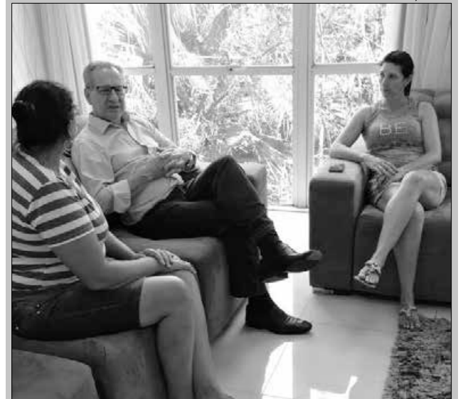
Diretoria da Associação destacou as obras feitas pela administração no bairro