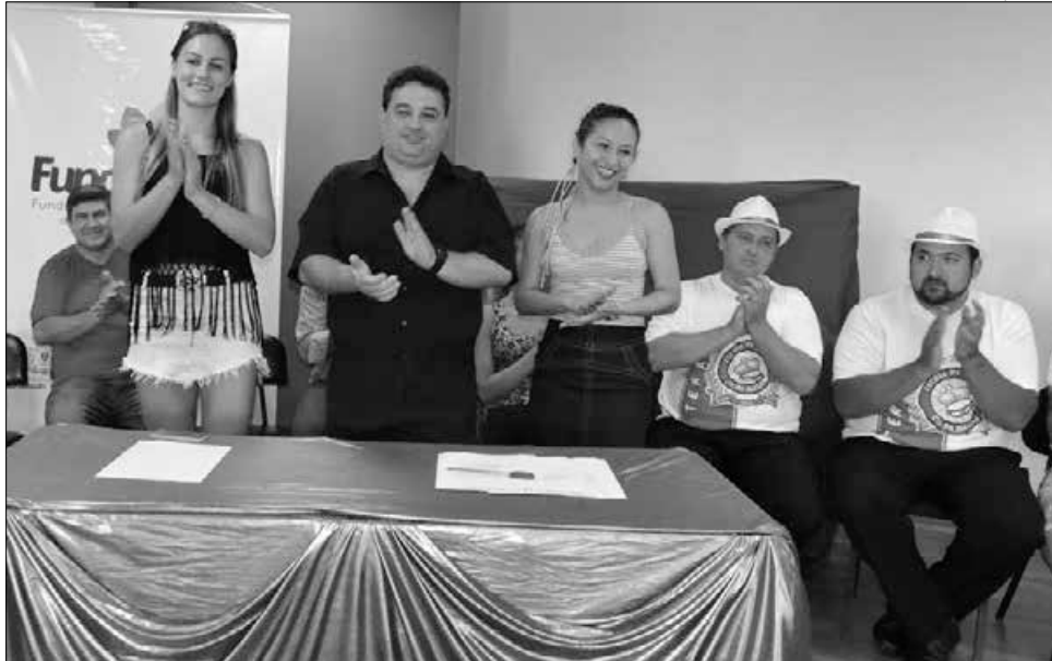
Fundação de Cultura e representantes de blocos participaram do lançamento do Carnaval 2015

Neste ano, o Carnaval será realizado nos dias 14, 16 e 17 de fevereiro e a novidade é a participação de duas escolas de samba e alteração no percurso que terá início na Rua La Salle. Não haverá sistema de disputa entre os blocos participantes. Participaram