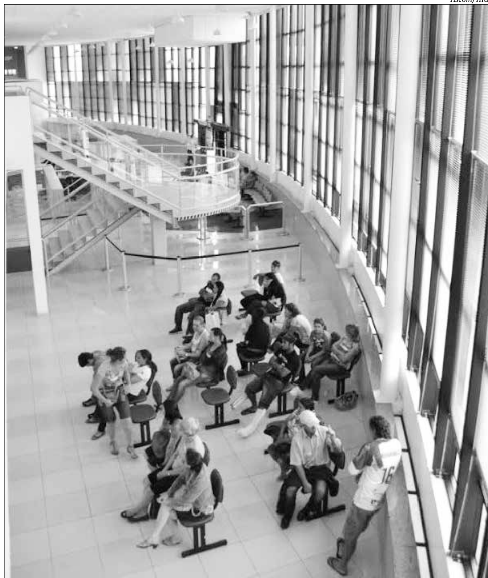
Com amplo espaço, Hospital atende 100% pelo SUS com qualidade

O Hospital Regional Terezinha Gaio Basso faz parte de um pequeno grupo de hospitais certificados no Brasil. A instituição possui dois