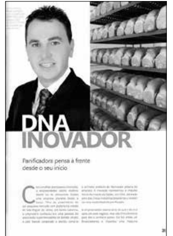
Empresa de Paraíso foi destaque na edição da Revista do Sebrae

Pelo fato de a empresa apresentar um crescimento médio de 30% ao ano, o Sebrae SC convidou Meotti, em 2011, para participar do Programa Agente Local de Inovação. Com isso, o resultado da empresa foi de um incremento de 40% nas vendas em 2012, 47% em 2013, diminuição de 10% nas perdas, novas embalagens e aumento da qualidade.