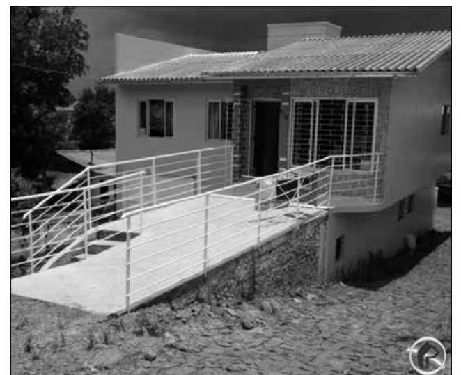
Entidade já está atendendo em nova estrutura

Rozélia avalia de forma positiva o trabalho da casa de apoio no ano passado. Conforme ela, o local recebeu mais de 500 pessoas no ano passado, que permaneceram durante a noite. Também houve um grande número de familiares que apenas passaram o dia na estrutura.