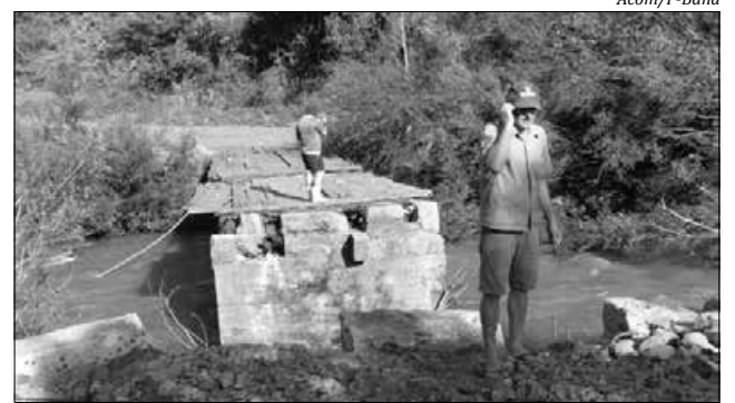
Ponte foi interditada devido às chuvas

ra foram causados pela chuva e não há como fazer a travessia neste momento. Uma equipe da prefeitura já trabalha para restabelecer o tráfego no local. A administração pediu a compreensão dos moradores e disse que deve consertar a ponte nos próximos dias.