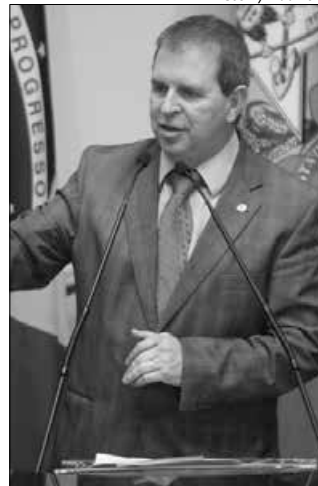
Deputado federal Maurício Eskudlark

O novo plano de aviação regional anunciado pelo governo federal tem o objetivo de fortalecer e ampliar a malha de aeroportos regionais, o Governo Federal vai investir R$ 7,3 bilhões em 270 aeroportos. As medidas pretendem aperfeiçoar a qualidade do serviço prestado ao passageiro, agregar novos aeroportos à rede de transporte aéreo regular e aumentar o número de rotas operadas pelas empresas aéreas. De acordo com informações, a região Sul terá investimentos de quase R$ 1 bilhão em 43 aeroportos, incluindo o de São Miguel do Oeste. O programa visa ampliar o