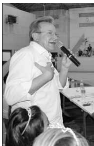
Deputado federal Celso Maldaner destacou a importância da Extenoleite em tempos de crise do setor leiteiro