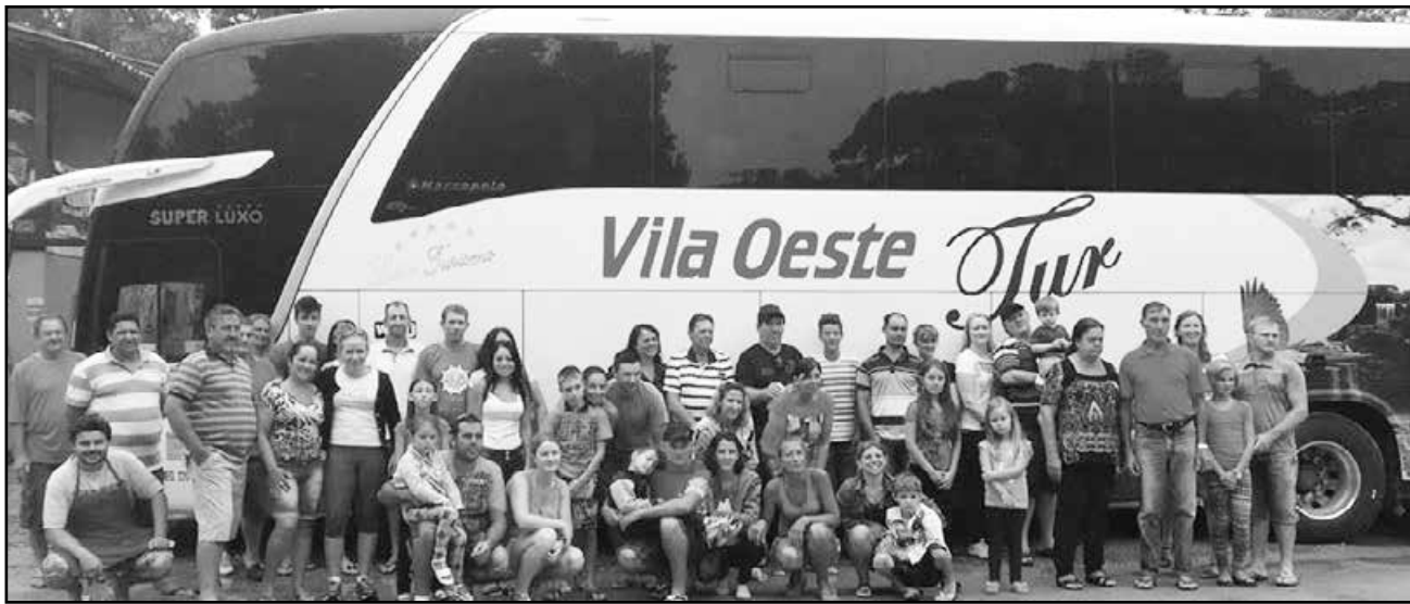
A temporada chegou e a Vila Oeste Tur realizou com sucesso sua primeira viagem a Itapoá SC