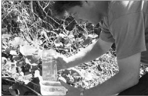
O município já registrou 14 focos do mosquito apenas nos primeiros sete dias de 2015