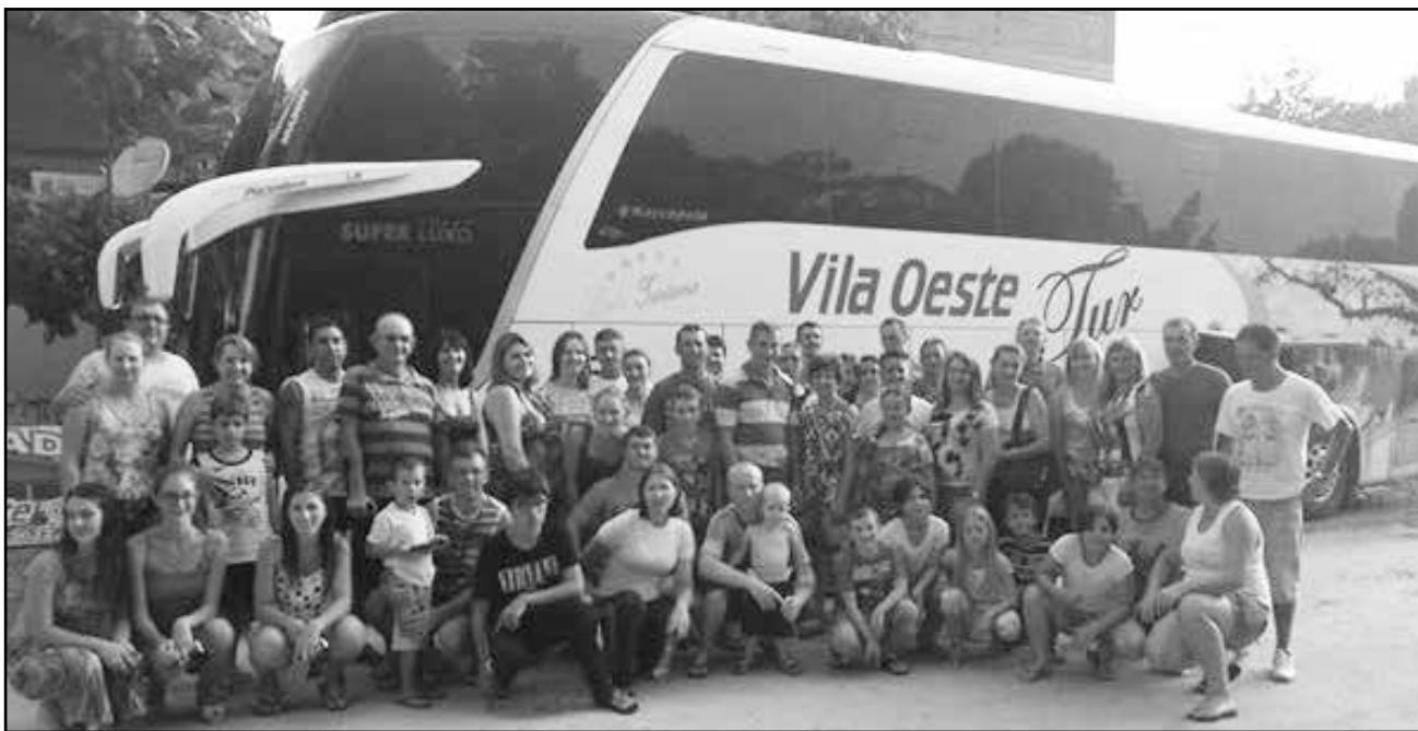
Segunda viagem para Itapoá SC realizada com sucesso. A Vila Oeste Tur e Pousada Vila Oeste agradecem a confiança