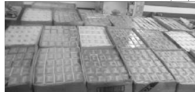
Cigarros foram encontrados em um galpão no interior do município