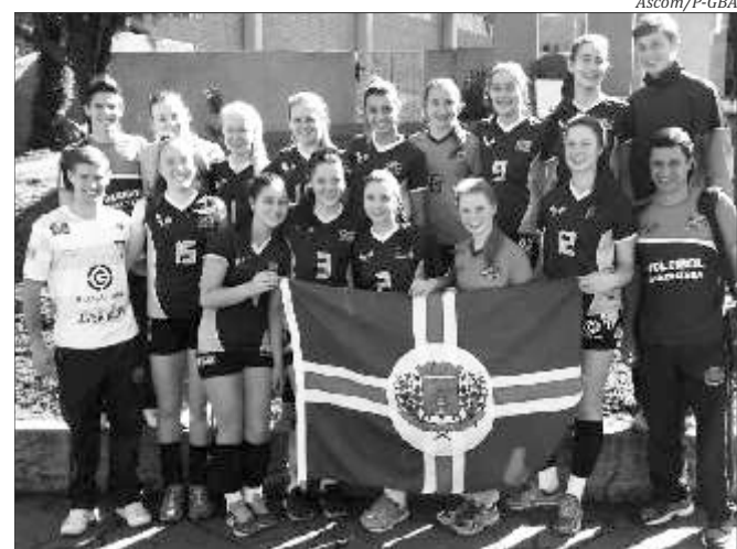
Apesar da derrota na semifinal, as meninas de Guaraciaba garantiram o quarto lugar geral nos jogos