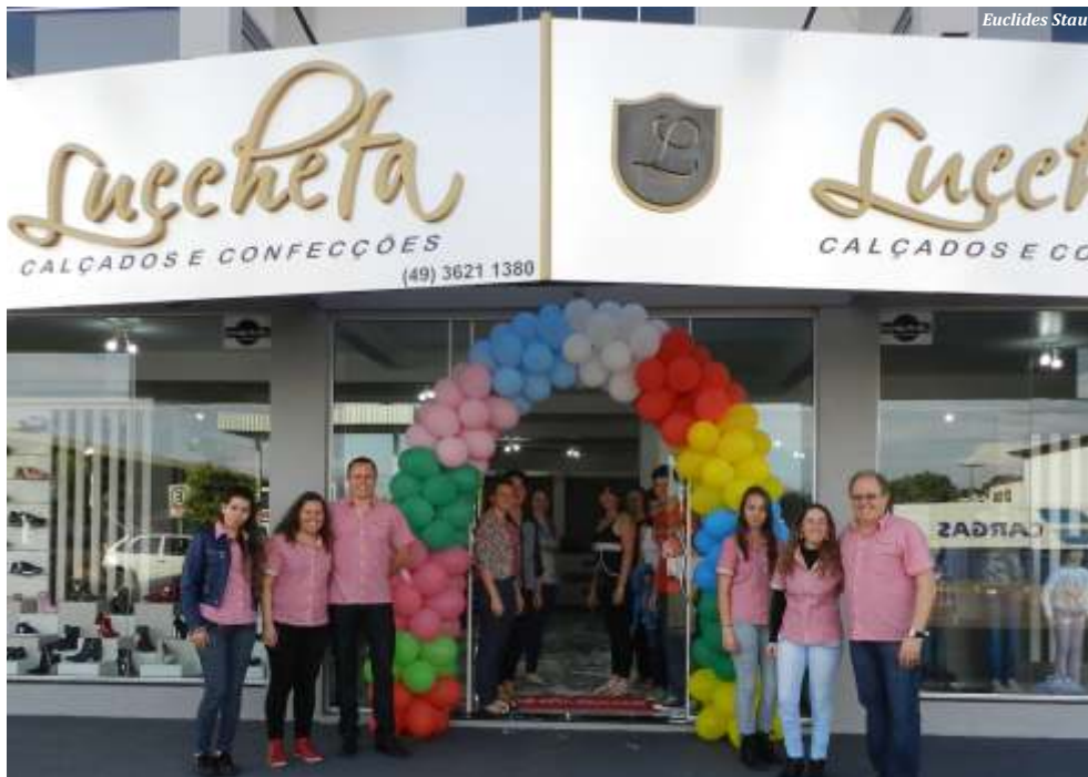
Loja inaugurou no dia 1º, na Rua Tiradentes, em frente à garagem da Reunidas

produtos e as facilidades de pagamento", convida o empresário. Para informações, a loja atende pelos telefones 3621-1380 e 99888740.