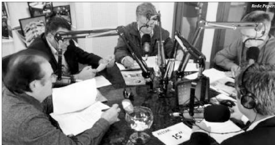
A emissora iniciou no último sábado o primeiro debate da

No último sábado, a apresentação de propostas marcou primeiro debate com candidatos a deputado estadual. Os projetos para incentivar a agricul-