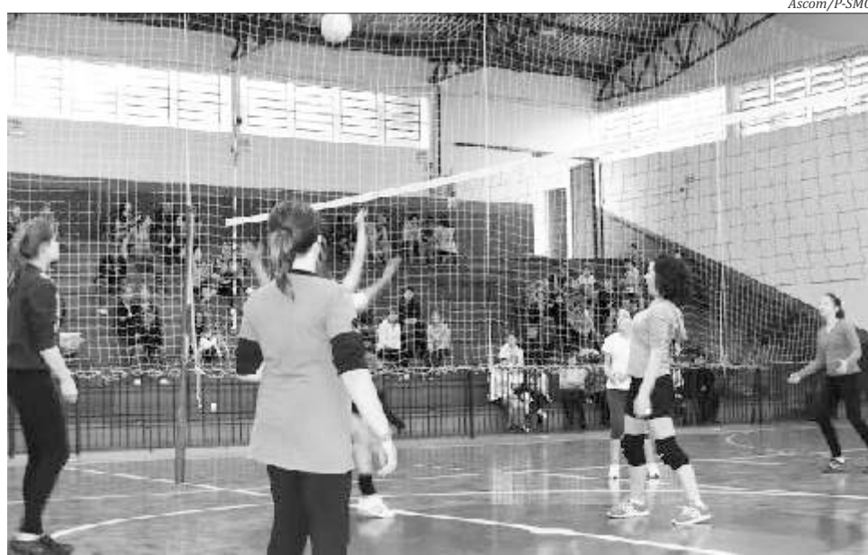
Capacitação visa formar educadores para atuar no projeto que forma atletas

Todos os profissionais da área de Educação Física estão convidados a participar do evento no salão nobre da prefeitura, das 9h às 11h30 e das 13h30 e às 17h. Segundo Fernandes, o objetivo é formar educadores para atuar no projeto, que já está em andamento no município.