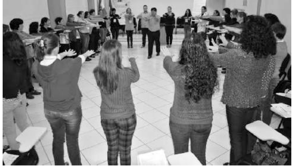
Turma da Cooper A1, durante atividades do Programa Mulheres Cooperativistas