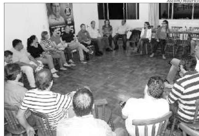
Deputado reuniu lideranças que apoiam sua candidatura à reeleição