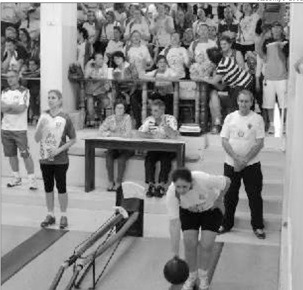
Jogos foram disputados no Clube Montese no final de semana