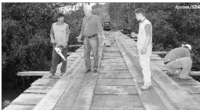
Obra vistoriada pelo secretário está em fase final de conclusão

Segundo a construtora, a expectativa é de que o trabalho esteja concluído na semana que vem. No entanto, a ponte só poderá voltar a ser liberada ao tráfego após o Corpo de Bombeiros assinar o laudo de liberação.