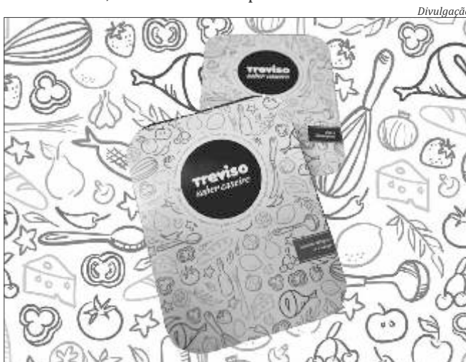
Nova marca torna os produtos mais atrativos para o consumidor

com jeitinho caseiro e o delicioso sabor, continuam os mesmos", garante a sócia proprietária do Treviso.