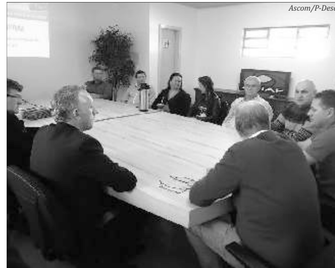
Comitiva de Descanso foi buscar informações na cidade de Fraiburgo