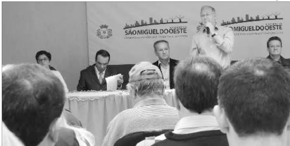
Reunião contou com a presença de autoridades e representantes de entidades

O prefeito reiterou a importância de discutir e definir, em conjunto, ações para o município. "Esse momento reforça nossa preocupação em debater com a sociedade iniciativas que traçam um novo rumo, não ape-