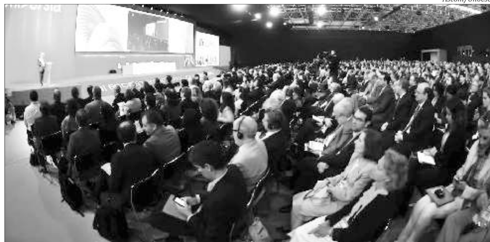
Unoesc se fez representar no encontro internacional realizado no Rio de Janeiro

como instrumento decisivo para o desenvolvimento econômico e social dos países.