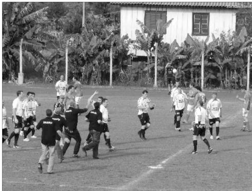
Expulsão de jogador gerou confusão no campo que culminou com o abandono da partida pelo Esporte Clube Itajubá

Esportes, Rui Mendonça, a comissão julgadora da Liga de Maravilha vai analisar o relatório da arbitragem e não está descartada uma punição para a equipe do Itajubá pelo abandono da partida.