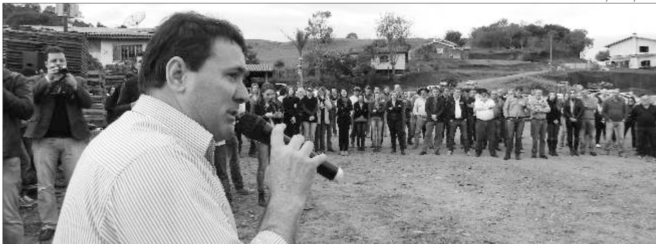
Prefeito Roque Meneghini destacou a obra como de fundamental importância para o desenvolvimento do município