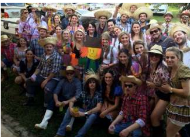
Eles e elas que participaram da 'festa julina' de sábado

Não sou bom em matemática, mas tenho certeza que a minha vida não é da sua conta.