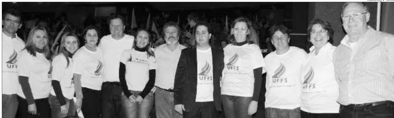
Lideranças do Extremo-oeste estiveram presentes ao encontro em Chapecó