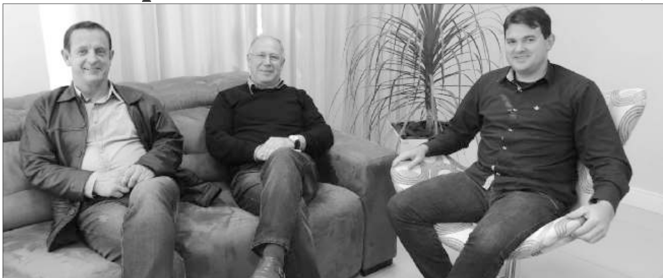
Encontro entre os dois prefeitos e o vereador de Descanso aconteceu no gabinete da prefeitura de São Miguel do Oeste