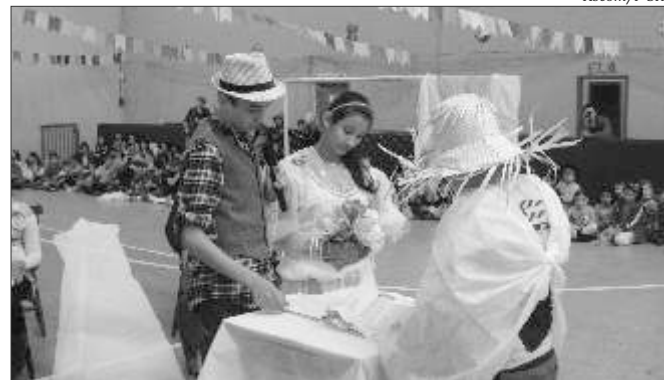
O tradicional casamento caipira foi uma das atrações da festa

São João no dia 1º de julho. À tarde houve apresentações de danças com os alunos do ensino fundamental e da educação infantil, enquanto que alunos do serviço de convivência apresentaram o casamento caipira.