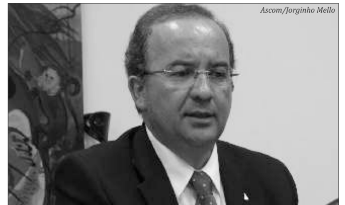
Deputado federal Jorginho Mello

tos Humanos da Presidência da República, desde o fim de 2012 o deputado já beneficiou 100 Conselhos no Estado com os chamados kits que dão autonomia ao trabalho dos conselheiros, que não tem hora marcada para acontecer.