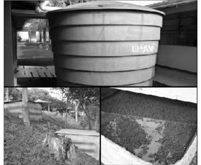
Foram instaladas duas cisternas que captam uma quantidade de 30m 3 de água