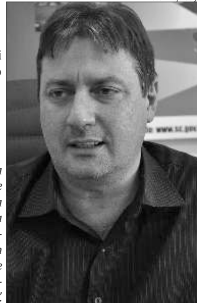
Volmir Giumbelli Secretário de Estado

"Entramos agora no período eleitoral e a legislação limita algumas ações nesta época. Todos os processos ocorreram como o esperado e dentro do prazo estabelecido".