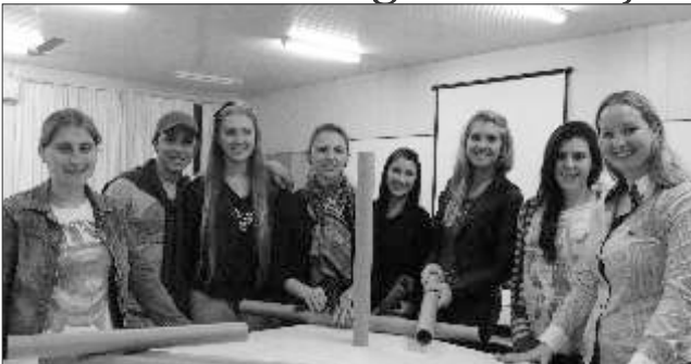
Estudantes de Design de São Miguel do Oeste participaram da Oficina de Mobiliário Urbano e Mockup

Durante a Semana Acadêmica, também foram coletados cobertores para serem doados a entidades carentes. A arrecadação teve o objetivo de promover atitudes morais, como a ética, e o comprometimento social dos alunos.