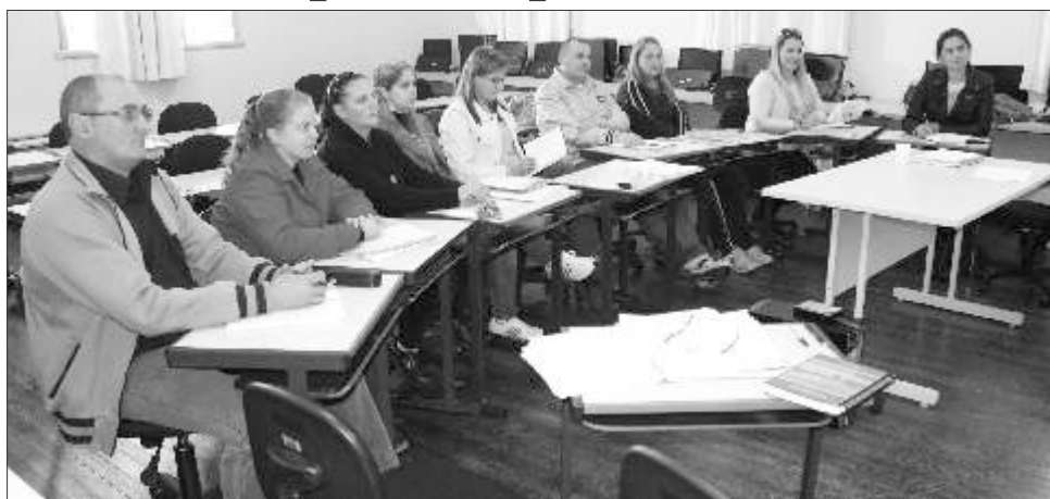
Reunião realizada com professores orientadores do Programa Mais Educação, na sede da SDR Itapiranga — Na foto, representantes das seis escolas que aderiram ao programa — Itapiranga — 30/06/2014.