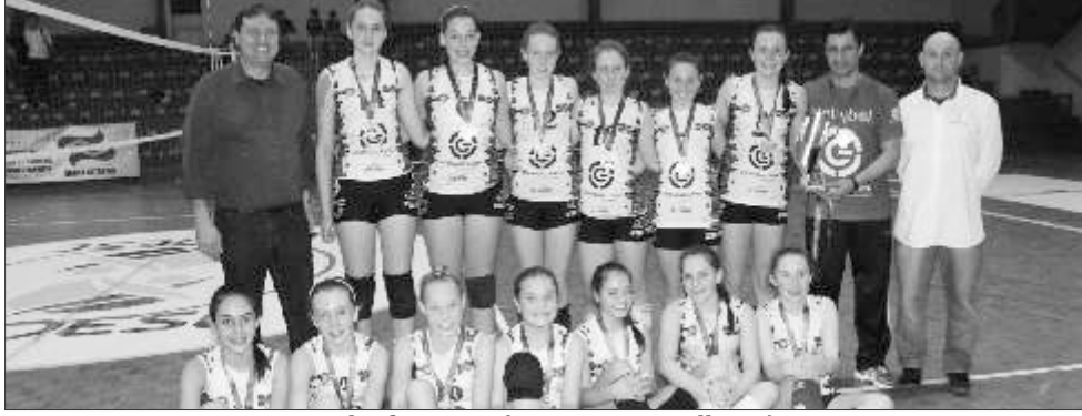
Volei feminino (EEB Sara Castelhana)