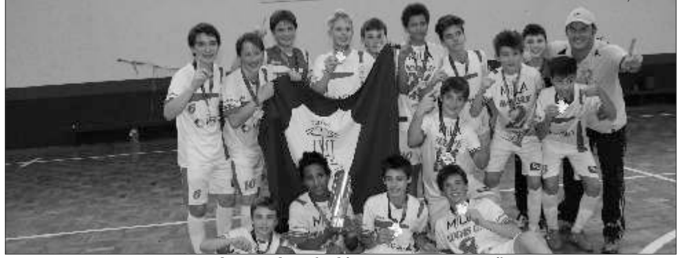
Futsal masculino (Colégio Jesus Maria José)

São Miguel do Oeste Foram definidos os representantes da região Oeste para a etapa estadual dos Jogos Escolares de Santa Catarina (Jesc) 12 a 14 anos. A fase regional, realizada em São Miguel do Oeste, encerrou nesta segunda-feira, 16. Os Jesc iniciaram na sexta-feira, 13, e reuniu cerca de 1.000 alunos/atletas.