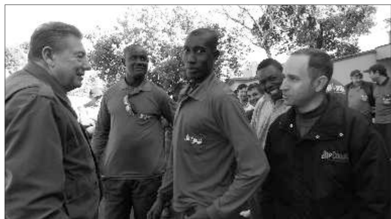
Estrangeiros já estão adaptados ao perfil da empresa