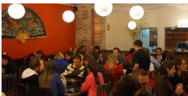
Restaurante lotou na noite de inauguração