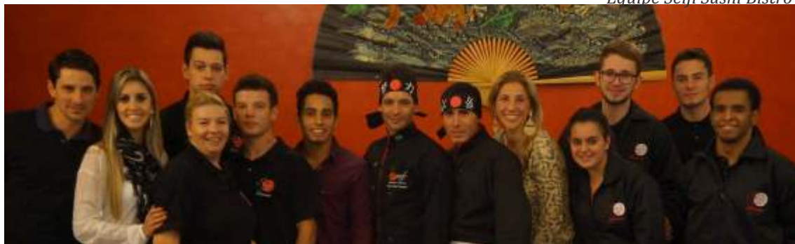
Equipe Seiji Sushi Bistrô