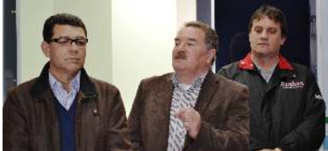
Menegazzo: "saúde deve receber melhorias constantes"