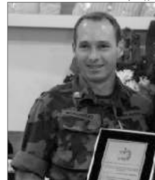
Ten Everton Carlos Roncaglio Cmt Pl Ambiental

“A Polícia Militar Ambiental já desenvolve intenso trabalho de orientação e educação ambiental, sempre com o objetivo de evitar ou minimizar danos ao meio ambiente, já que, nossa maior preocupação é com a preservação do meio ambiente”.