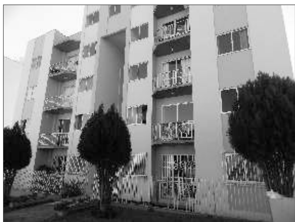
Edifício San Remo - primeiro empreendimento