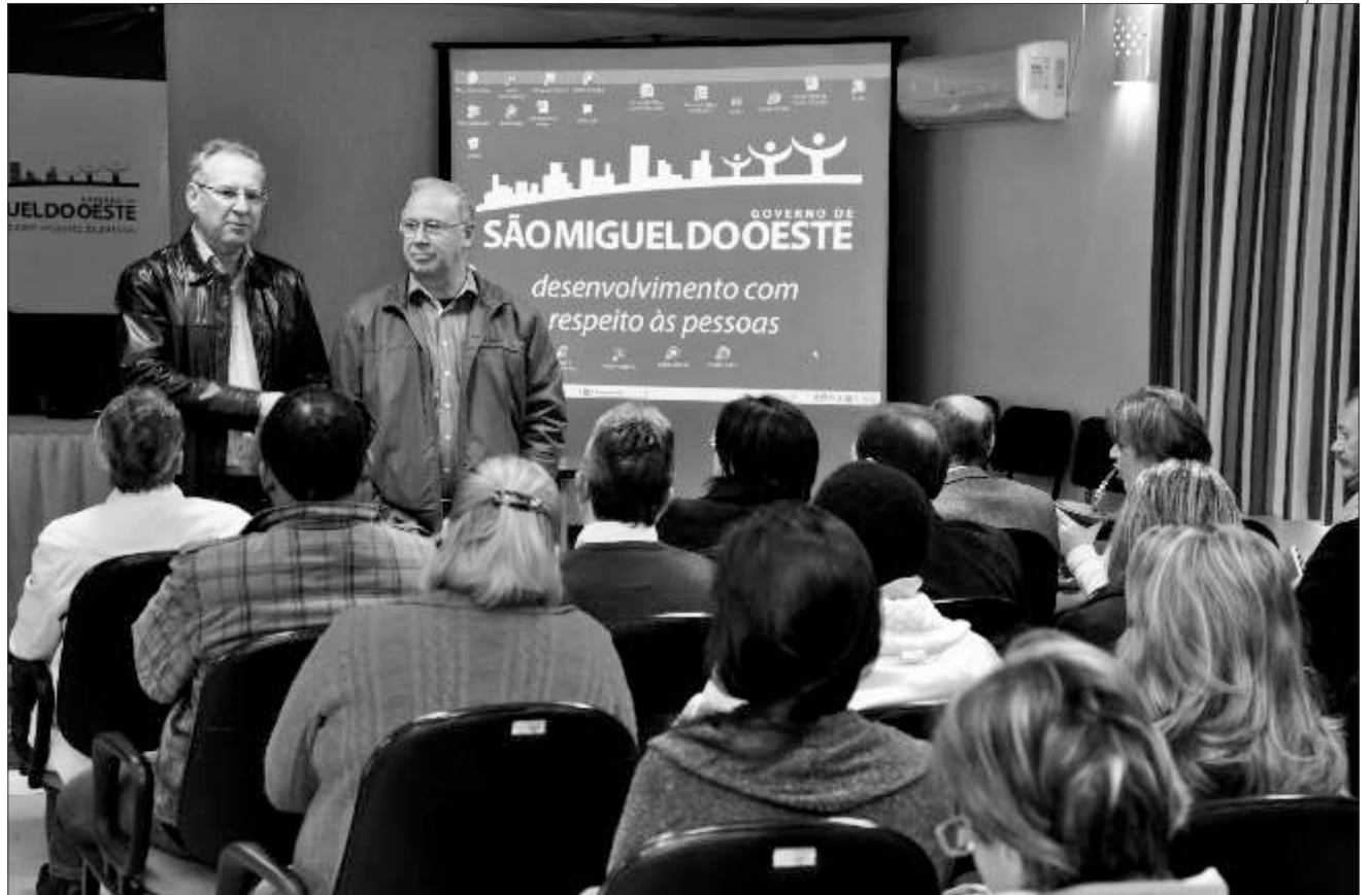
Balanco do 1º quadrimestre é apresentado no Salão de Atos da Prefeitura

São Miguel do Oeste A Administração Municipal, por intermédio da Secretaria de Fazenda, realizou na manhã de sexta-feira, 30, audiência pública para a apresentação dos dados do 1º quadrimestre (janeiro, fevereiro,