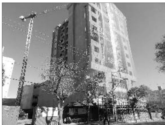
Tower Center - empreendimento atual