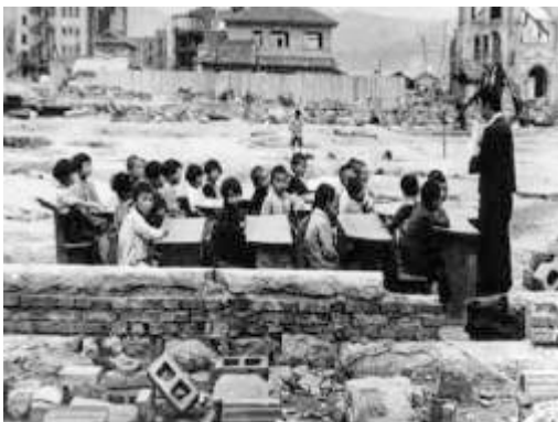
Japão: A foto é de 1945 em Hiroshima. Depois da explosão da bomba atômica.

Os 10% do PIB e os royalties do pré-sal serão a danação de vocês. Porque, quando essa enxurrada de dinheiro começar a entrar e nossa educação continuar um desastre, até os pais de alunos de escola pública vão entender o que hoje só os estudiosos da área sabem: que não há relação entre valor investido em educação — entre eles o salário de professor — e o aprendizado dos alunos. Ai esses pais, e a mídia, vão finalmente querer entrar nas escolas para entender como é possível investirmos tanto e colhermos tão pouco. Vão descobrir que a escola brasileira é uma farsa, um depósito de crianças. Verão a quantidade abismal de professores que faltam ao trabalho, que não prescrevem nem corrigem dever de casa, que passam o tempo de aula navegando em rede social ou, no melhor dos casos, enchendo o quadro-negro de conteúdo para aluno copiar, como se isso fosse aula. E então, vocês serão cobrados. Quando isso acontecer, não esperem a ajuda dos atuais defensores de vocês, como políticos de esquerda, dirigentes de ONGs da área e alguns "intelectuais". Sei que em declarações públicas esse pessoal faz juras de amor a vocês. Mas, quando as luzes se apagam e as câmeras param de filmar, eles dizem cobras e lagartos. Então preparem-se para dar ao país o que esperamos de vocês: educação de qualidade para nossos filhos.