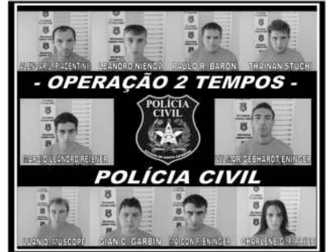
"Colabore com a Polícia Civil. Denuncie. Disque 181."

Policiais das DICs de Criciúma, Chapecó e São Miguel do Oeste também prestaram apoio durante a operação. Os envolvidos foram encaminhados para a Cadeia Pública de Maravilha, onde permanecerão à disposição da Justiça.