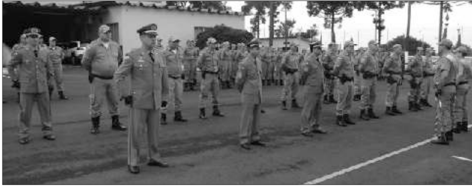
Autoridades civis e militares participaram da cerimônia que foi realizada na manhã de segunda-feira, 5