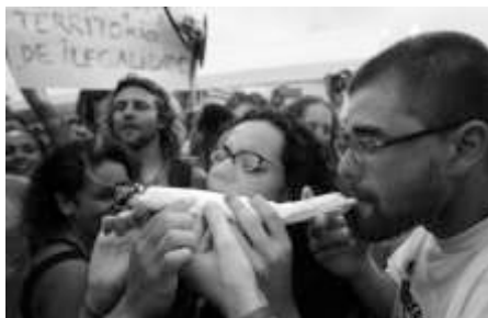
Foto: Os otários ignorantes fumando cocô de cavalo na certeza que é maconha

Na semana passada, tivemos a tradicional marcha da maconha. Por um lado pudemos observar a ignorância dos maconheiros e por outro a mediocridade dos líderes institucionais que norteiam este belo país. Os sociólogos e esquerdotapas das Universidades estavam lá, já os políticos se acovardaram e não ousaram opinar.