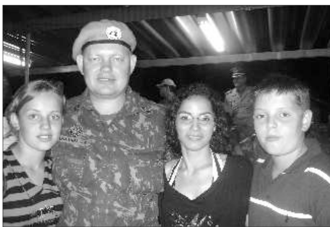
11 de fevereiro de 2011, retorno do Haiti.