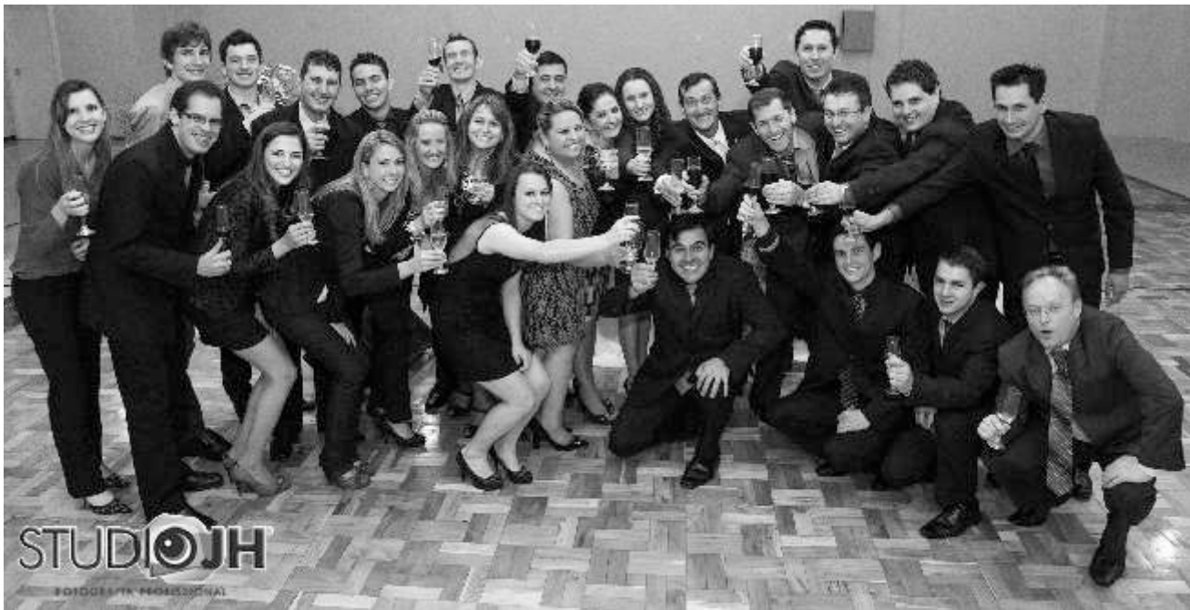
Formatura da Dale Carnegie Training, no dia 12 de abril no Clube Comercial-SMO