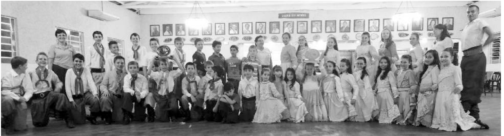
Invernada Artística Mirim, a qual se classificou em 2º lugar no XV Rodeio Crioulo e Artístico Nacional de Maravilha-SC.