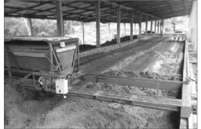
Sistema de compostagem

A empresa tem frota e maquinário para fazer a entrega e distribuição em sua lavoura. Ligue (49) 3634-1218 e fale com Sergio ou Nilva. "Faça um bom negócio, aumente sua produtividade e preserve o meio ambiente usando um bom fertilizante orgânico."