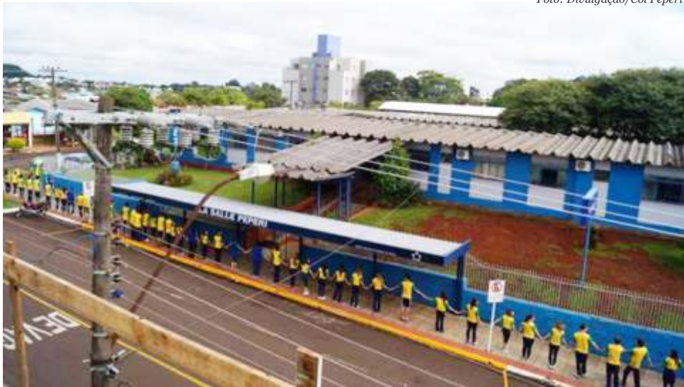
Alunos fizeram um abraço coletivo na escola

São Miguel do Oeste No dia 3 de março o Colégio La Salle Peperi completou 56 anos de presença em São Miguel do Oeste, as comemorações alusivas a data aconteceram na dependências do educandário.