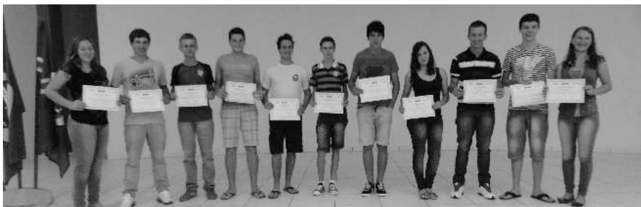
Montador e Reparador de Computadores

Guaraciaba A unidade do Senai de São Miguel do Oeste realizou na noite de segunda-feira, 17, no Centro de Múltiplo Uso em Guaraciaba, o encerramento de dois cursos realizados pelo