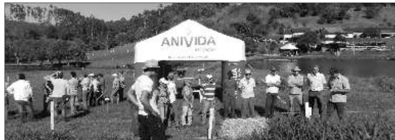
Autoridades prestigiaram o evento