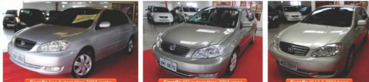
Corolla Seg Automática 2007, prata