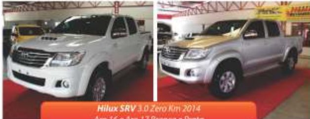
Hilux SRV 3.0 Zero Km 2014 Arco 16 e Arco 17 Branca e Prata

Toda linha Toyota Hilux zero km ou seminovo a pronta entrega