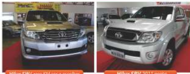
Hilux SW4 zero km cor a escolher