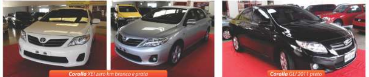
Corolla XE1 zero km branca e prata

Linha Toyota Corolla zero km e seminovo a pronta entrega