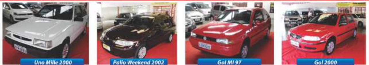
Uno Mille 2000

Compre seu carro barato à vista com ótimo desconto ou em 36 vezes SEM JUROS e SEM ENTRADA