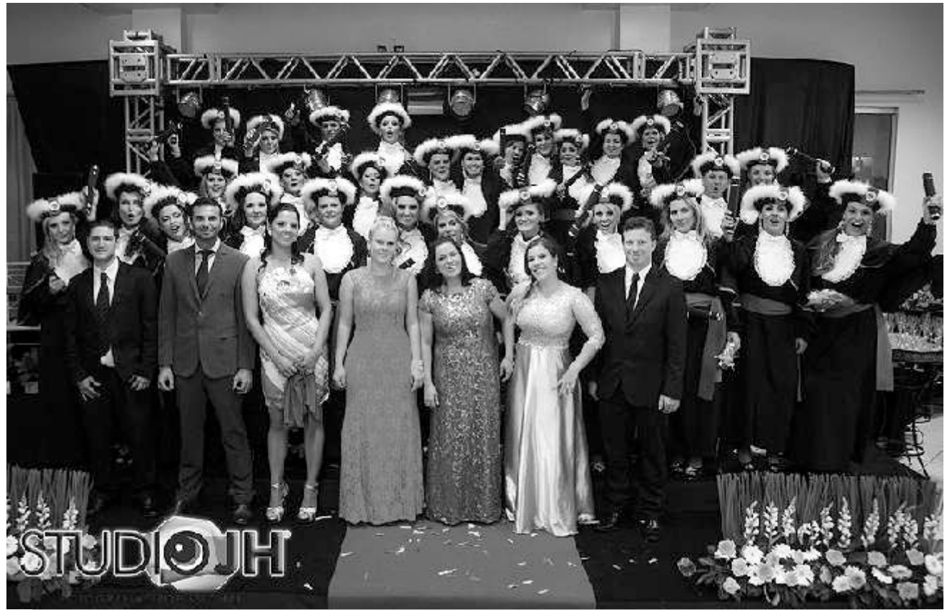
Formatura de Radiologia aconteceu no dia 21 de dezembro 2013, nas dependências do Restaurante Villa Grill . Parabéns à todos os formandos.