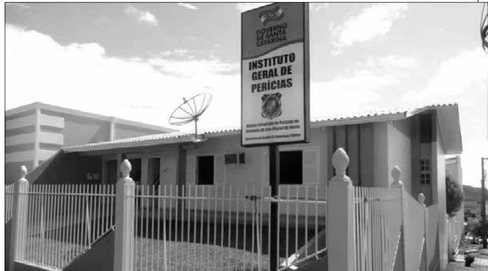
A nova estrutura do IGP fica na Rua Marquês do Herval, no Bairro São Jorge

De acordo com o responsável pelo Núcleo Integrado de Perícias de Fronteira da região de São