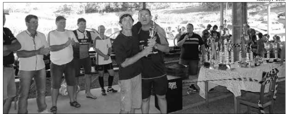
Após os jogos, cerimônia marcou a entrega dos prêmios aos campeões

Encerrou domingo, 07, a sétima edição do Campeonato Municipal de Futebol Suíço de Descanso. As finais foram realizadas na sede da Associação Bom Sucesso com um expressivo público. Na categoria, sub-17, a taça de campeão ficou com o Internacional de São Valentim, fiando o Gierck Esporte Clube Dorigon na 3ª colocação e o Esporte Clube Ajax em 2º lugar. Na