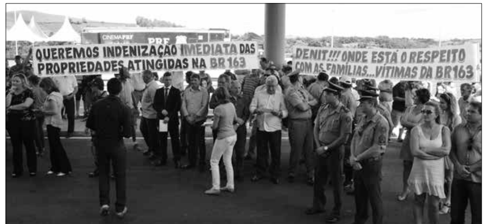
A inauguração serviu também para que atingidos pelas obras na BR-163 reivindicassem o pagamento de indenizações