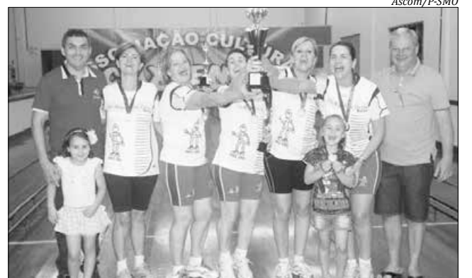
AB Celesc sagrou-se campeão no feminino com 3.429 pinos

culino, com 3.505 pinos, e AB Celesc, no feminino, com 3.429 pinos. Ainda no masculino, o segundo lugar ficou com o Montese B, com 3.470 pinos, e o terceiro com a Associação Caxiense C, com 3.358 pinos. No feminino, Associação Caxiense, com 3.414 pinos, ficou na segunda colocação e no terceiro lugar o Montese A, com 3.335 pinos.