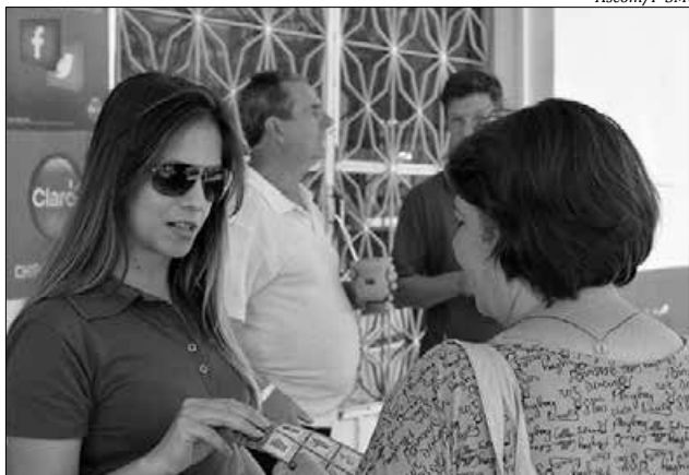
No sábado, a Secretaria da Saúde desenvolveu atividades de conscientização junto à população

No último sábado, 06, a Secretaria de Saúde de São Miguel do Oeste realizou atividades especiais no Dia D de Combate à Dengue, no