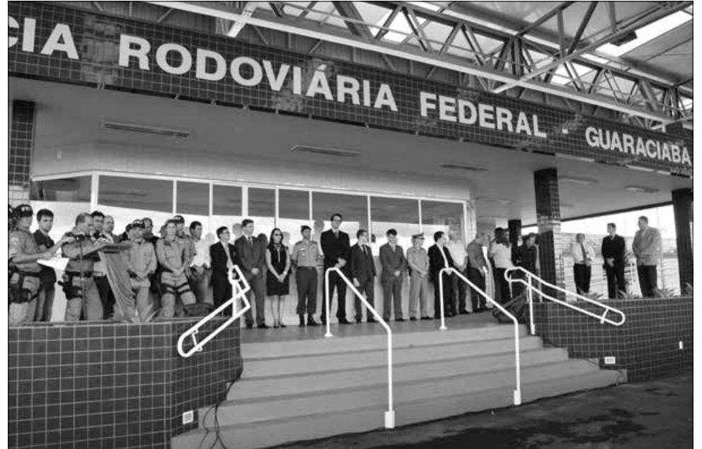
Autoridades civis e militares prestigiaram o ato inaugural na tarde de ontem