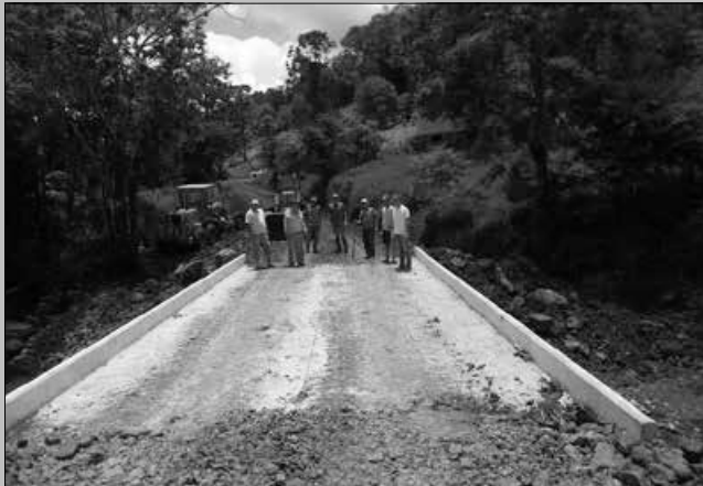
Participaram do ato oficial de inauguração autoridades locais e regionais e coordenadores regionais da Defesa Civil