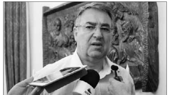
Anúncio foi feito pelo governador Raimundo Colombo

A Agência Reguladora de Serviços de Saneamento