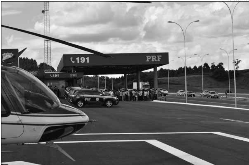
Posto poderá contar com serviço de helicóptero quando houver necessidade