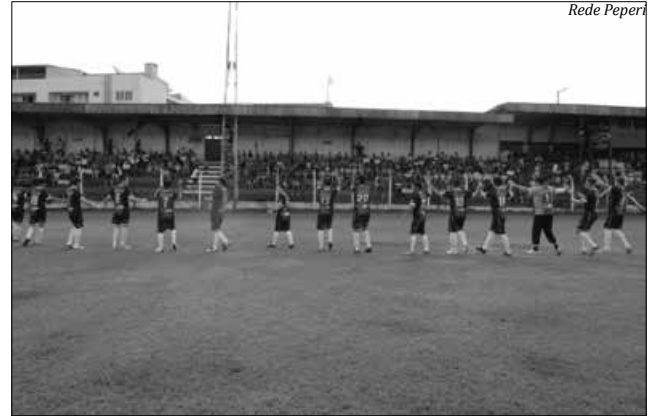
Cerca de mil pessoas acompanharam a partida entre Serrano e Jardim Peperi

Cerca de mil pessoas acompanharam a partida. O Serrano marcou com Luizinho e duas vezes com Farias. O Jardim Peperi descontou com Roniel e Zanella, com gol contra. Para conquistar a taça, o Serrano precisa apenas de um empate. A grande final está marcada para acontecer no próximo domingo, 14, no estádio Padre Aurélio Canzi.