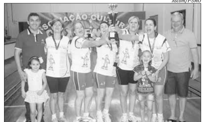
AB Celesc sagrou-se campeão no feminino com 3.429 pinos

culino, com 3.505 pinos, e AB Celesc, no feminino, com 3.429 pinos. Ainda no masculino, o segundo lugar ficou com o Montese B, com 3.470 pinos, e o terceiro com a Associação Caxiense C, com 3.358 pinos. No feminino, Associação Caxiense, com 3.414 pinos, ficou na segunda colocação e no terceiro lugar o Montese A, com 3.335 pinos.