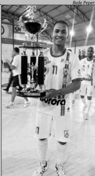
Acema Maravilha venceu a Asme nos pênaltis e conquistou a Copa Regional de Futsal