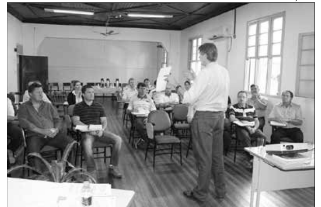
Secretaria Regional de Itapiranga foi a primeira do Estado a manter um encontro para tratar do assunto

O programa prevê o rastreamento de todos os animais da região e abate sanitário dos animais acometidos por tuberculose ou brucelose, além de evitar a entrada de animais contaminados vindos de outros municípios. "Trocando ideias com os prefeitos e técnicos da região, ficou claro que tornar a área uma zona livre é possível. Nessa região, a presença animal é muito forte e é a base da economia. Existe um grande espaço para expandir ainda mais a produção, mas isso só se viabiliza se nós controlarmos essas duas doenças", afirmou o secretário Airton Spies.