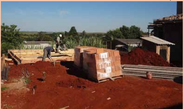
As obras já estão em andamento e devem ser concluídas em breve