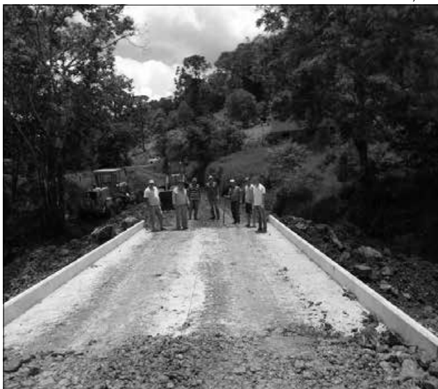
Ponte já está liberada para travessia com maior segurança