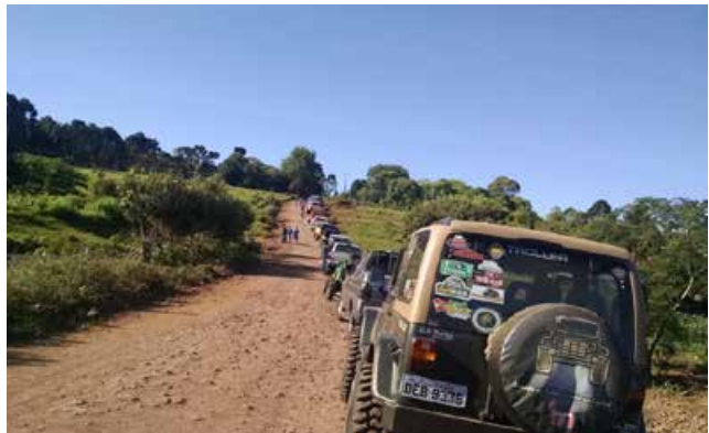
Em torno de 30 veículos (entre jeeps, gaiolas e camionetes) participaram da trilha

*As fotos podem ser conferidas no site da Rede Peperi (peperi.com.br).