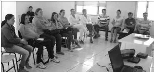
Empresa responsável pelo sistema explanaram às agentes o funcionamento do projeto