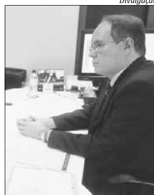
Promotor de justiça Jonathan Winter

No entender do MP, serviços de segurança pública não podem ser custeados com taxas, mas sim com os recursos dos impostos arrecadados pelos governos. Além disso, de acordo com a ação, a competência tributária para a criação de taxa sobre atos de segurança pública é do Estado e não da prefeitura. A ação tramita no Tribunal de Justiça ainda