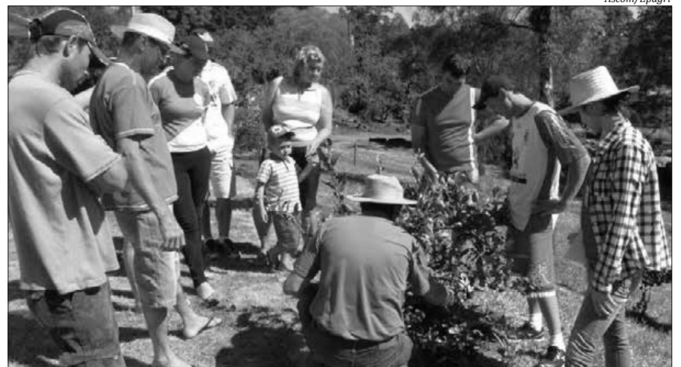
Participantes puderam observar práticas e manejos que devem ser realizados num pomar doméstico

Na prática, os participantes puderam observar práticas e manejos que de-