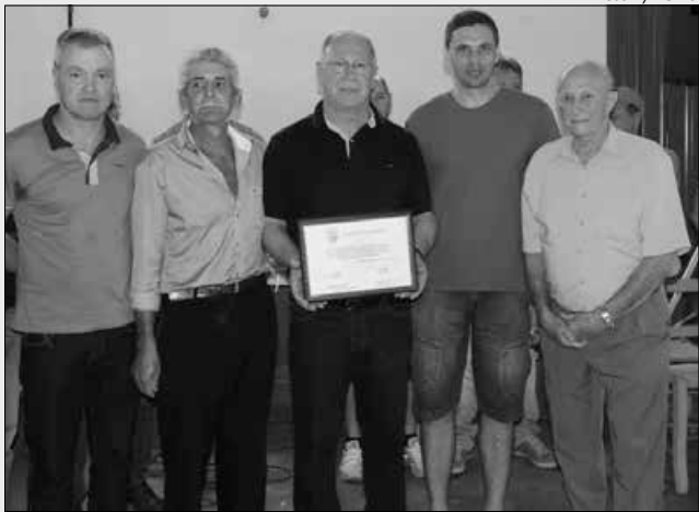
Prefeito João Valar foi agraciado com o título de "Amigo da Comunidade"