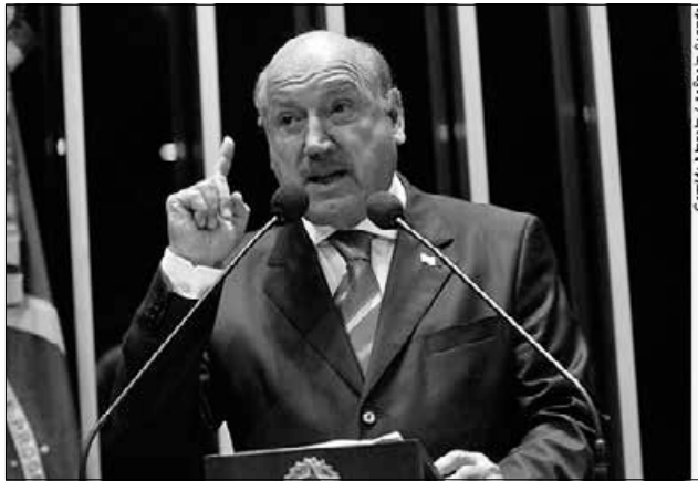
Senador Luiz Henrique da Silveira

Como exemplo dos graves erros dos institutos de pesquisas em todo o País, o senador voltou a mencionar as últimas eleições municipais de Joinville. Com