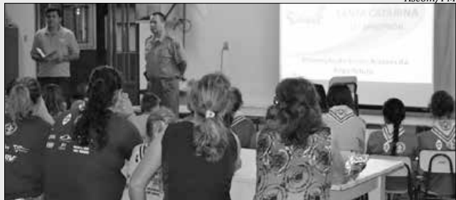
Moradores receberam orientações sobre segurança por parte da PM