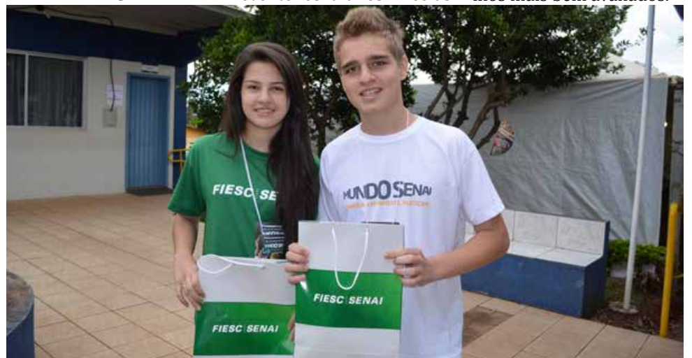
Alunos chamaram atenção com o projeto de uma janela que abre por comando de voz e até pelo celular

melhor média de notas. Na sexta-feira, 21, a direção do Senai premiou os trabalhos mais bem avaliados.