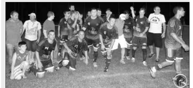
Campeões comemoraram o título de 2014