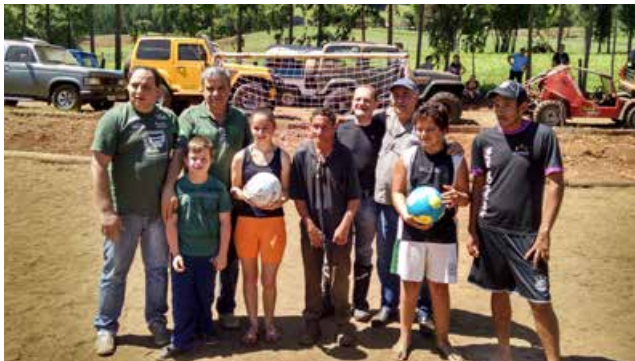
Boa ação: O grupo entregou redes de futebol e duas bolas para os ribeirinhos carentes da Linha Peperi, interior de São José do Cedro