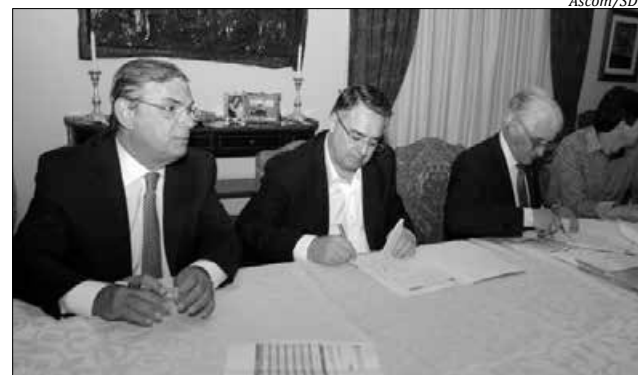
Convênios foram assinados na manhã de ontem, terça-feira, em Florianópolis