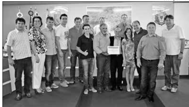
Câmara homenageou com moção de aplauso a equipe da Rede Peperi