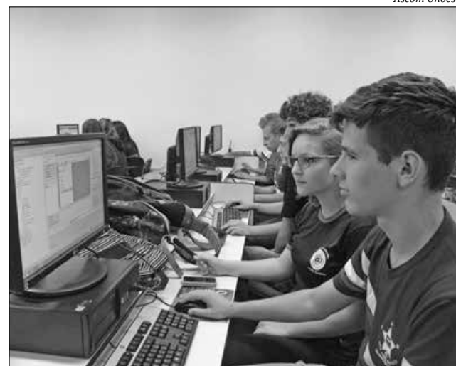
Estudantes têm aulas de informática e computação nos laboratórios da Unoesc São Miguel do Oeste