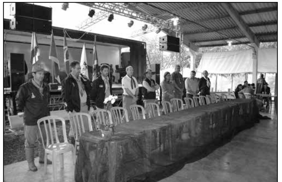
Tradicionalistas participaram do evento, que reuniu milhares de pessoas