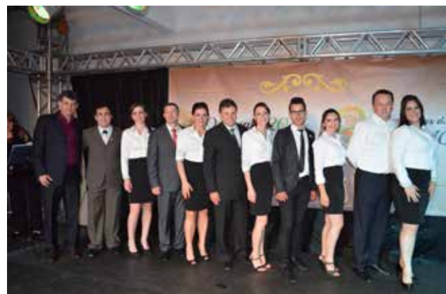
Atual diretoria e equipe que comanda a Acismo