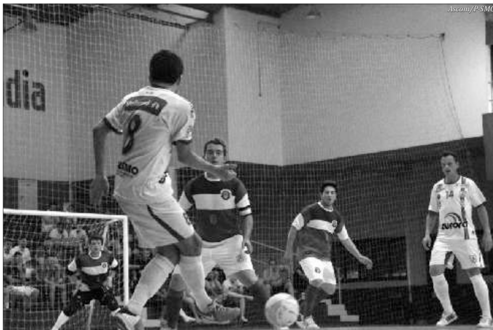
Representado pela Asme, São Miguel do Oeste ganhou o ouro nos pênaltis