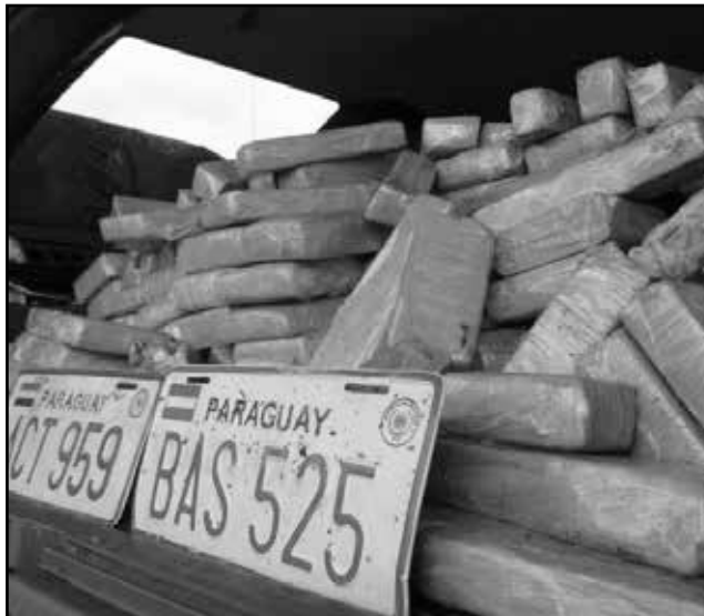
Maconha apreendida estava em fundos falsos nos dois veículos

A ação desarticulou uma das maiores quadrilhas da região. Segundo a polícia, os