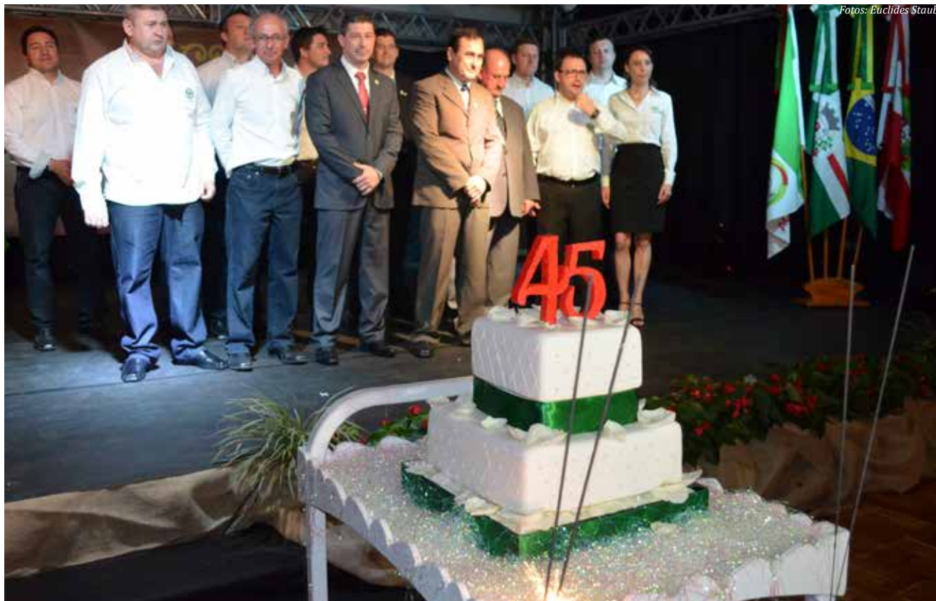
Bolo marcou a comemoração dos 45 anos da Acismo