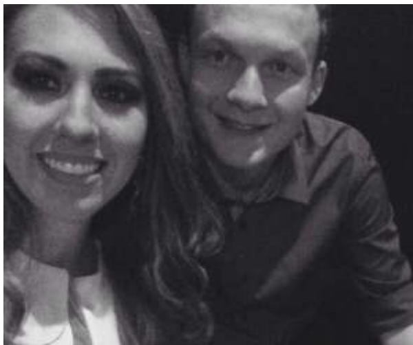
Os noivos casarão no elegante Resort Ponta dos Ganchos

Em alguns casos, conforme os comentários, alguns agem em cumplicidade com colegas. E tem gente que sabe. E tem provas. E está com vontade de contar.