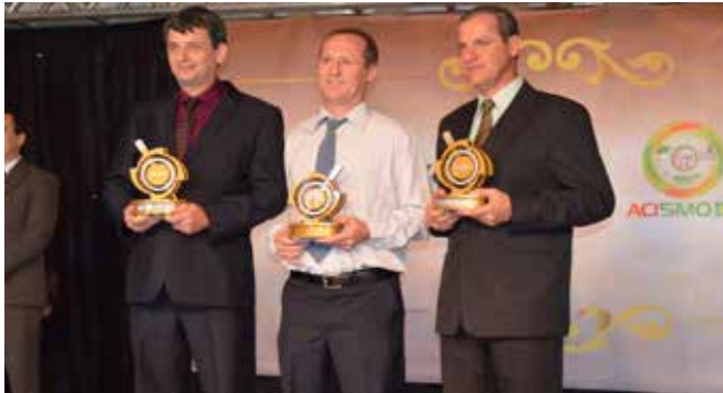
Vencedores na categoria indústria de pequeno, médio e grande porte