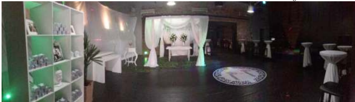
O glamour marcou a decoração do ambiente