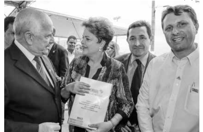
Documento foi entregue na última sexta-feira à presidente Dilma Rousseff, em Florianópolis

Já Dilma Rousseff destacou a atenção especial que deu aos pequenos municípios em seu governo, inclusive com a aquisição de equipamentos para manutenção de estradas vicinais, como retroescavadeiras, motoniveladoras e caminhões-caçamba, para todas as cidades com até 50 mil habitantes. "São ações para aumentar o grau de autonomia dos municípios", disse a candidata à reeleição.