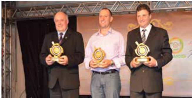
Vencedores na categoria prestação de serviços de pequeno, médio e grande porte