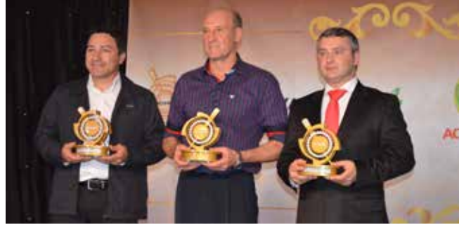
Vencedores na categoria comércio de pequeno, médio e grande porte