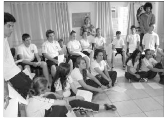
CRAS de Guaraciaba recebeu a visita das turmas do 1º, 2º e 3º anos da Escola de Educação Básica Sara Castelhana Kleinkauf.

Rua Santos Dumont, 745 - Centro - São Miguel do Oeste - SC | lokalacademiasmo@hotmail.com