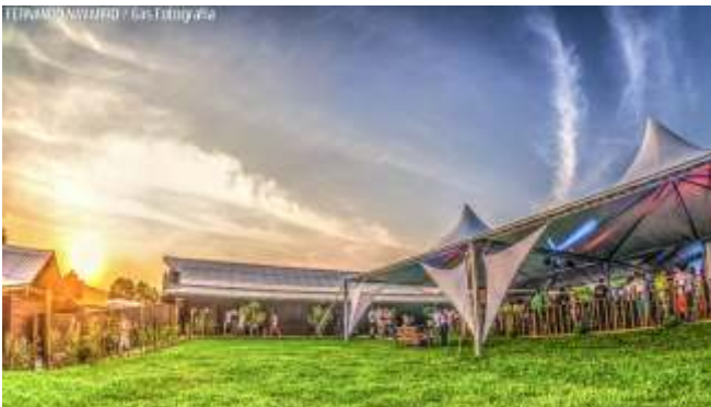
Four Club lotou, novamente, com mais uma super balada

Em tempo: A próxima festa acontece dia 08 de novembro com o Dj e produtor Bruno Baruti - um dos principais artistas do cenário eletrônico nacional -.