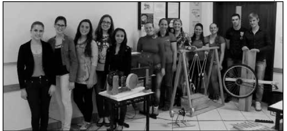
Foi lançado aos alunos o desafio de construir os equipamentos usando materiais de sucata e de baixo valor