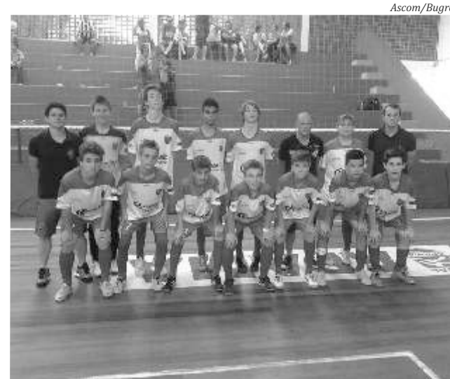
Equipe do Sub-13 voltou de Blumenau com a classificação

O primeiro compromisso em Blumenau, na sexta-feira, 17, o Bugre aplicou 8 X 0 na Recriarte. No sábado pela manhã o adversário foi a Spaca\Blumenau e nova goleada do Bugre, desta vez 6 X 0. O jogo valendo classificação foi diante dos donos da casa, a Apama\Blumenau, com vitória do Bugre por 4 X 0. Com os resultados, o Bugre terminou em segundo lugar do Grupo e carimbou a classificação para as Semifinais do Campeonato Estadual de Futsal Sub-13.