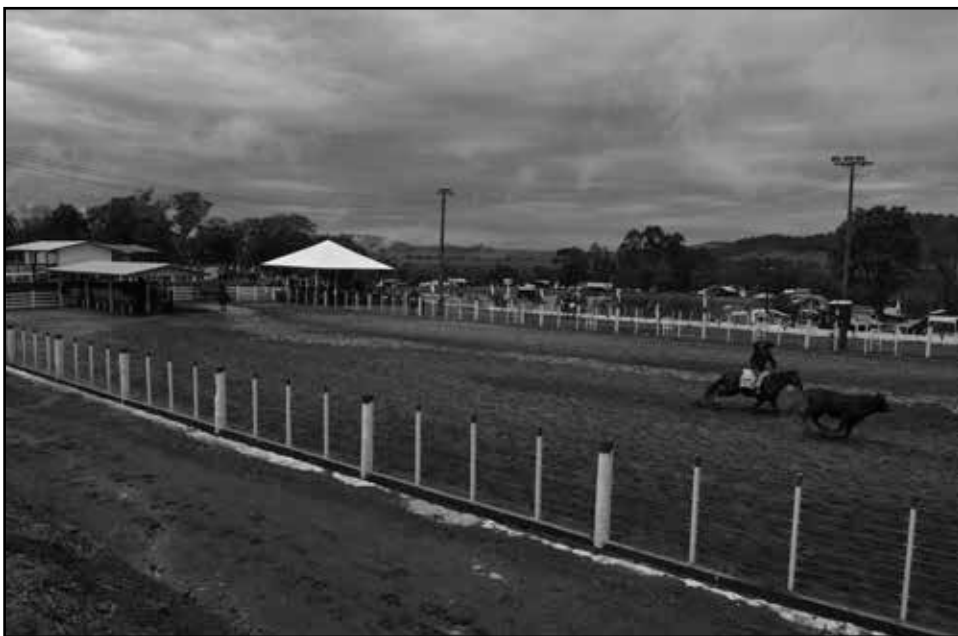
Mais de 100 equipes de laçadores participaram do rodeio