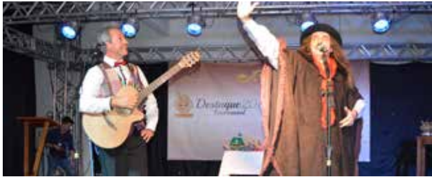
Show "Salada Mística" distraiu o público com humor e música