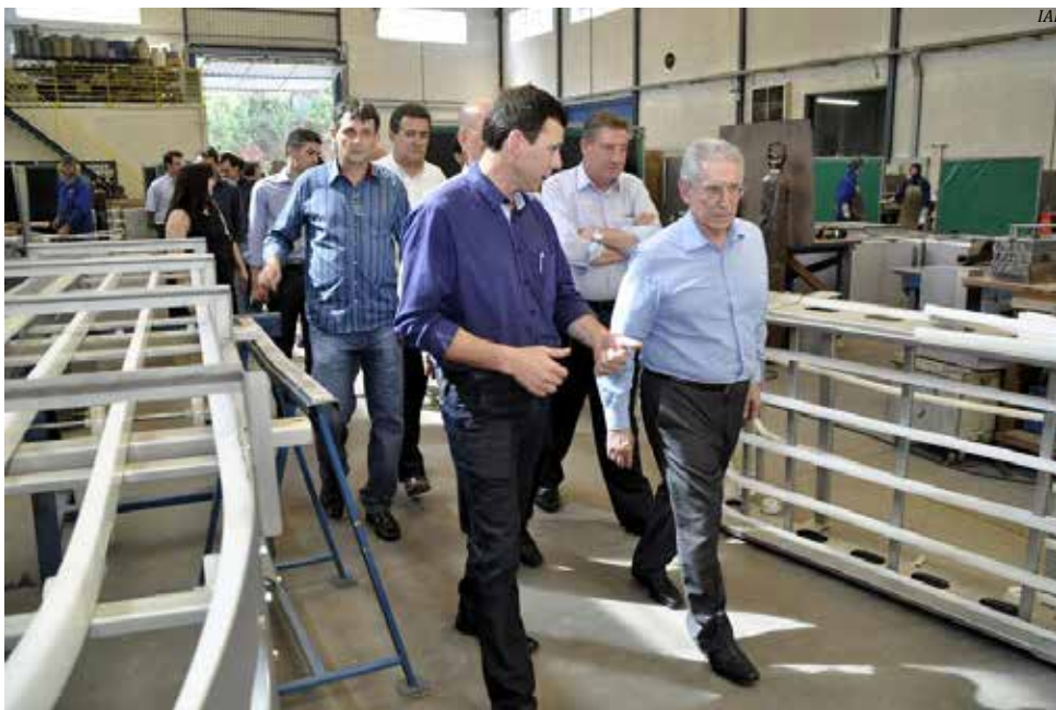
Presidente da Fiesc visitou empresas em São Miguel do Oeste e Paraíso