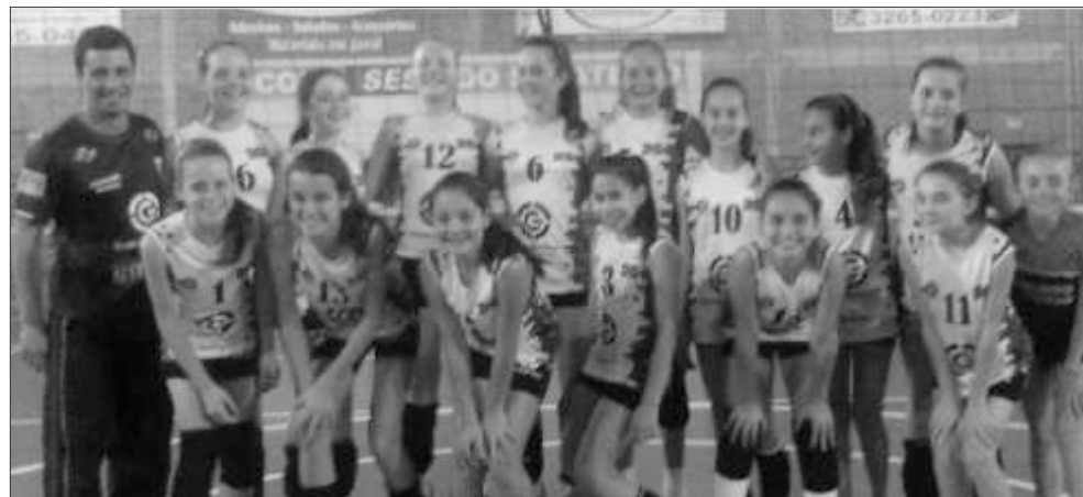
Atletas da categoria iniciante foram a Blumenau e conquistaram a vaga

A Prefeitura de Guaraciaba/AD Guaraciaba participou no ano de 2014 em quatro categorias do Voleibol Feminino em campeonatos promovidos pela Federação Catarinense de Voleibol. O município participou nas categorias Iniciante, Pré-mirim, Mirim e Infantil. Ao todo, serão 12 etapas, das quais 10 já foram realizadas. Quatro dessas etapas classificatórias, uma em cada categoria, foram sediadas em Guaraciaba. Agora em novembro vai sediar a etapa final da Categoria Pré-mirim (até 13 anos) e Iniciante (até 12 anos).