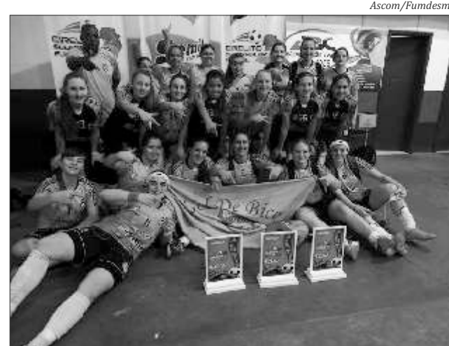
Equipe sagrou-se campeã em três categorias

feminino, sub-18 feminino e adulto feminino. Próxima fase será em Ivaiporã (PR), com a participação de equipes do Paraná, Rio Grande do Sul e Santa Catarina nos dias 5 a 7 de dezembro.