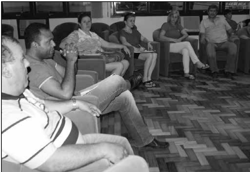
Reuniões definiram como serão realizadas as atividades que envolvem o Natal 2014

Durante reuniões na Fundação Municipal da Cultura, com representantes da Assistência Social, CDL, Loja Markar e representantes dos bairros, ficou