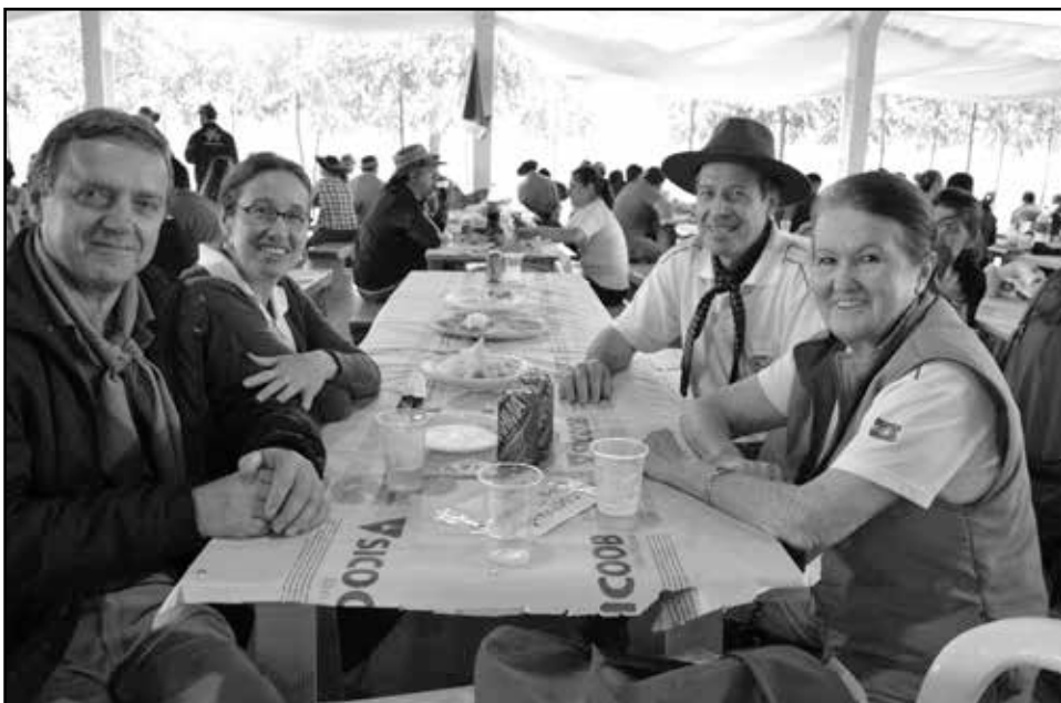
Autoridades e dirigentes de CTG's participaram da abertura