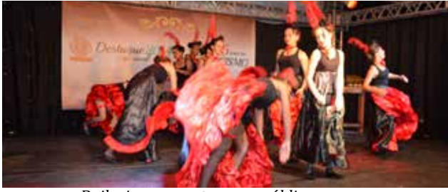
Bailarinas encantaram o público com um show de coreografias