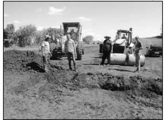
Máquinas trabalharam intensamente na preparação da área

de Gabinete, Hermes Andreola, que está acompanhando as obras, o investimento total será de R$ 135.047,91. O projeto terá 615,80 metros de comprimento por 2,5 metros de largura, resultando em 1.539,50 metros quadrados. "Encerramos a primeira etapa do projeto, que consiste na preparação do terreno. Também foram alocadas as tubulações para a drenagem da água e instaladas as bocas-de-lobo. Num primeiro momento, será construída a calçada para que a população possa fazer suas ca-