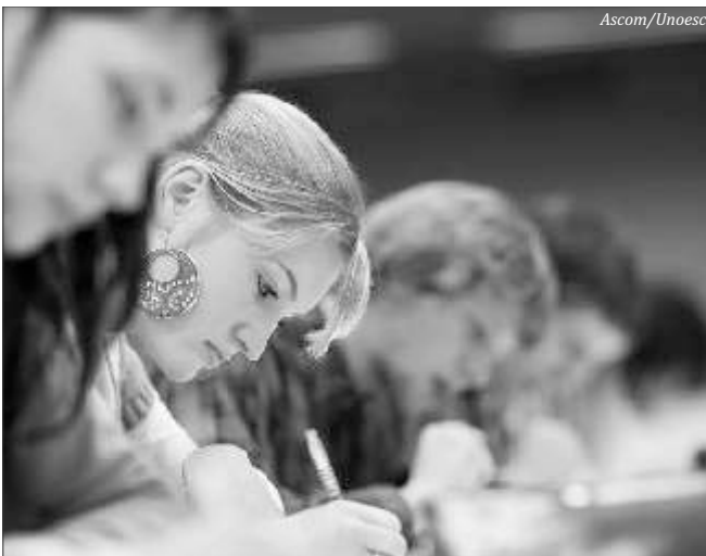
A prova com 63 questões de múltipla escolha e uma redação será realizada dia 23 de novembro

Entre as novidades desta edição do Vestibular de Verão está o curso de Medicina Veterinária, que começará a ser oferecido em Campos Novos. Também iniciam turma no primeiro semestre de 2015 os cursos de Fisioterapia em São Miguel do Oeste, Enfermagem, em Xanxerê e Psicologia, em Videira. Em Chapecó, a novidade é o curso de Arquitetura e Urbanismo com 40 vagas para ingresso no primeiro semestre e 40 no segundo semestre de