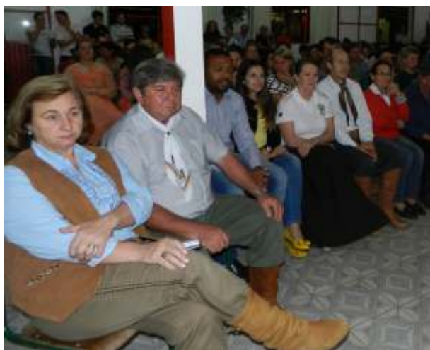
Tradicionalistas e um grande público se fizeram presentes ao evento