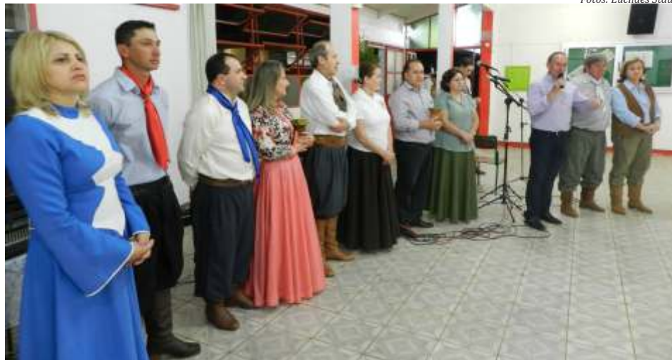
Abertura oficial do evento contou com a presença da direção do Cedup e lideranças tradicionalistas

Na programação da noite, destacaram-se apresentações artísticas e culturais, mateada, jantar típico e fandango de confraternização com apresentação especial do Grupo Folclórico e Vocal do Cedup-GV. O evento integrou a programação oficial da Semana Farroupilha 2014 em São Miguel do Oeste e Descanso.