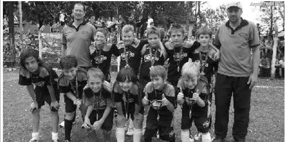
Equipe Sub-10 e 11 anos masculino da Escola Municipal Helga Follman, de Tunápolis, ficou campeã