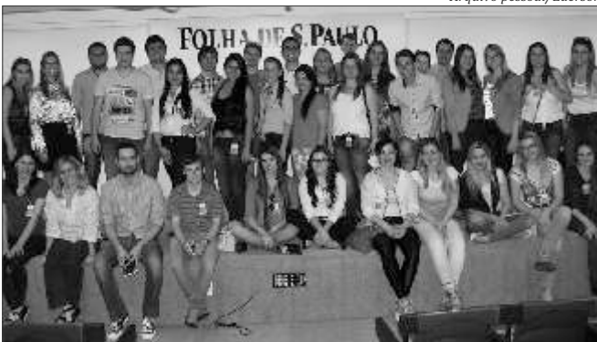
Acadêmicos visitaram a redação da Folha de São Paulo