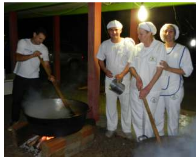
Equipe trabalhou com afinco para preparar o carreteiro