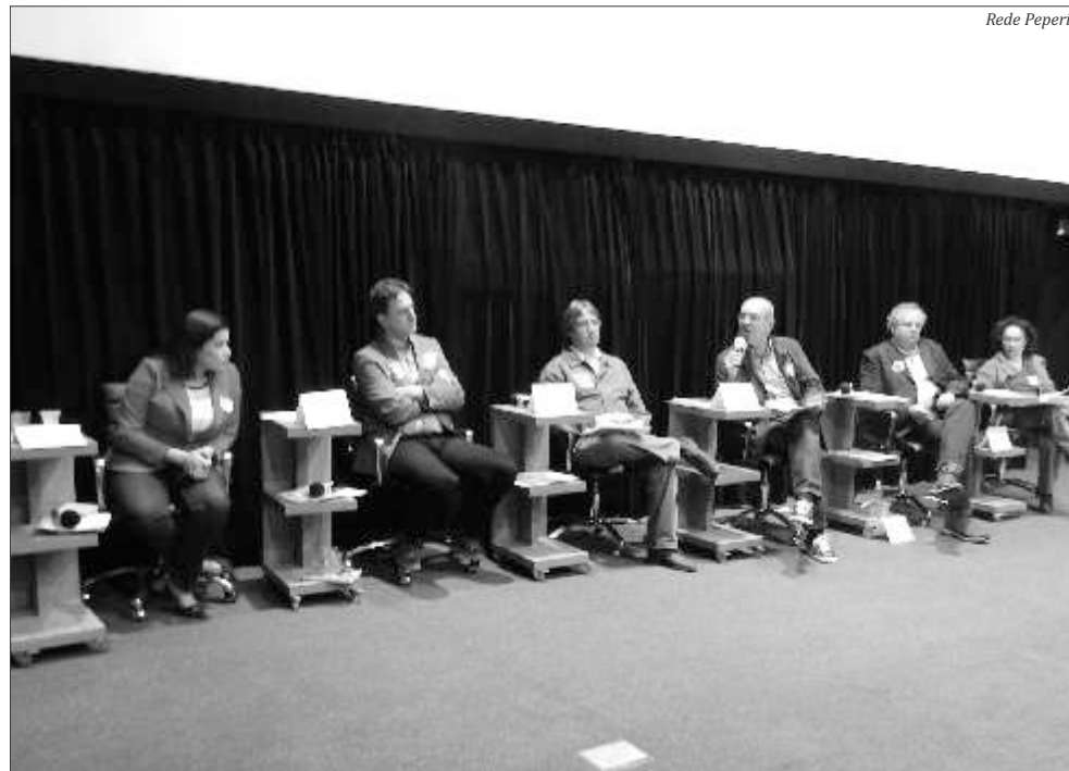
Seis candidatos ao governo do Estado debateram por duas e meia no Cine Peperi

no de Santa Catarina reforçaram a importância do debate da Peperi para o processo eleitoral. Durante o programa, eles destacaram a contribuição do espaço da Peperi para a discussão de ideias e projetos para Santa Catarina. Em vários momentos, os candidatos criticaram a ausência do governador e candidato a reeleição Raimundo Colombo. O candidato do governo anunciou ainda no início da campanha que não participaria de debates no interior do Estado.