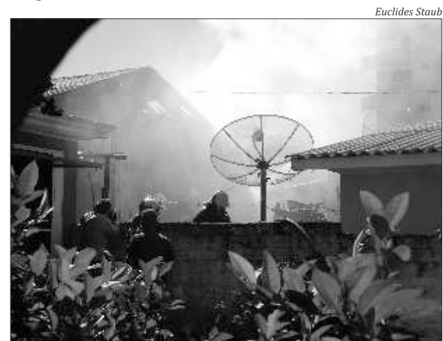
Bombeiros deram combate ao incêndio que destruiu parte da residência

Marli ficou desesperada ao ver o fogo, passou mal e teve de ser atendida pelos bombeiros, que bloquearam a rua para executar os trabalhos até que o incêndio fosse controlado. De acordo com os militares que atenderam a ocorrência, o sinistro consumiu parcialmente a residência, mas ninguém ficou ferido.