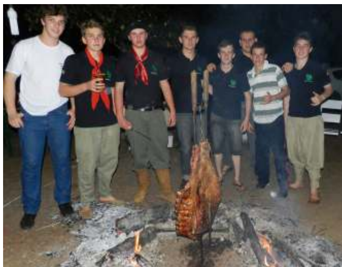
Alunos do Cedup aprendem a fazer o Costelão desde cedo