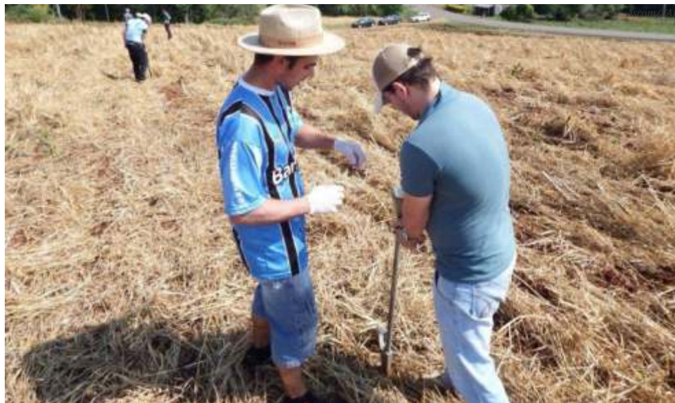
O trabalho visa identificar possíveis aumentos na produção em função do estágio fenológico de aplicação e da eficiência agrônômica da fonte de fertilizante utilizada

Nas últimas safras, muitos produtores, através de informações técnicas e não científicas, têm antecipado as aplicações de fertilizantes nitrogenados na cultura do milho, aplicando nos estádios V2 e V4, ou seja, antecipando as aplicações que normalmente se realizam nos estádios V4 e V8. Esta antecipação das aplicações possibilitam que a planta esteja melhor nutri-