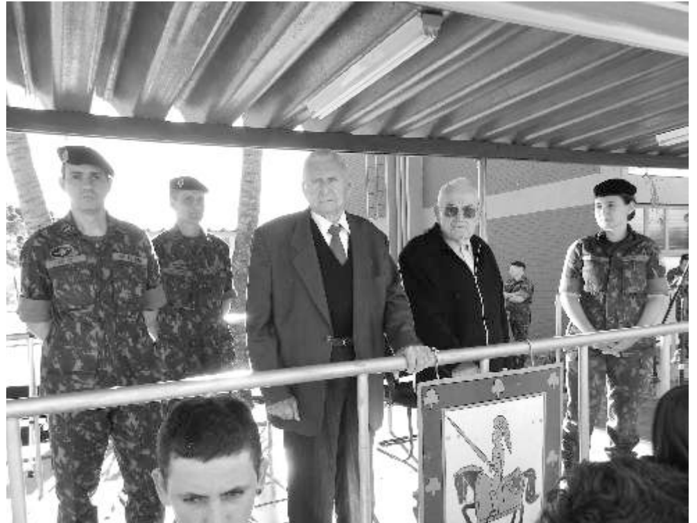
Ex-combatentes estiveram presentes à comemoração dos 70 anos da expedição da FEB

No dia 16 de setembro de 1944 militares da Força Expedicionária Brasileira