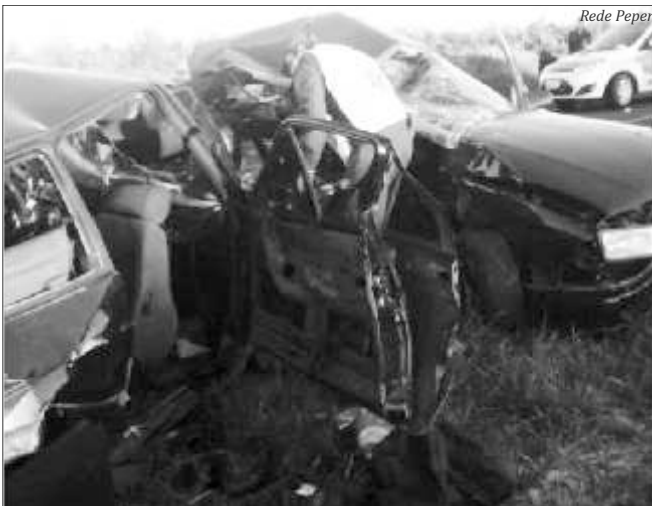
O acidente na BR-161 resultou em quatro mortes e os automóveis totalmente destruídos

Já na madrugada de segunda-feira, o choque entre uma moto e um automóvel deixou uma pessoa morta, na BR-282, em São Miguel do Oeste. O acidente