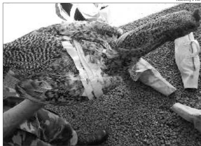
Aves estavam com ferimentos resultantes das brigas em rinha