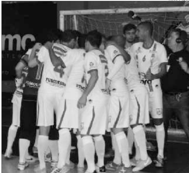
A Asme saiu na frente, mas acabou permitindo a virada da Adesp Pinhalzinho

Araquari e Adesp Pinhalzinho seguem adiante no retorno. Os quatro primeiros na classificação do retorno seguem para as semifinais. Asme, Curitiba Futsal e ADV/Videira se despedem do Estadual. O Futsal São Lourenço, já classificado pelo índice, aguarda as finais do retorno. Fechando a rodada, o Araquari devolveu a goleada sofrida na primeira partida com juro, fazendo 10 X 4 no tempo normal e levou a partida para a prorrogação, onde voltou a vencer pelo placar de 4 X 0.