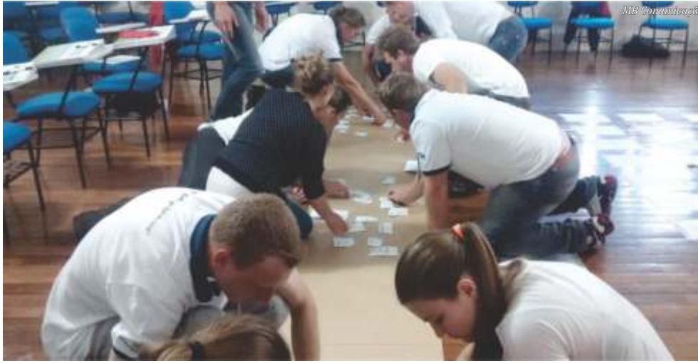
Grupo do Jovem Coop, de Iporã do Oeste, foi um dos abrangidos pelas atividades desenvolvidas pelo Sescoop

são o ensino de formação profissional e cooperativista para empregados e dirigentes de cooperativas, a promoção social para essa mesma clientela, abrangendo também a cooperados e o monitoramento das cooperativas nos seus aspectos econômicos, legais e sociais. Os principais programas mantidos em Santa Catari-