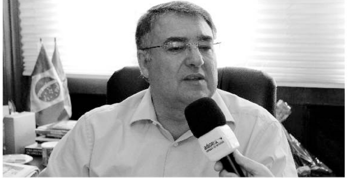
O Pacto é de 10 bilhões de reais. Não há investimentos cerca de um bilhão. A previsão para 2014 é investir e pagar cerca de 30% e depois em 2015, 2016... Tem obra que vai até 2017, dentro desse programa de investimento, que é o maior que SC teve até hoje.

Nós temos ajudado bastante o Hospital Nossa Senhora do Perpétuo Socorro, mas a verdade é que eles estavam com problema de gestão. Mas tem que haver um sistema de trabalho. Nós estamos pagando por produtividade. Por exemplo, pagávamos R$ 400 o leito de UTI, passou para R$ 800, para podermos estimular a abertura de UTIs. Nós passamos a pagar a Roda de Urgência e Morgonêcia por valor muito maior, então, conforme o serviço prestado, o hospital tem mais arrecadação. A mesma coisa vale para a Rede Cegonha, um programa federal que nós fortalecemos. Agora, nosso sistema não é uma cota anual, ele é de produtividade - prestou o serviço, nós ajudamos.