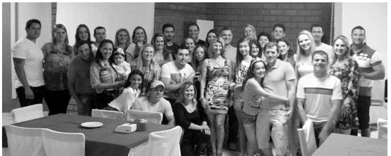
Confraternização final de ano alunos Lokal Academia! Agradecemos a presença de todos!