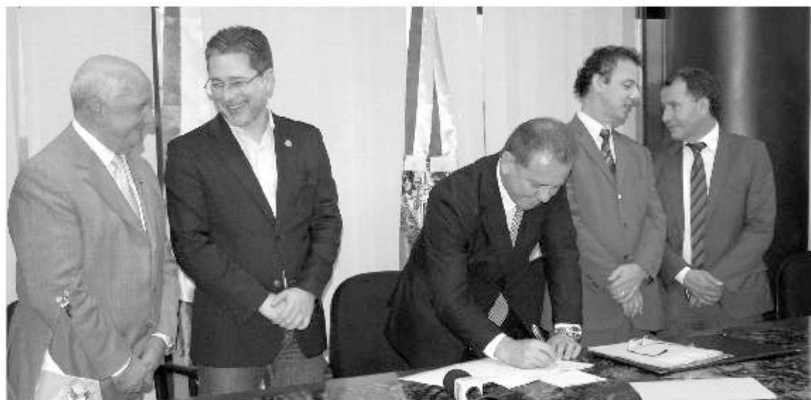
Como governador do Estado interino, Ponticelli sancionou lei que reconhece a Adjori/SC como entidade de Utilidade Pública Estadual

"Preocupação com o crack, readequação do Código Ambiental catarinense à nova regulamentação federal, a valorização do carvão mineral como matriz energética importante para o Brasil e a preocupação constante com o risco devastador que o crack tem na sociedade. Esses três pontos são de fundamental importância para Santa Catarina e, por isso, foram nossas bandeiras".