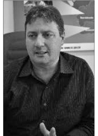
O secretário Regional, Volmir Giumbelli conduziu os trabalhos da SDR de São Miguel do Oeste em 2013