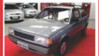
GOL 94 por R$ 6.900,00