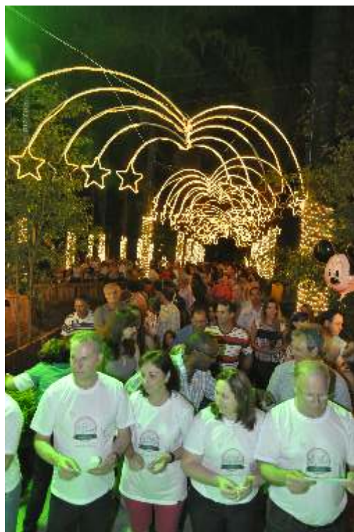
Gruta é destaque na Iluminação