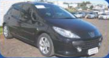
307 HB FELINE 2.0 AUT. - 2011