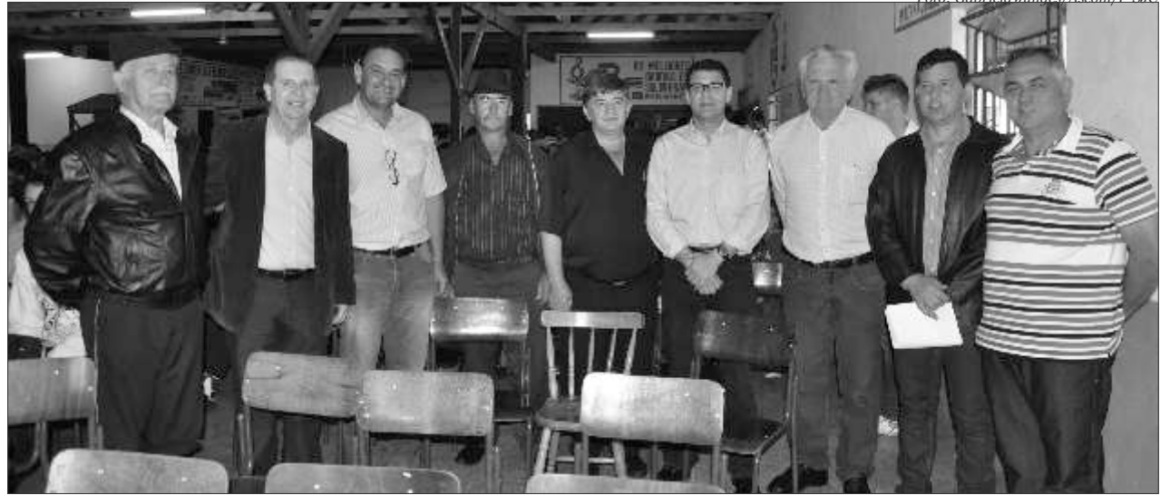
Ato teve a presença de mais de 400 pessoas, além de autoridades regionais e estaduais

São José do Cedro A Secretaria de Estado de Desenvolvimento Regional de Dionísio Cerqueira participou na manhã de sexta-feira, 29, na comunidade de São Vendelino, interior de São José do Cedro, da Audiência Pública promovida pela Assembleia Legislativa (Alesc). A agenda foi proposta pela comissão dos transportes, com o objetivo de buscar a estadualização da rodovia municipal que liga São José do Cedro a Palma Sola, num trecho aproximado de 42 quilômetros.