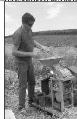
Experimentos com trigo conduzidos pela Agronomia da FAI indicam altíssima produtividade em Itapiranga

Itapiranga O curso de Agronomia da FAI conduziu neste ano dois importantes experimentos com a cultura do trigo em Itapiranga. Os resultados destes experimentos demonstram que quando a cultura é bem manejada, é possível obter altíssimos rendimentos em nossa região.