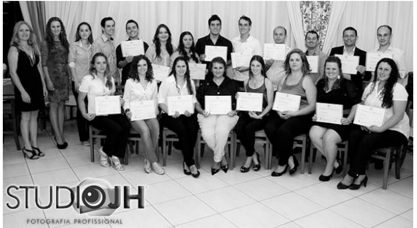
Formatura do Dale Carnegie aconteceu dia 26 de novembro, nas dependências do Restaurante Degustare. Parabéns a todos.