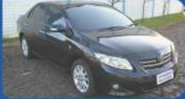
COROLLA SEG 1.8 AUT. - 2010