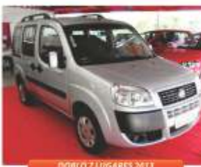
DOBCO 7 LUGARES 2013