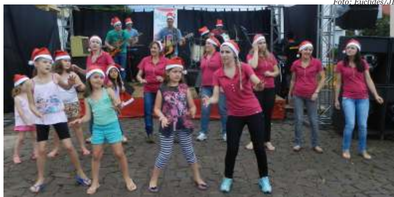
Equipe da Markar Papelaria e Bazar recepcionou o Papai Noel

São Miguel do Oeste O Natal Regional com Amor e Paz 2013 – Caminhos de Luz de São Miguel do Oeste foi inaugurado oficialmente na noite de sábado, 30. A primeira atração da noite foi a tradicional chegada do Papai Noel de Helicóptero em frente à Papelaria e Bazar Markar. Na recepção, centenas de crianças e