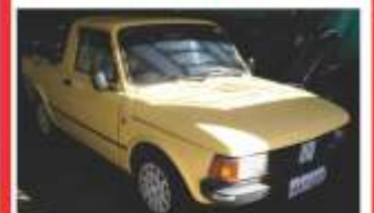
FIAT 147 por R$ 2.500,00