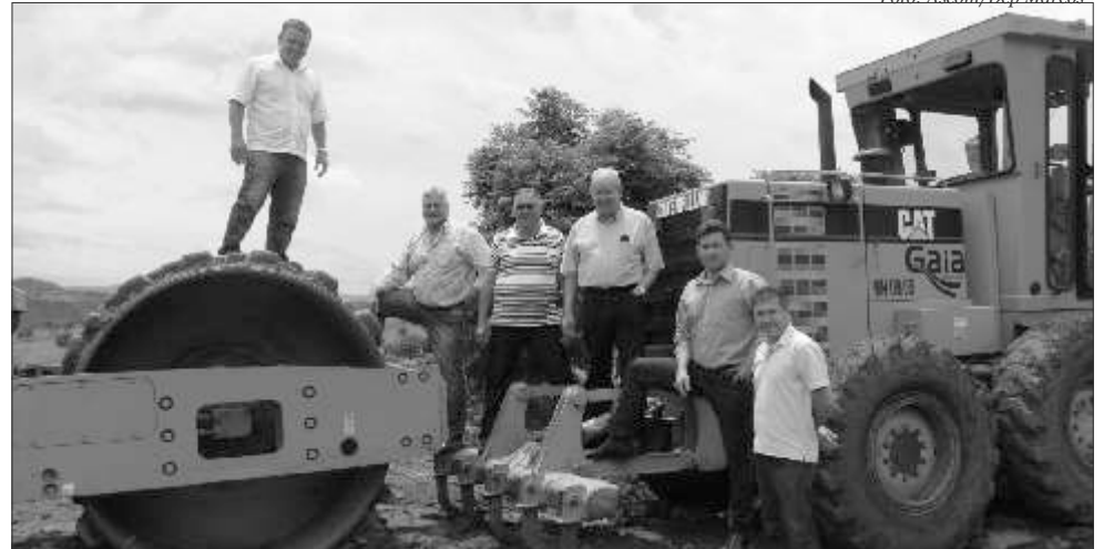
Vieira visitou as obras da SC -161 nas proximidades da divisa dos municípios de Romelândia e Anchieta