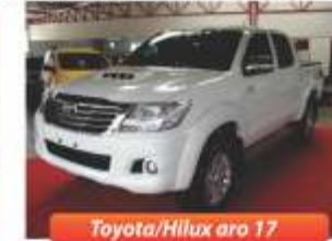
Toyota/Hilux aro 17