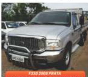
F350 2008 PRATA COM CARROCERIA E AR CONDICIONADO

NOVEMBRO ESPECIAL na Itamar Automóveis, com super promoções para eletricitista, pedreiro, encanadores e trabalhadores autônomos, confira os preços e opções de pagamentos: