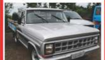
F1000 81 por R$ 17.900,00