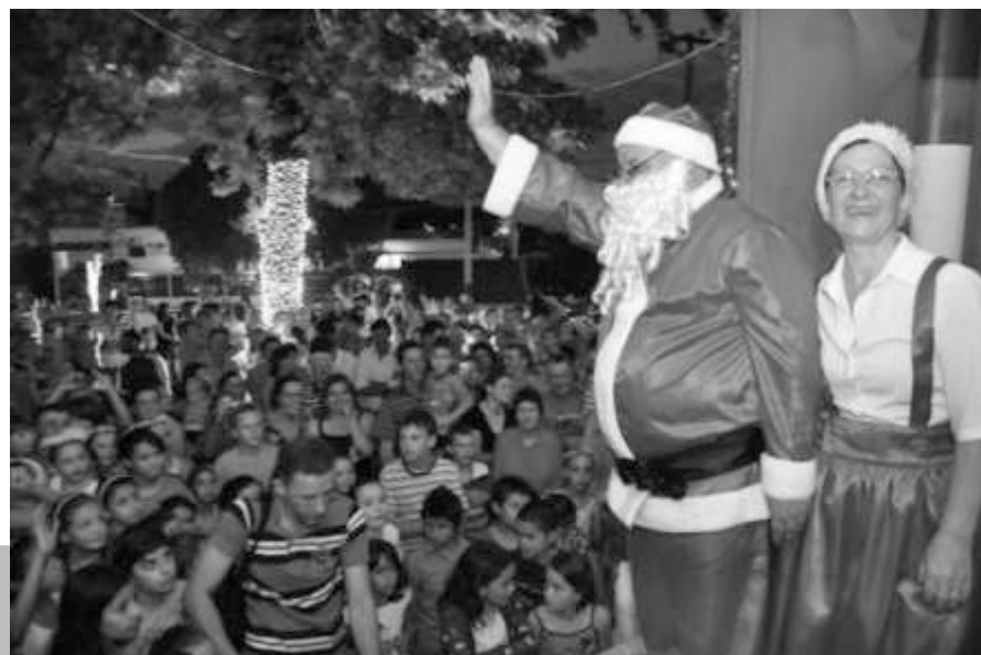
Guraciaba inaugura Luzes Natalinas