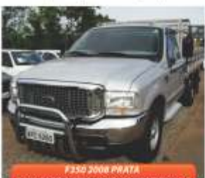
F350 2008 PRATA COM CARROCERIA E AR CONDICIONADO

NOVEMBRO ESPECIAL na Itamar Automóveis, com super promoções para eletricitista, pedreiro, encanadores e trabalhadores autônomos, confira os preços e opções de pagamentos: