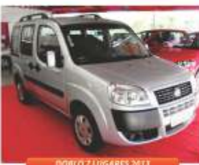
DOBCO 7 LUGARES 2013