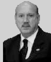
Luiz Henrique da Silveira Senador da República

Por isso, mais até do que em relação ao Petróleo, devemos alardear: o Nióbio é nosso.