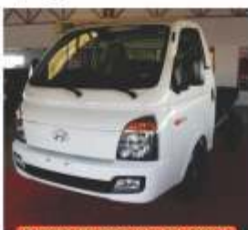
HYUNDAI HR ZERO KM PARA 1.800 Kg