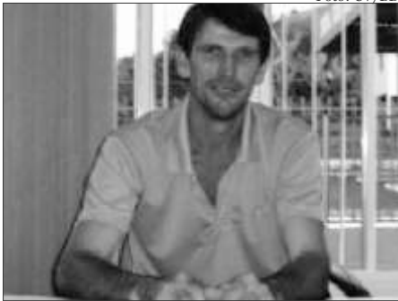
Trevisan foi morto com tiro no peito na Linha São Pedro, interior do município