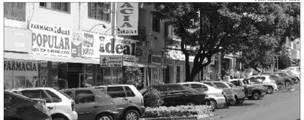
Estacionamento rotativo vem sendo debatido intensamente