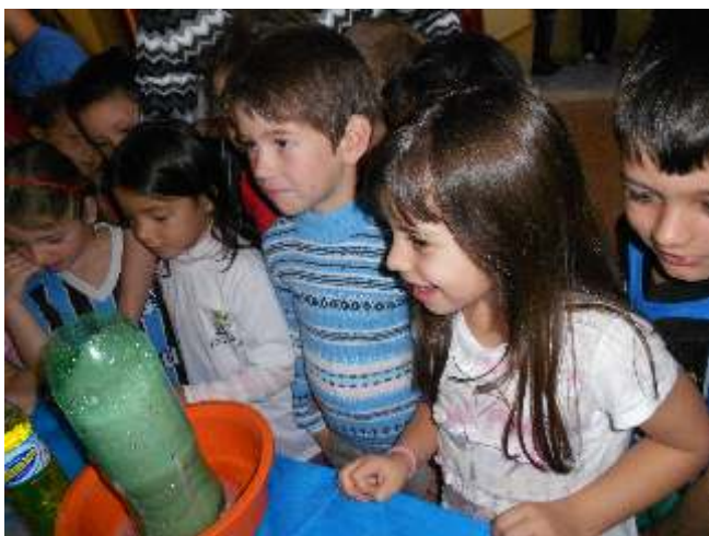
Participaram alunos de 3 escolas de Bandeirante

Bandeirante Na quarta-feira, dia 11, foi realizada a Feira de Ciências e Mostra de Trabalhos da Escola Básica Hélio Wasum, com a participação da comunidade escolar, alunos das três Escolas Municipais e comunidade local, que puderam prestigiar a abertu-